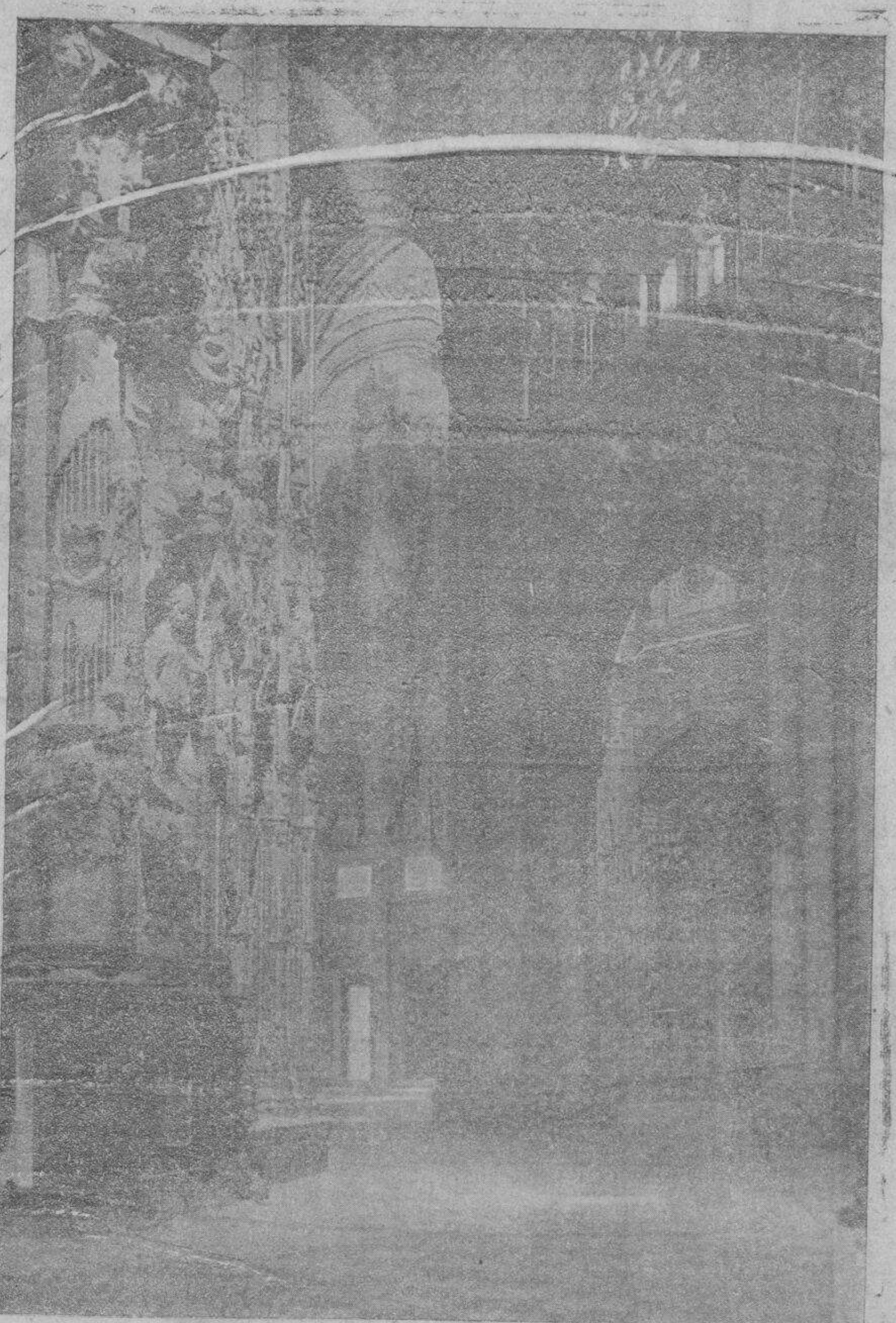
De la maravillosa Catedral Primada

Bajo las espléndidas navas catedralicias, todo es poesía, la más elevada poesía, porque todo es arte y todo es devoción.