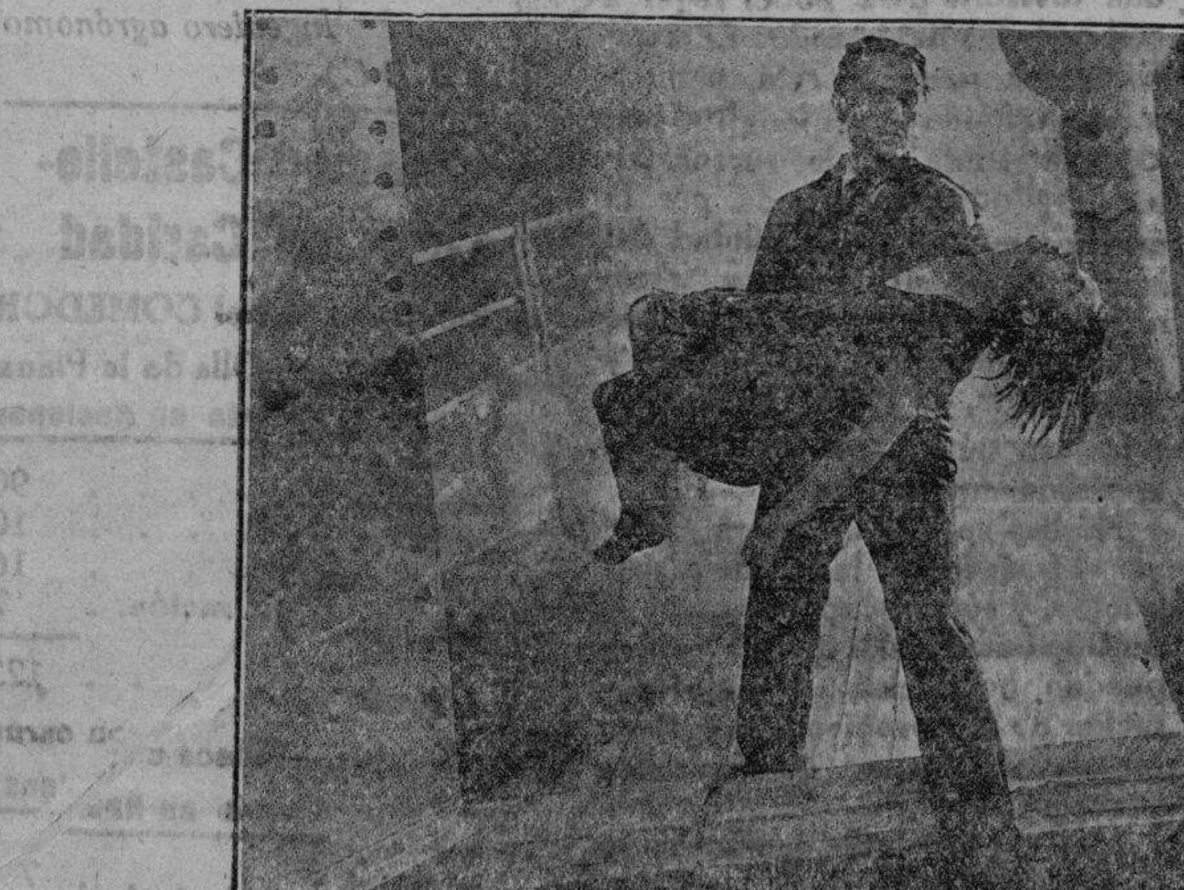
Una interesante escena de la emocionante película Sonora LA ISLA DE LOS BARCOS PERDIDOS que hoy se estrena en el SALON ROYAL