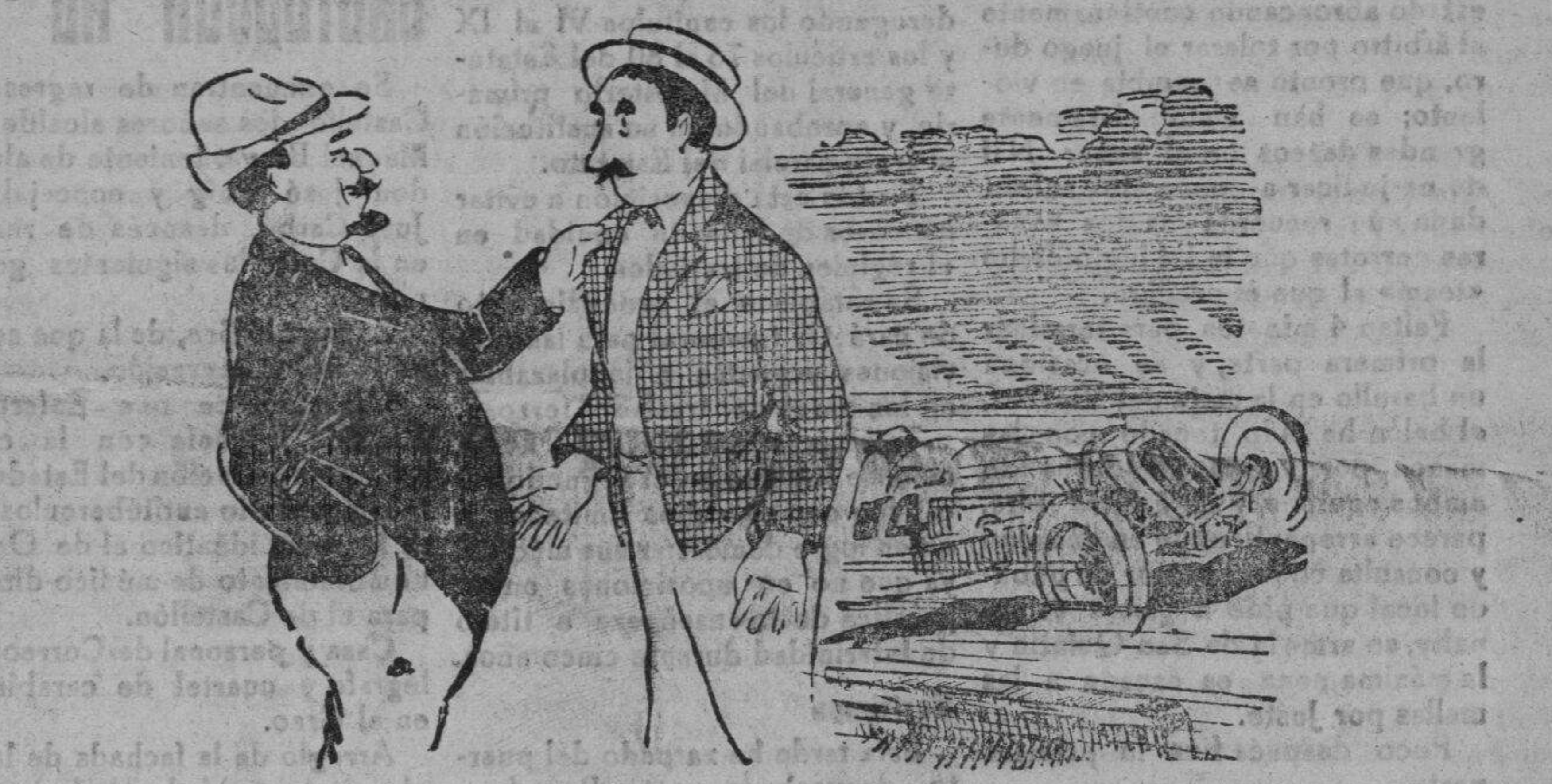
El minuto de 500 años