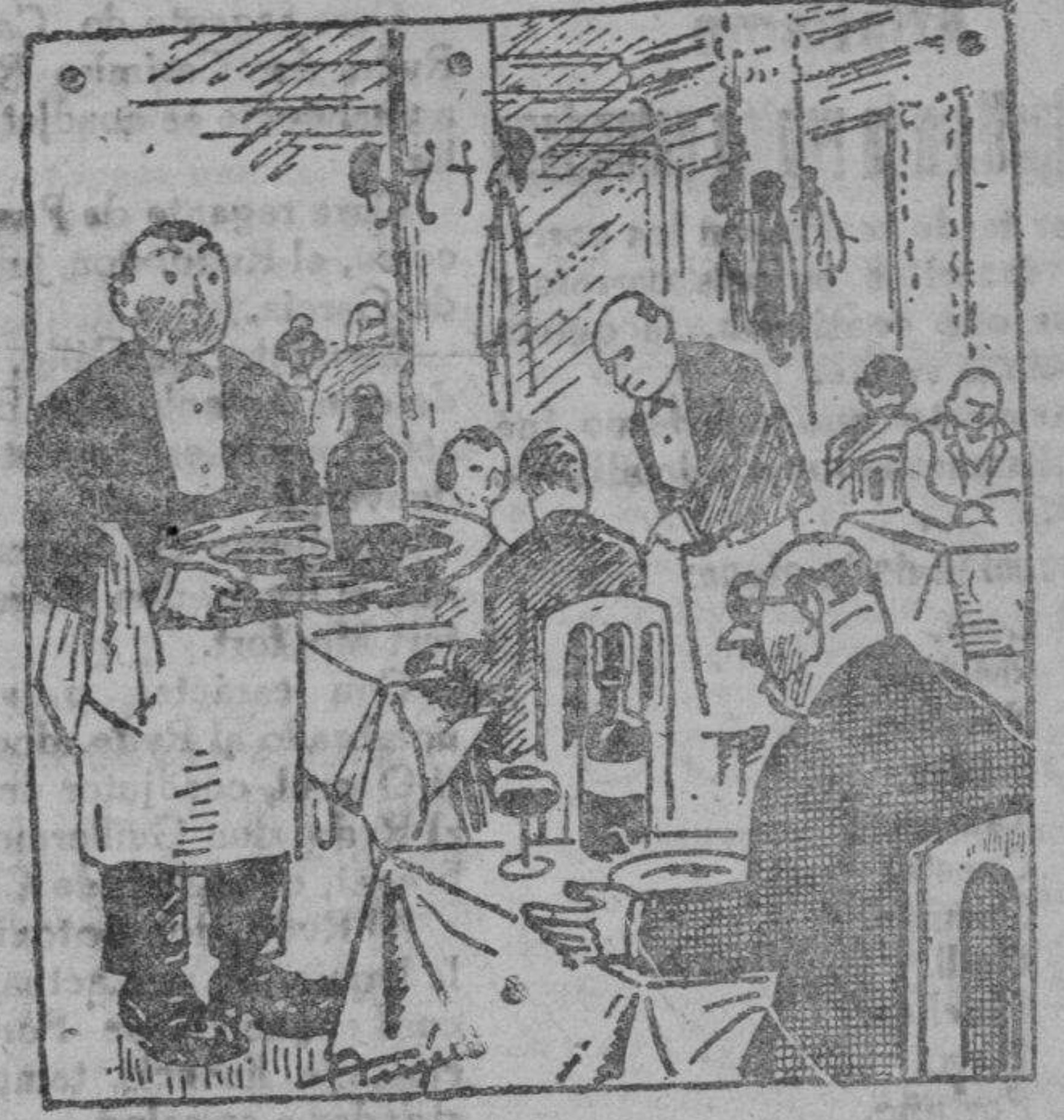
La edad del fileto

—¿Quiere usted hacer el favor de decirme, camarero, la edad de este fileto? —Caballero, su dentadura lo dirá.