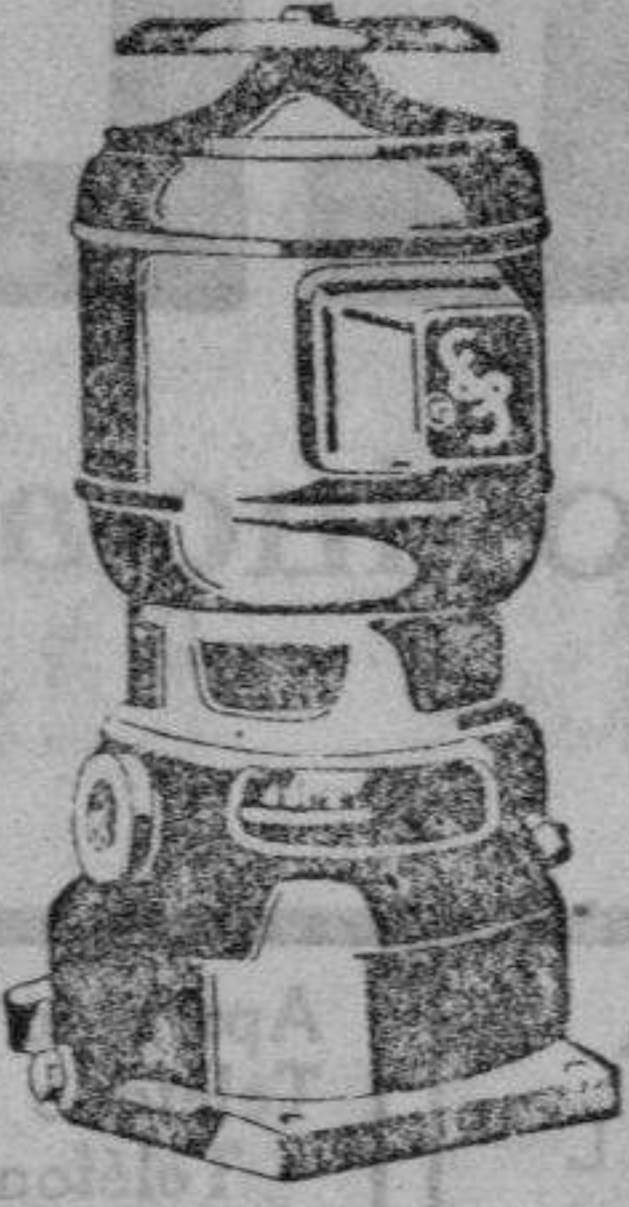
Con motor monofásico ideal para casas particulares hasta 900 litros por hora y 17 metros de altura manométrica.

SIEMENS INDUSTRIA ELECTRICA S.A. Oficina Técnica: Valencia, Pascual y Genís, 6