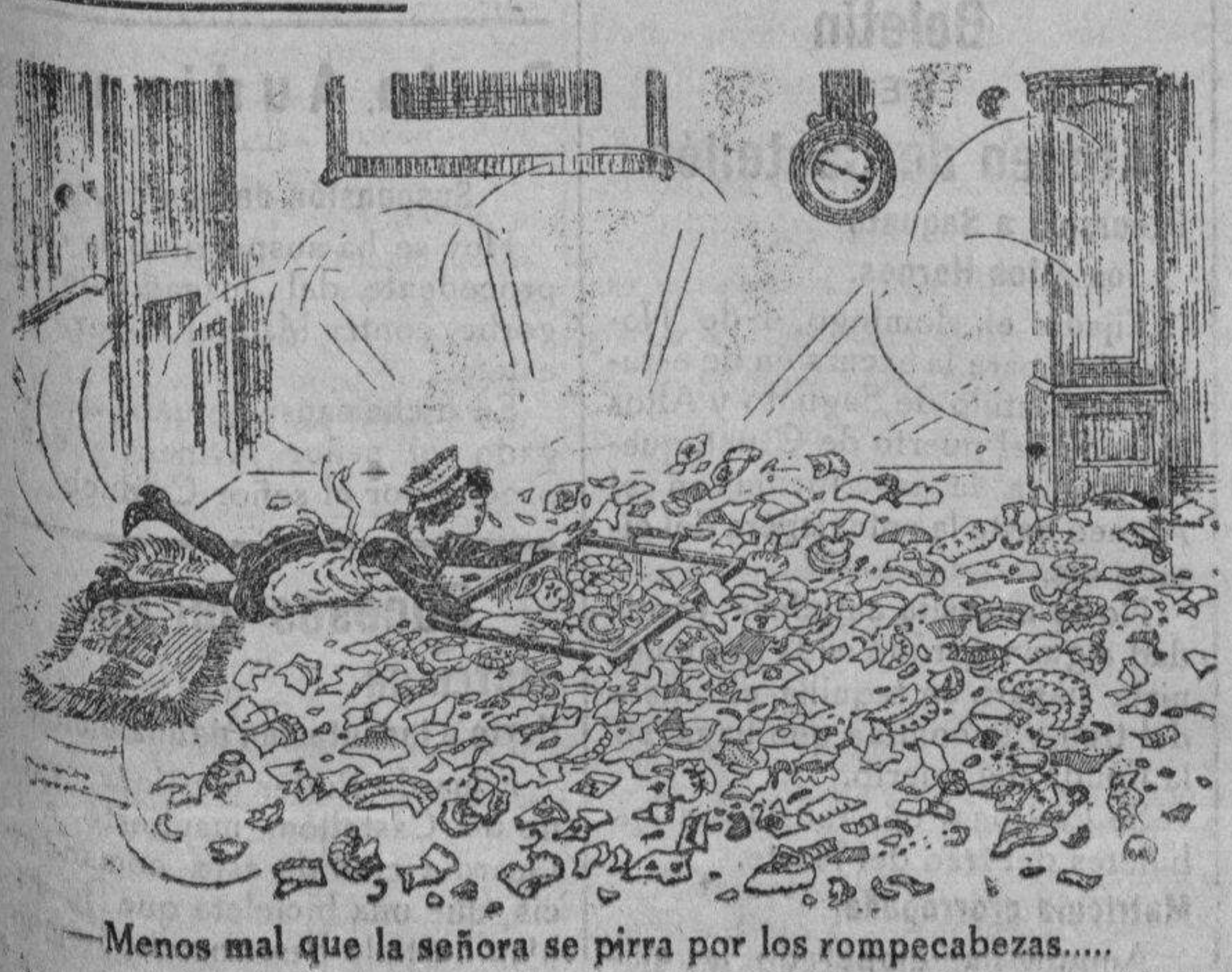
—Menos mal que la señora se pirra por los rompecabezas....

los niños. Se proyectará la interesante película de aventuras «El policía conwoy», por el famoso caballista Tom Tyler, Chispita y Viviales». Como los precios son reducidos, como lo demuestra que la entrada general vale 10 céntimos y dado el aliciente del programa, la velada se verá llenísima de pequeños.