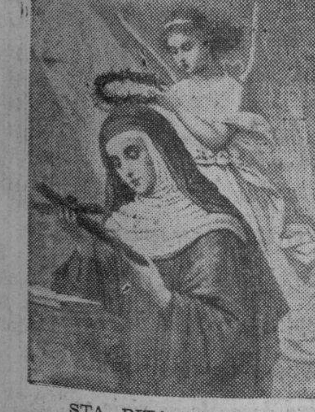
STA. RITA DE CASIA

A San Antonio de Padua le llamó Leon XIII "El Santo de todos". Santa Rita de Casia merece el calificativo de "La Santa de todos". Es algo singular lo que con ella pasa. Su nombre y su memoria despiertan simpatías desde el primer momento en todos los corazones. Su devoción nace y crece espontáneamente, sin que nadie la propague. Sus imágenes, apenas colocadas en un altar de un templo, atraen la atención de los fieles.