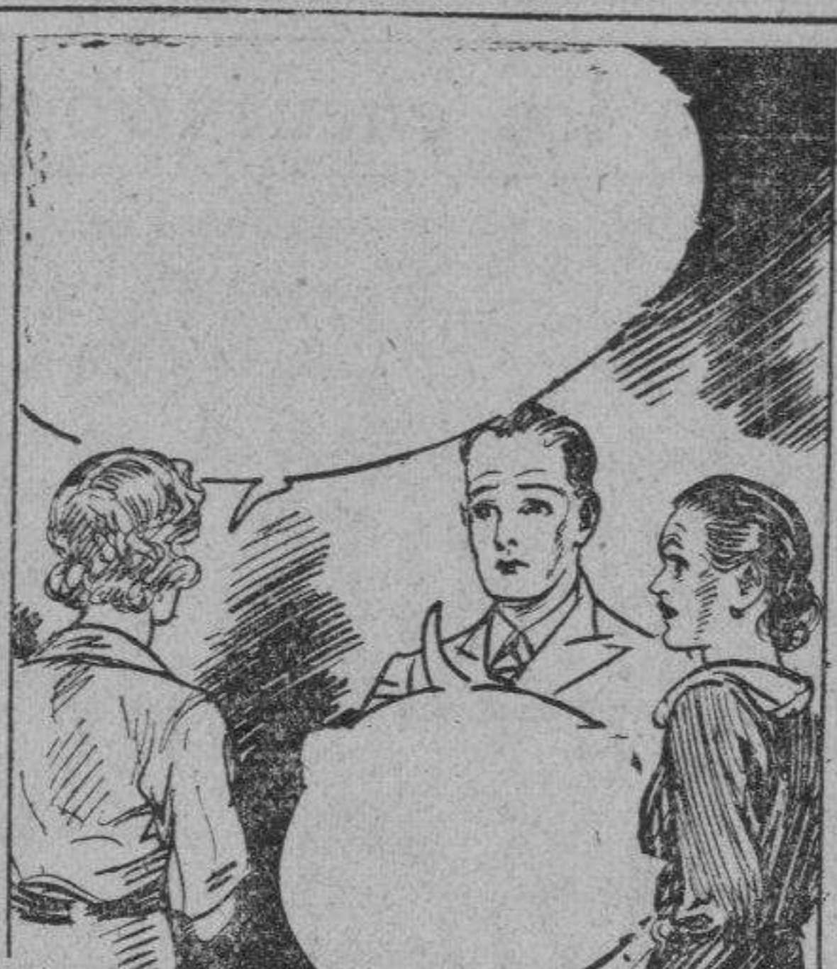
CONNIE: y el hombre que está al fondo de todos estos sucesos extraños en el castillo de Trent tenía que ser esa clase de hombre. Admito que estoy haciendo llamar de cábalas, pero todos se relacionan. SAUL: Ya lo creo que sí. Con que cree Vd. que es Milton?