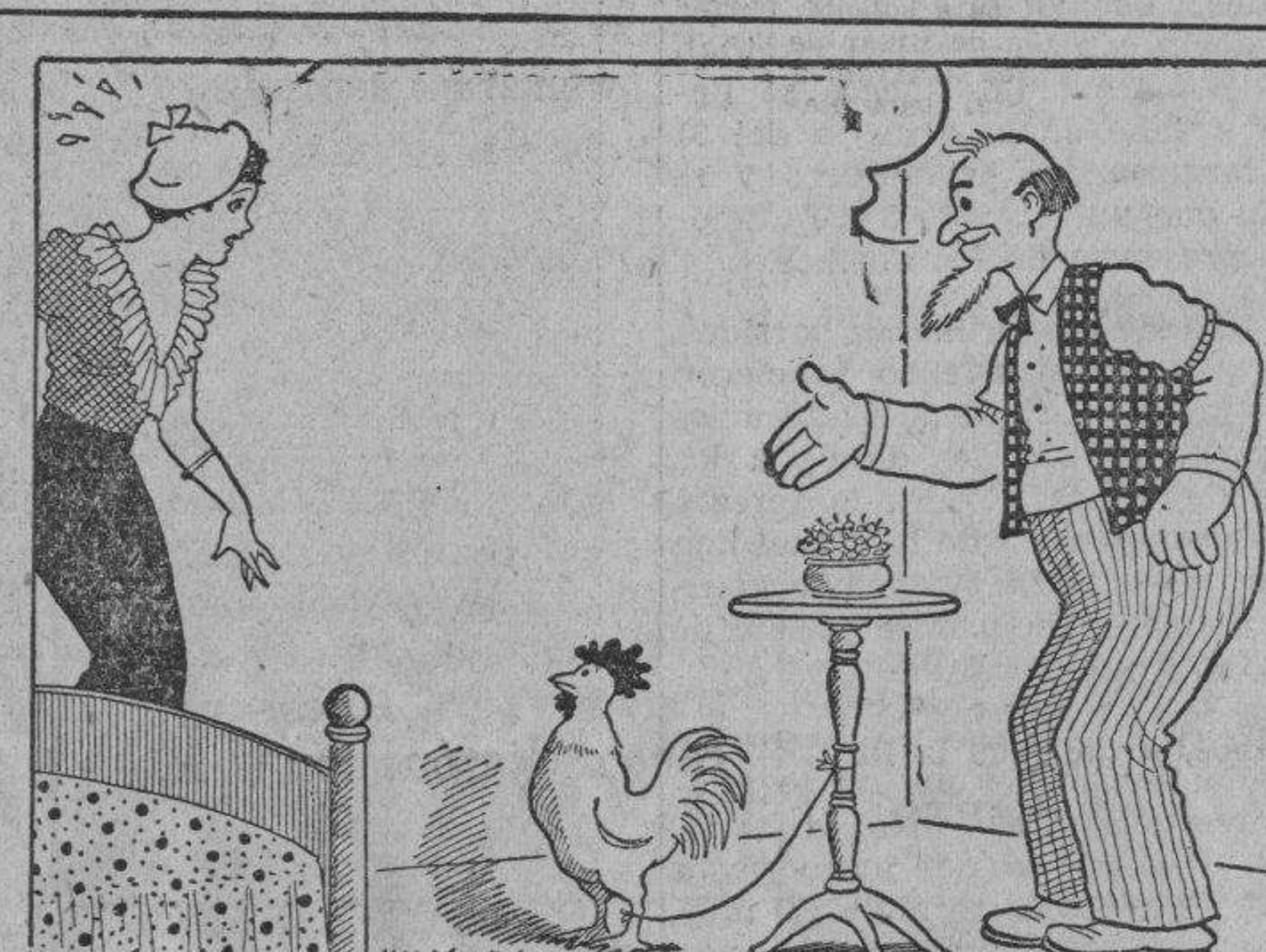
EL VIEJO: Ah! lo tiene. Les despertará a eso de las cinco y media.