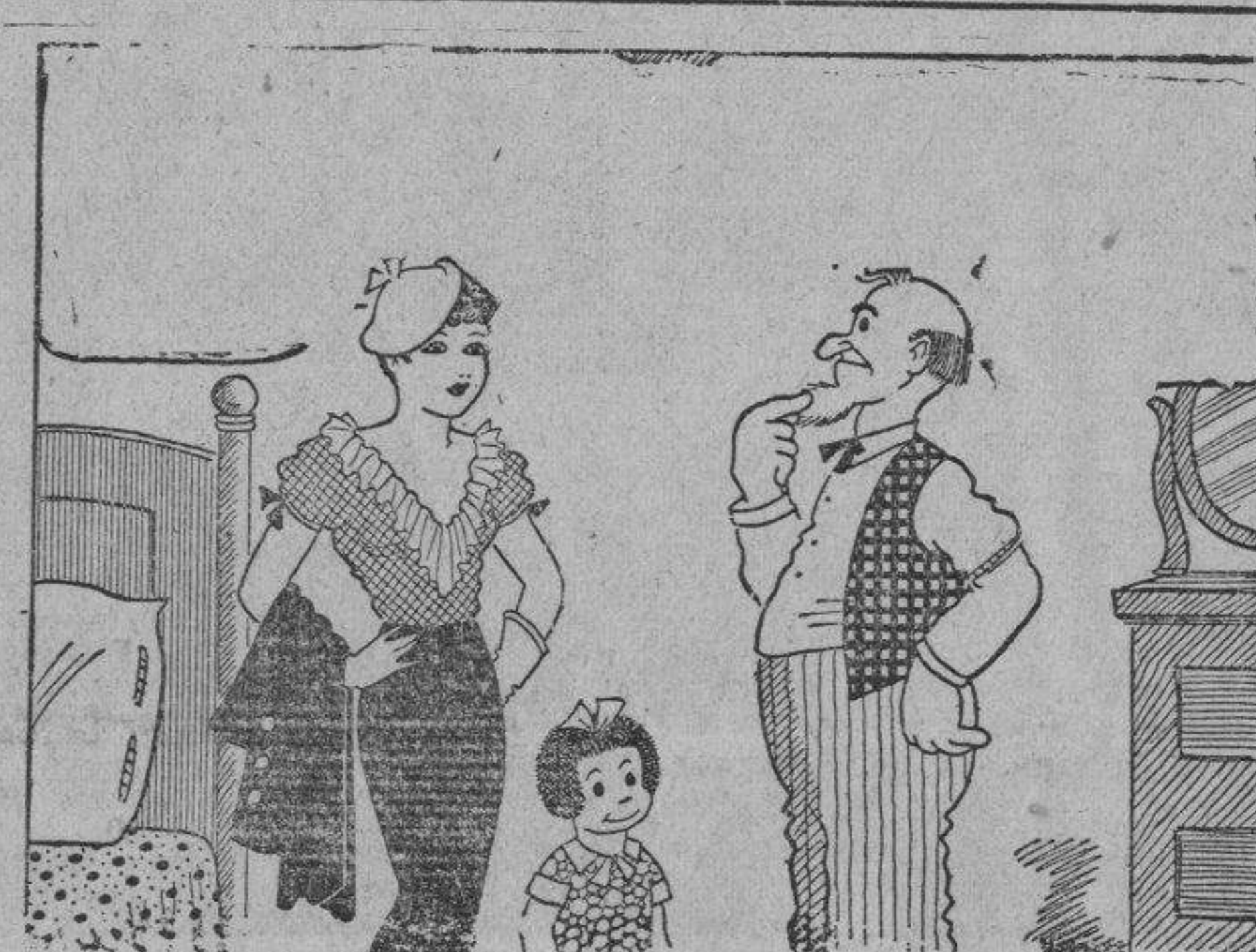
FRITZI: Podría yo tener un despertador? Queremos levantarnos muy temprano. EL VIEJO: No tengo un despertador. Pero le daré algo tan bueno como un despertador.