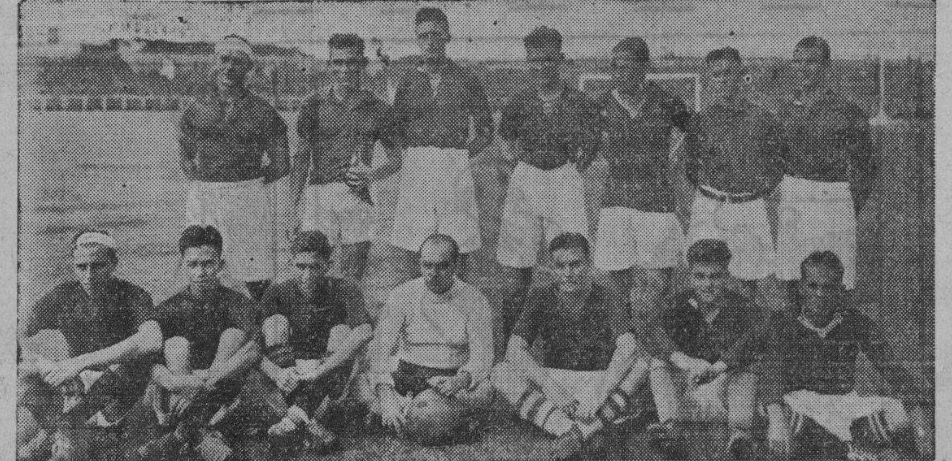
He aquí los equipos de futbol que ayer tarde vencieron en sus respectivos partidos, en el Jose Rizal Memorial Field. Arriba, el once Inchausti y Co. que ganó el partido decisivo contra Roxas-San Miguel.