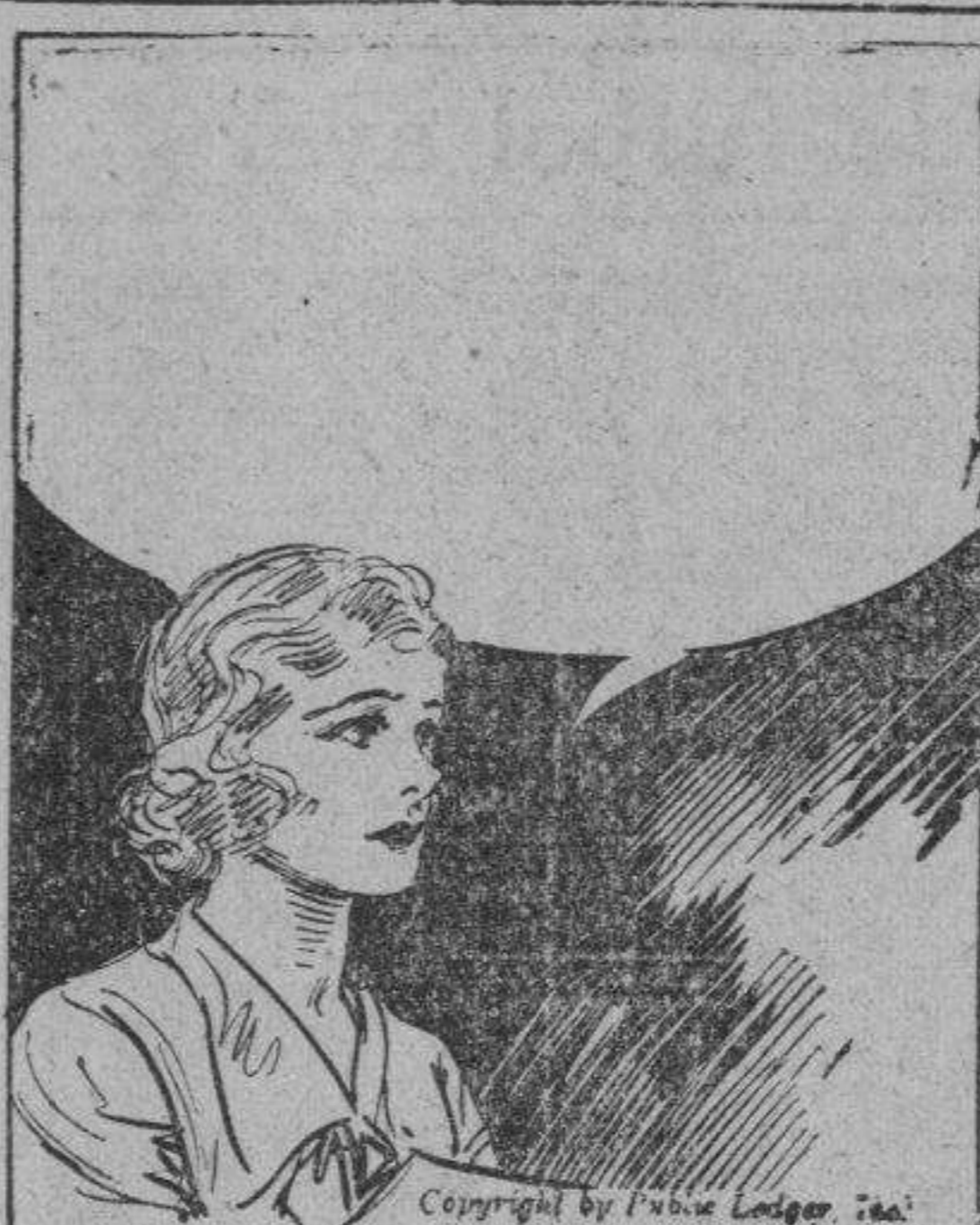
CONNIE: He encontrado muchas cosas sobre Mr. Milton. Antes de que estudiara la abogacia, él era un actor. Así mismo, ha tenido una afición a la ciencia y a la invención, para no mencionar sus pinturas hechas como aficionado. En breve, es un hombre notablemente versátil.