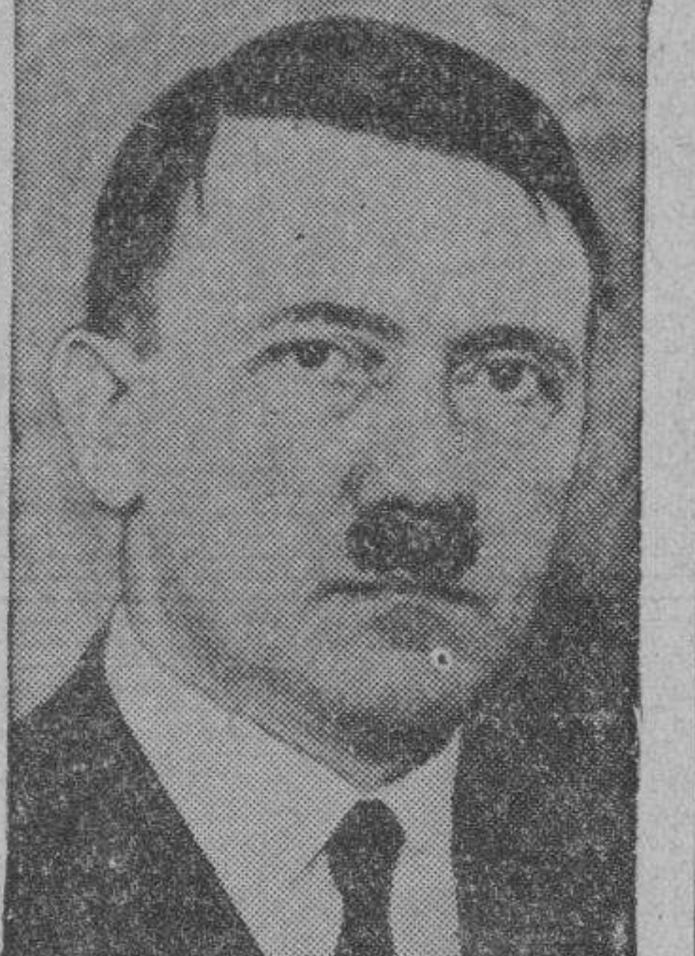
ADOLFO HITLER, Presidente y canciller de Alemania que ha dicho que si dependiese de su país, ya no habría ninguna guerra mas.