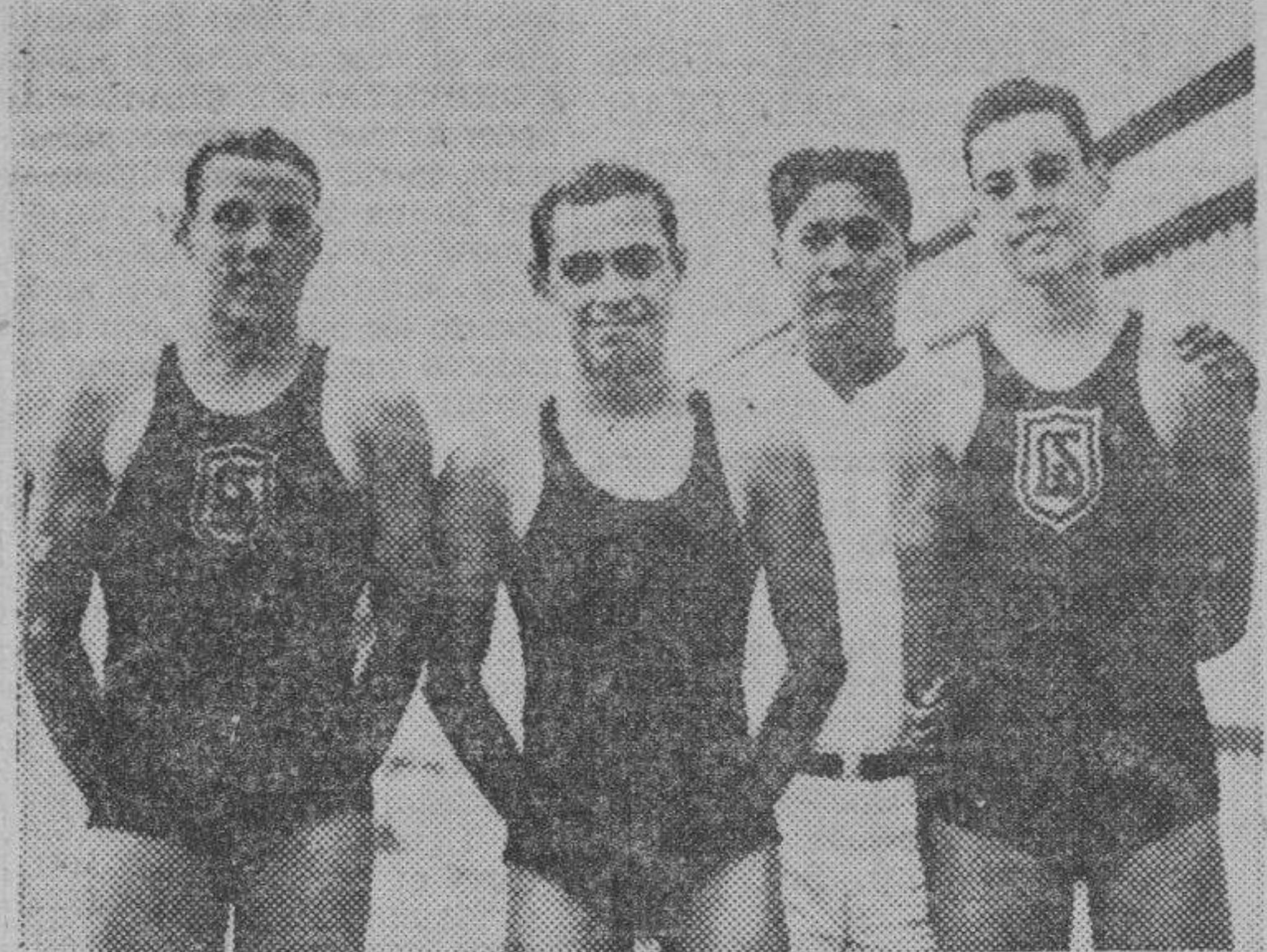
He aquí el equipo de nadadores de La Salle, con su coach, que batio el record de 300 metros medley relay en las competencias del sábado en relación con el actual torneo junior de natación.