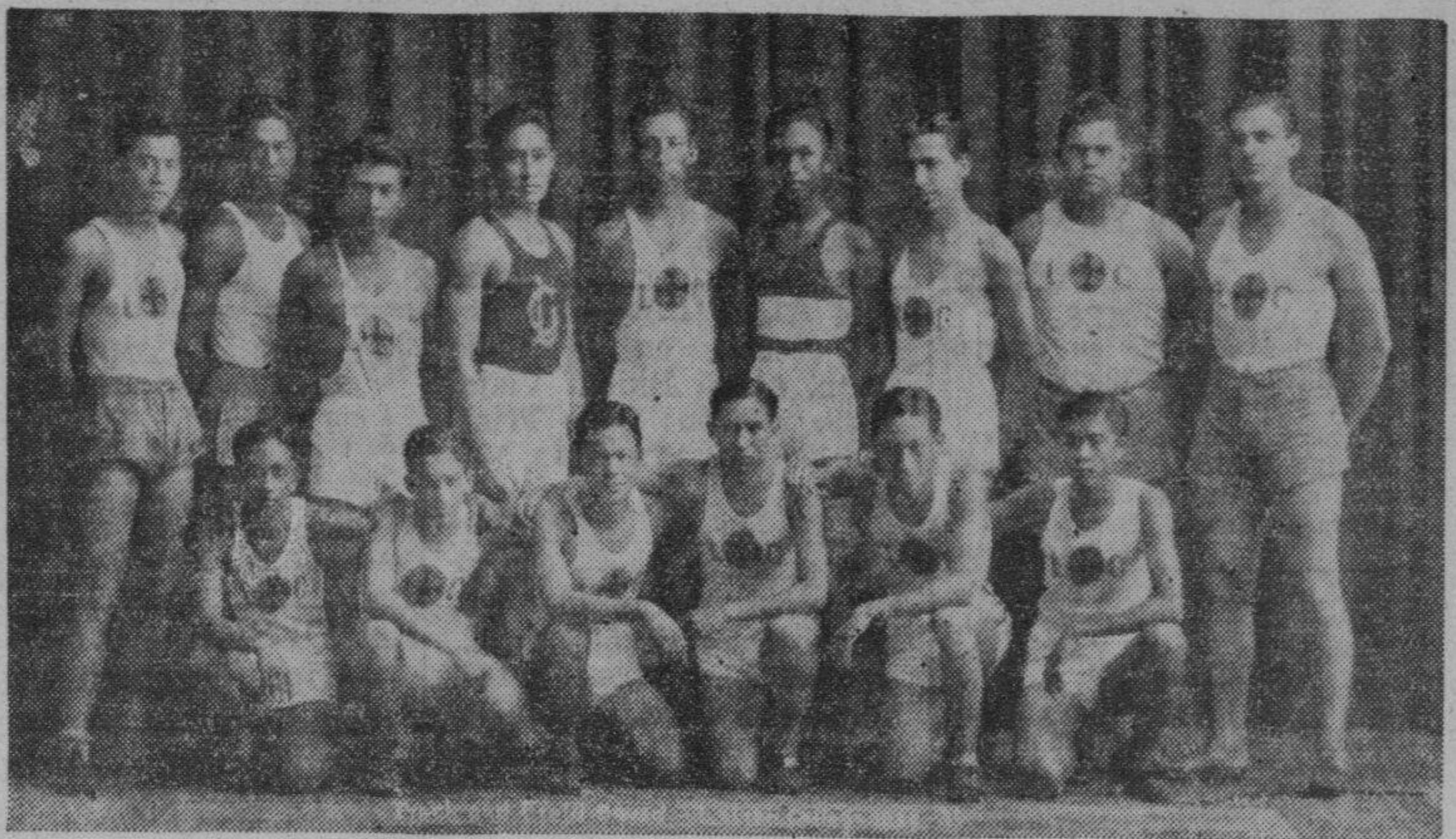
El equipo de pista y campo de San Juan de Letran que en una sensacional batalla contra el Ateneo ganó ayer el campeonato de pista y campo de la N. C. A. A. en el primer año en que toma parte en las competencias...