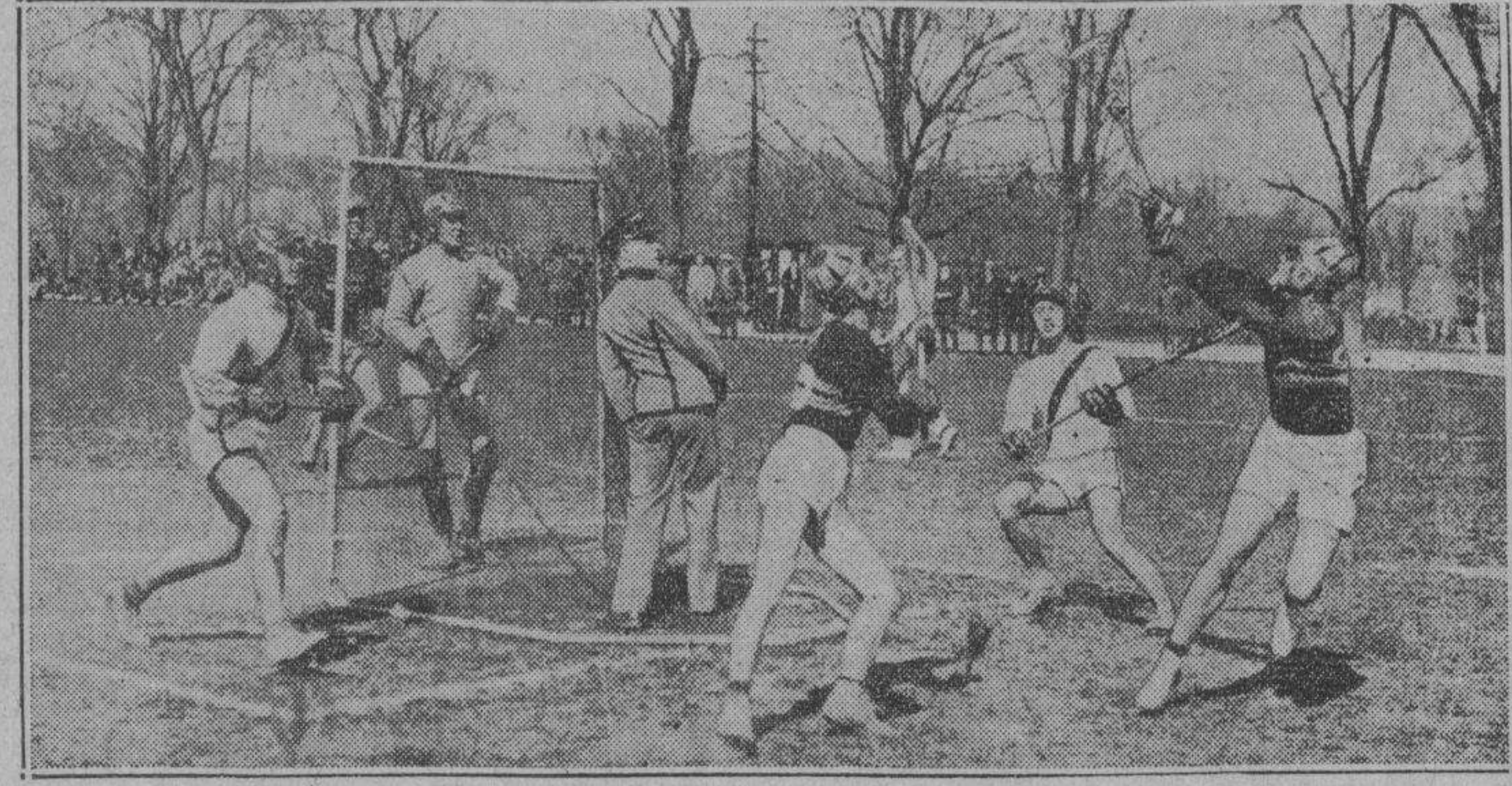
Un momento culminante durante el partido de Lacrosse entre la academia militar y Yale en West Point, N. Y. West Point ganó por 10-2.