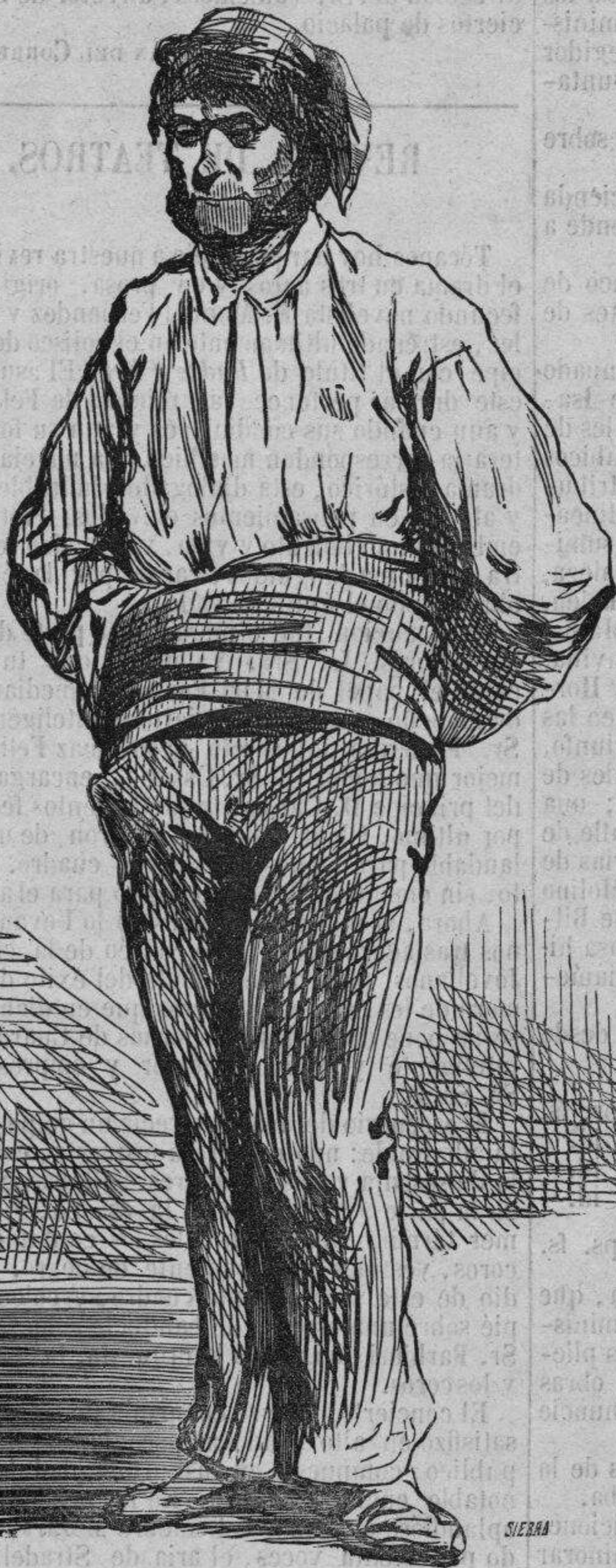
Sin rumbo hijo.

vuelo, mediane una interpretacion fiel por lo comun, sobre la tierra clásica de la literatura musical.