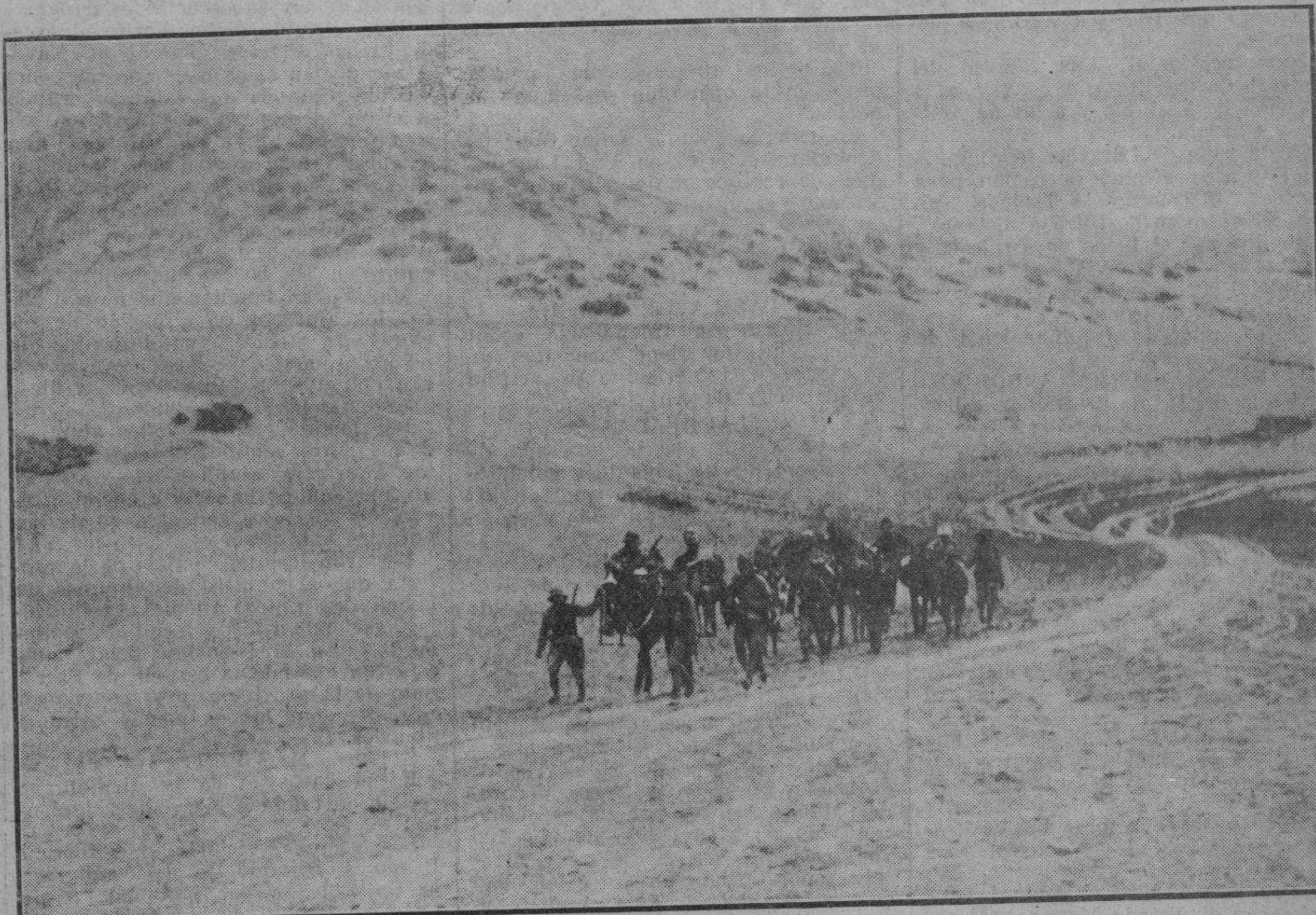
HERIDOS EN EL COMBATE DE GOZAL. CONDUCIDOS HACIA LA RETAGUARDIA

fastos de las grandes naciones en que esto no ocurra. Este mismo espíritu mueve a los grandes industriales, y, en cierto modo, también, aunque no siempre, a los grandes técnicos... Lo que sucede es que en la España de los últimos cincuenta años, los políticos, los industriales y los técnicos no lo eran sino aproximadamente.