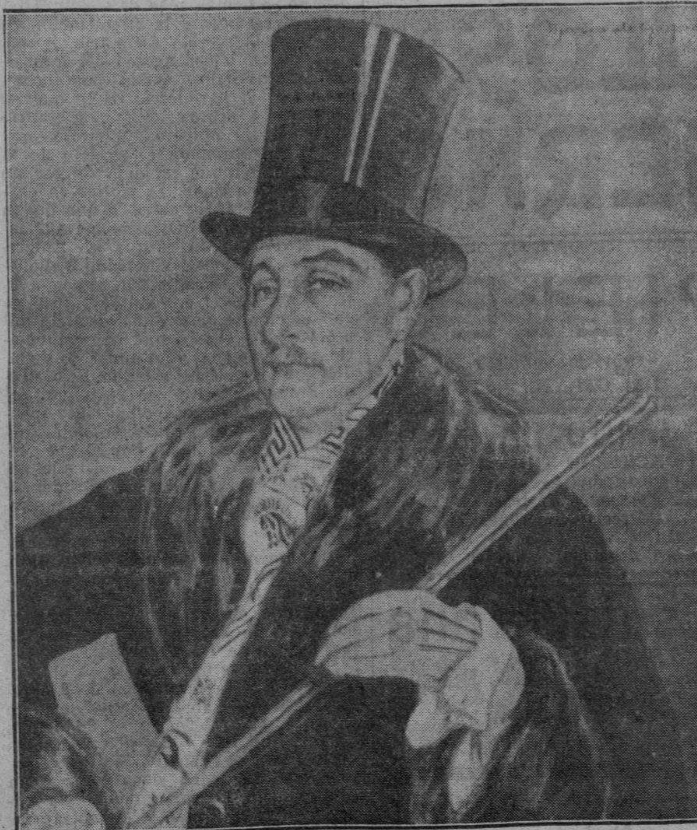
André Fouquieres, el árbitro de la elegancia francesa, que dará próximamente en Sevilla, en Madrid, y probablemente en Bilbao, conferencias sobre el tema «Lo que debe hacer y decir y no hacer ni decir el elegante auténtico».