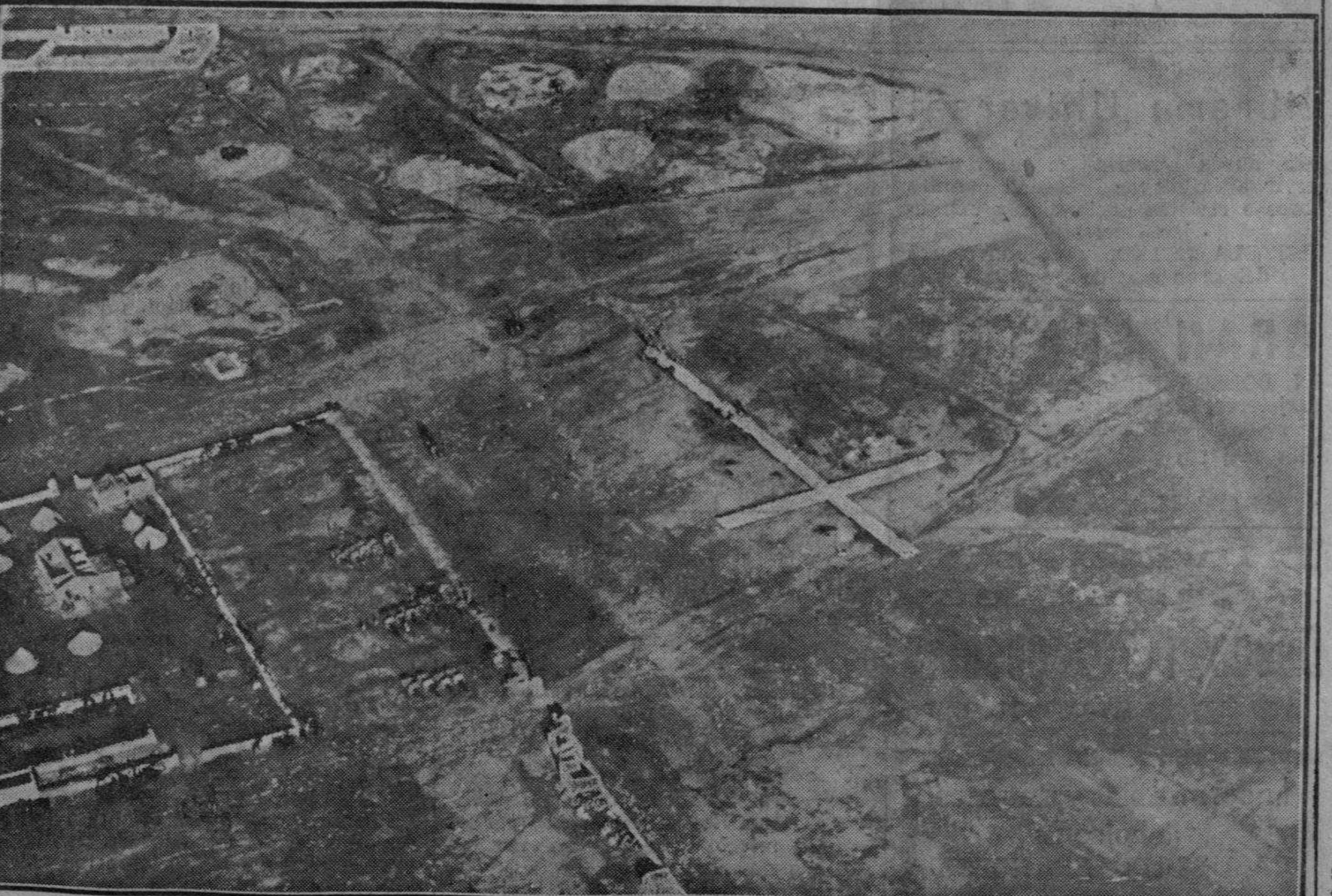
CRUZ DE FLORES EN EL FRENTE MARROQUI