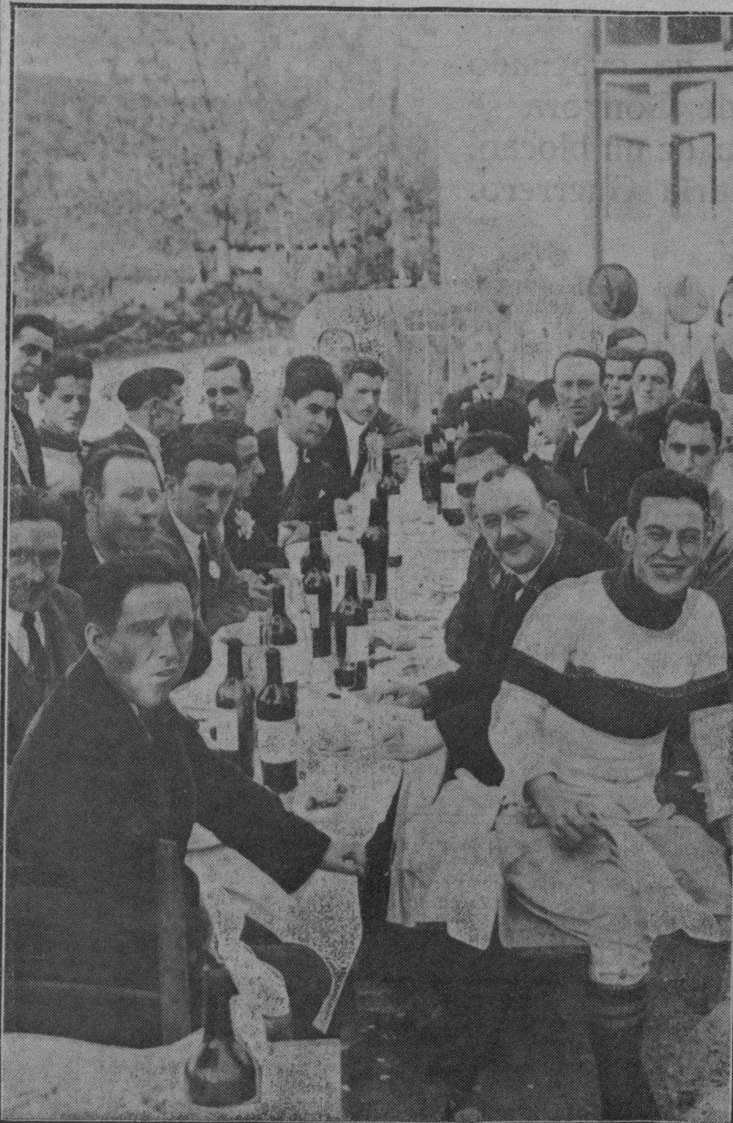
La brillante excursión de «routiers» organizada por el Athletic a Múgica, fué un gran éxito.—Los excursionistas en un «detalle» del acto.

cialmente, es mucha falta en el Sestao, tal como se halla hoy en día.