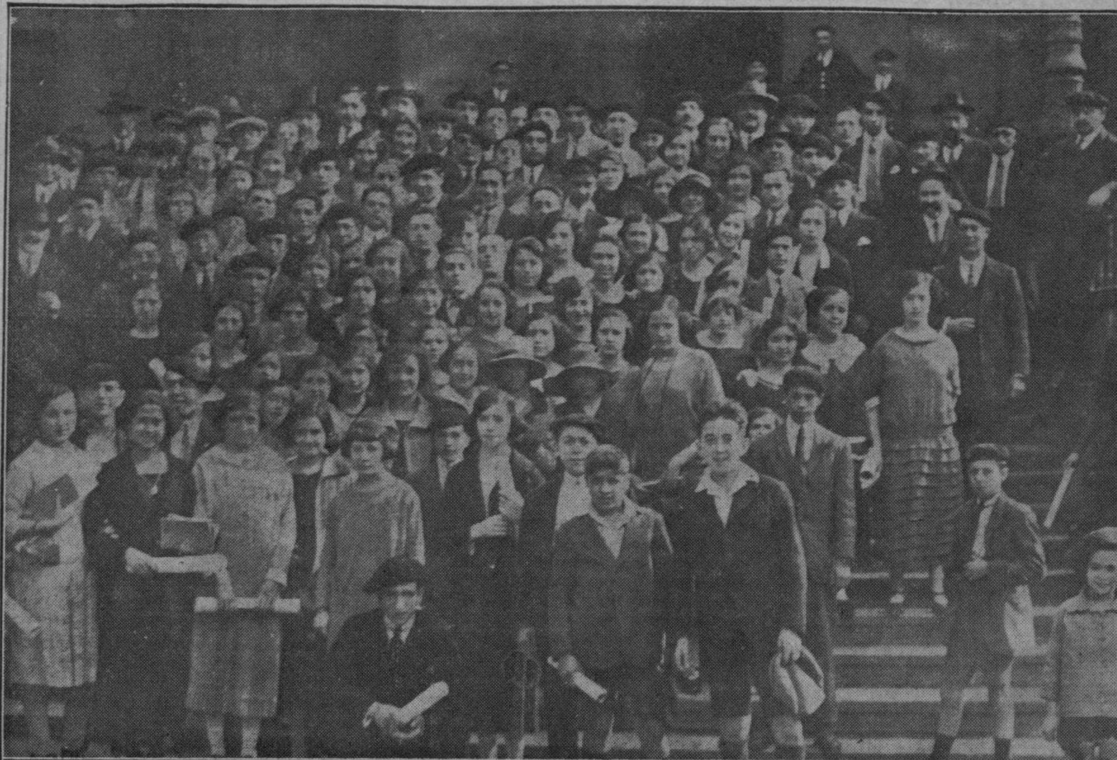
DISTRIBUCION DE PREMIOS A LOS ALUMNOS

XVI, unido, en un sólo descendiente de cualquier trono, gentes declaradas facciosas y traidoras, representadas por sólidos pilares del orden, hoy habitantes en casas de primer rango, tienen en el Gotha sus direcciones.