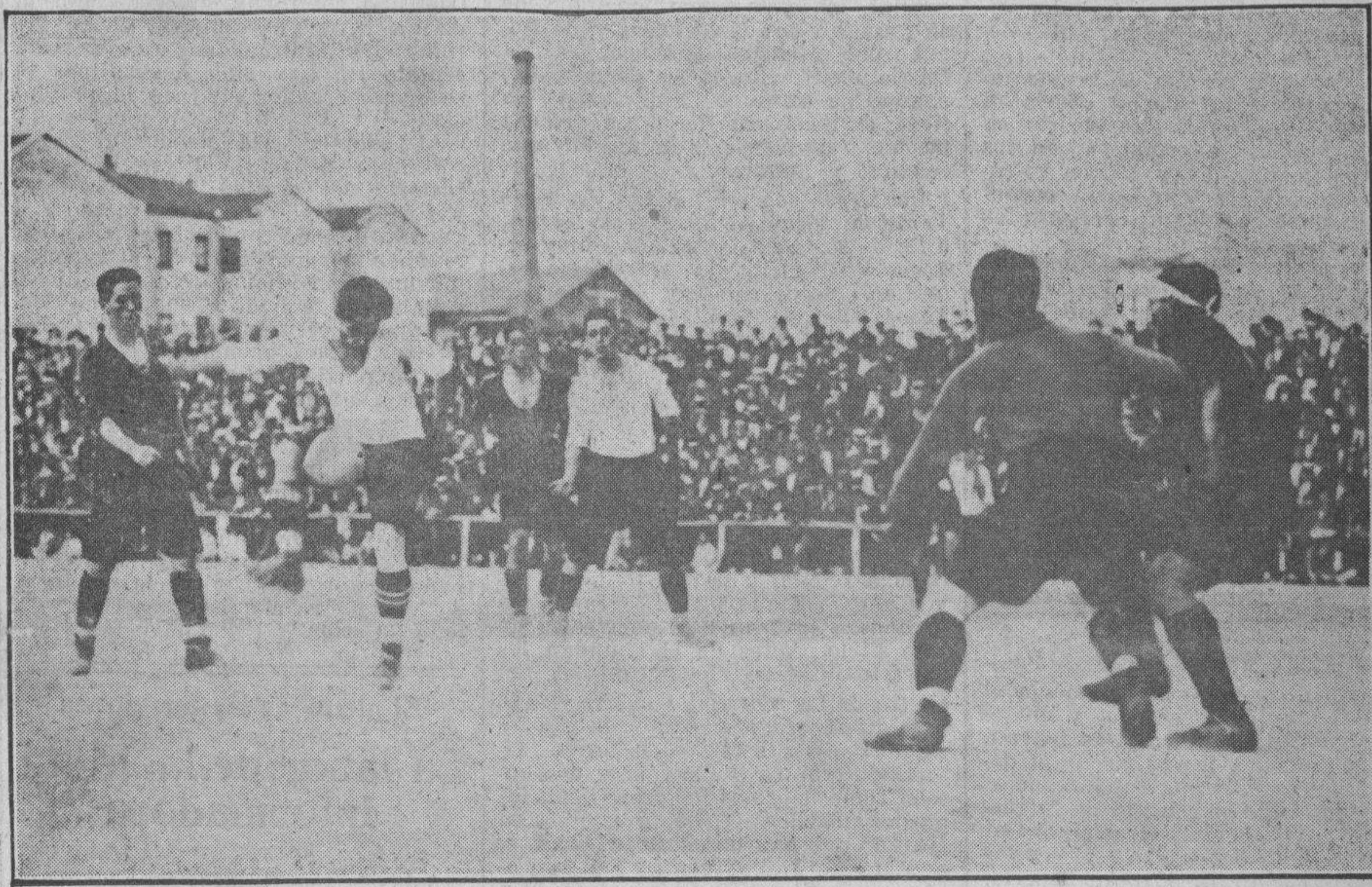
UNA FASE DEL PARTIDO EN EL QUE LOS DE GUECHO GANARON A LOS MADRILENOS

ministración cuidará de que el paquete de LA NOCHE no llegue a Eibar.