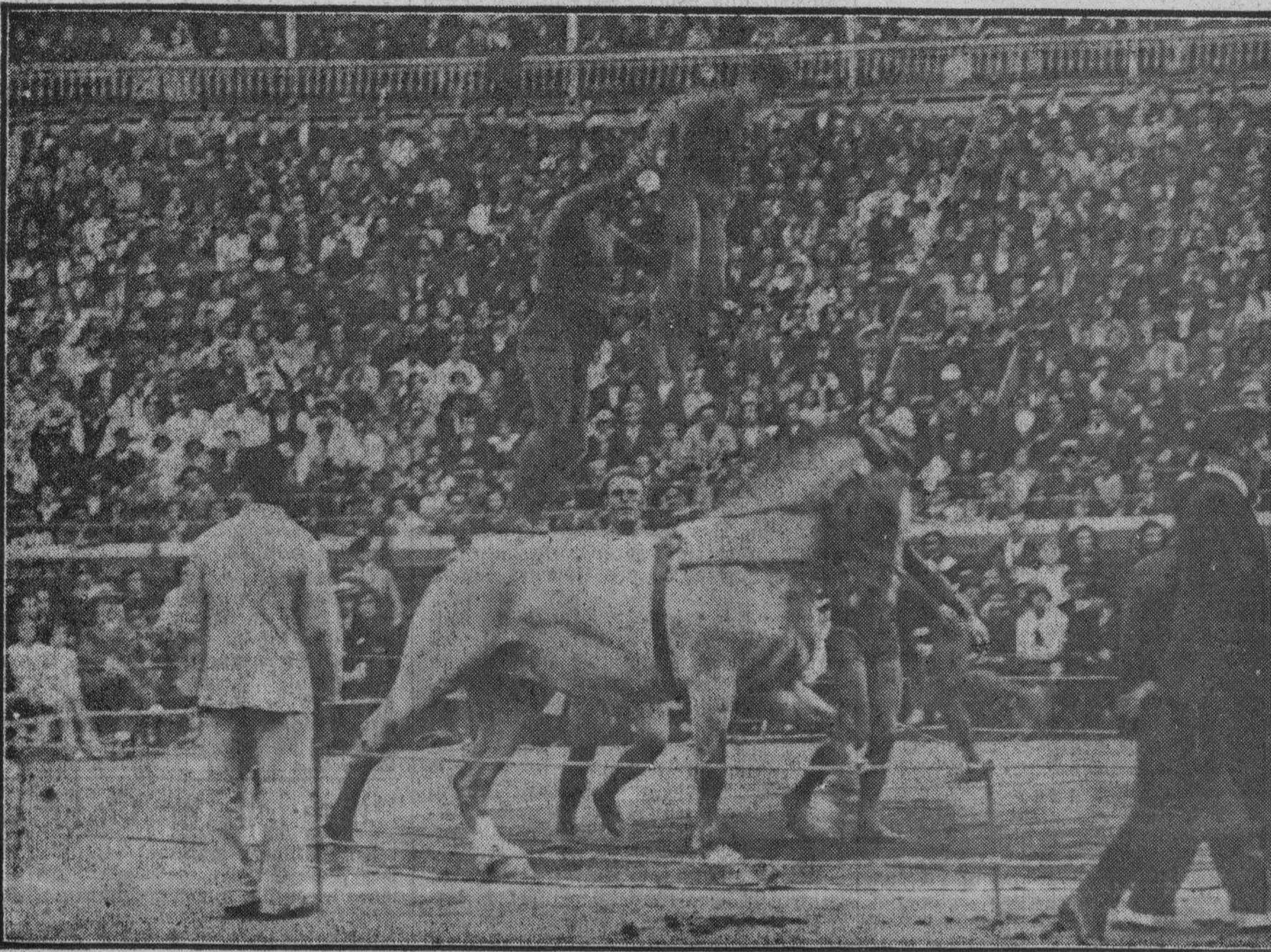
OTRO INTERESANTE EJERCICIO DE ACROBACIA ECUESTRE