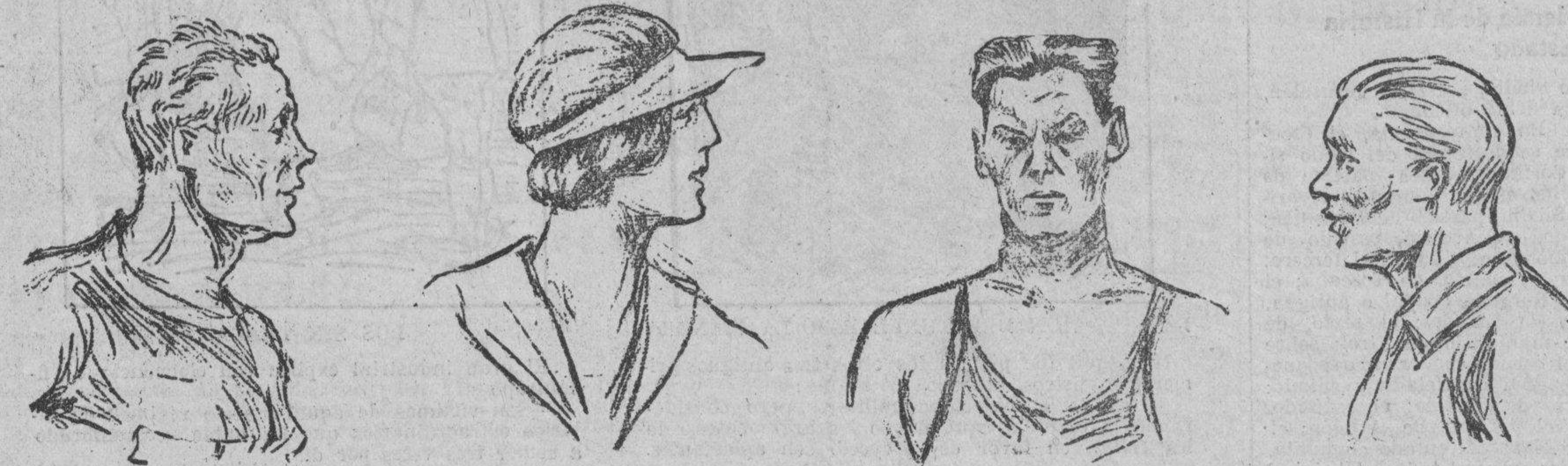
El finlandés Nurmi, carrera a pie (fondo y medio fondo). Miss Helen Wills (Estados Unidos), tennis. El americano Weissmuller, campeón de natación. El americano Vincent Richards, tennis.