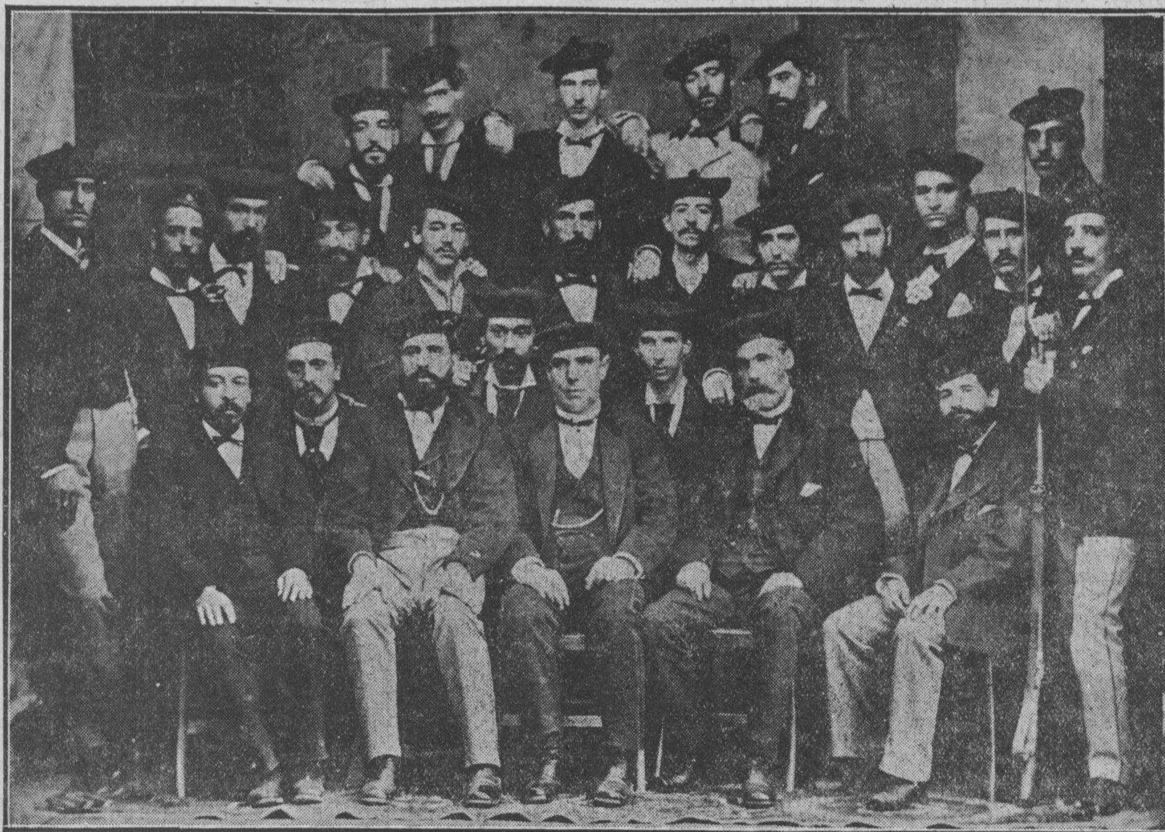
Los de entonces

en torno! La comunicación con el ambiente se va volviendo simple respiración, mecánica osmosis y endosmosis. La memoria se va reduciendo a mnéme biológica. ¡Cuán primitivo, cuán elementales, al llegar tan adentro! Ni vestigios de historia a esta profundidad. En lo hondo de lo hondo de lo hondo de nuestra alma, todos somos prehistóricos.