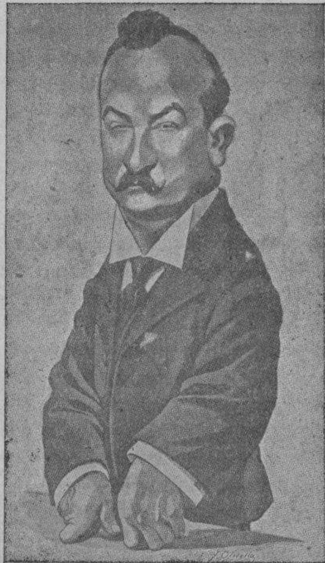
Caricatura de «P. B. T.», importante periódico de Buenos Aires.