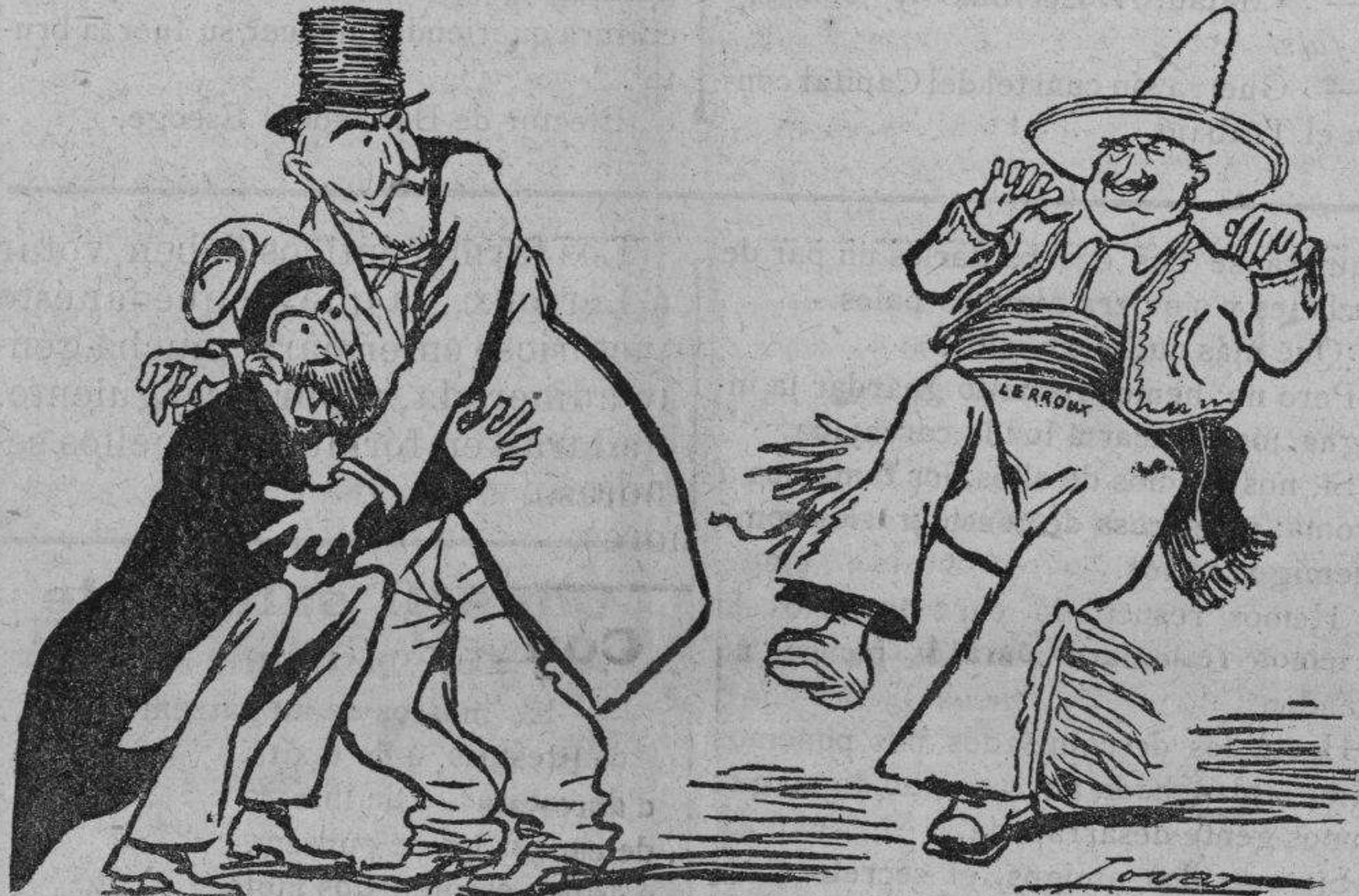
(Del Heraldo de Madrid)

EL DESCAMISADO, que como saben ustedes está en fondos, apuesta 10,000 pesetas á que sale diputado D. Alejandro Lerroux por la circunscripción de Barcelona.