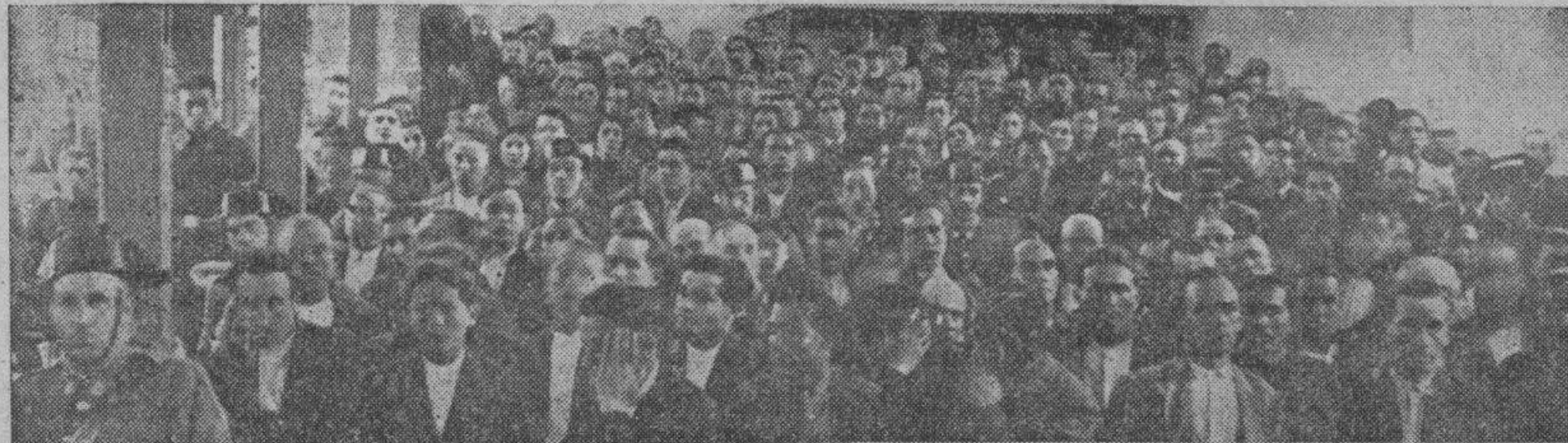
Dos aspectos de la sala en la que son juzgados ciento diez vecinos de Uncastillo, a los cuales se acusa de haber intervenido en los sucesos allí ocurridos en octubre.

guarnición en Uncastillo el día de los sucesos, que se limita a exponer su actuación durante el día de autos: despejar las proximidades del cuartel y repeler la agresión.