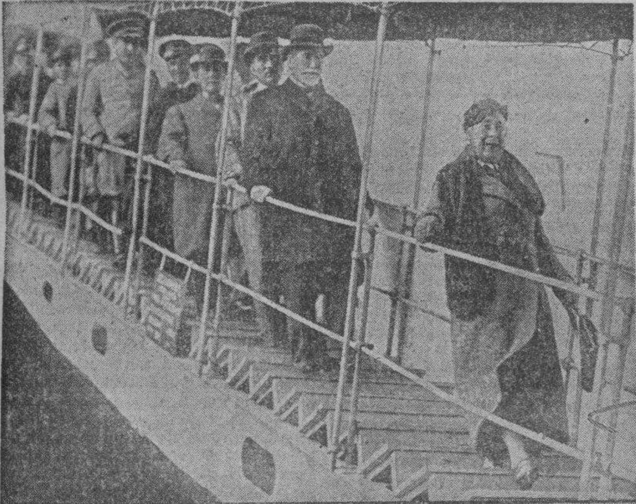
El señor Venizelos fué retratado en el instante en que, procedente de Creta, donde fué vencido por el Gobierno griego, desembarcaba en Nápoles. En el descenso a tierra le precede su mujer. Le había precedido también en la obra revolucionaria. Nunca una revolución puede tener como inspiradora una mujer. El fracaso es inevitable.

mer Imperio universal de la Historia para el mundo del Mediterráneo, por ser universal era marítima (el mar cubre las tres cuartas partes de la superficie del globo), y siendo marítima su resultado dependía del dominio del mar. Siempre así fué, des-