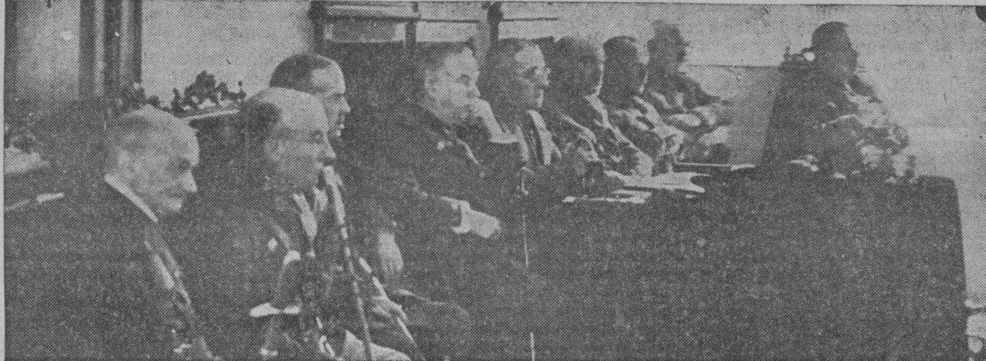
El tribunal que juzga a los supuestos autores de los actos revolucionarios en Uncastillo

La lectura del apuntamiento duró cerca de cinco horas.-Prueba verbal.-El fiscal militar solicita seis penas de muerte.-Ayer informaron siete defensores.-Hoy continuará el Consejo.-Existe mucha expectación ante el fallo