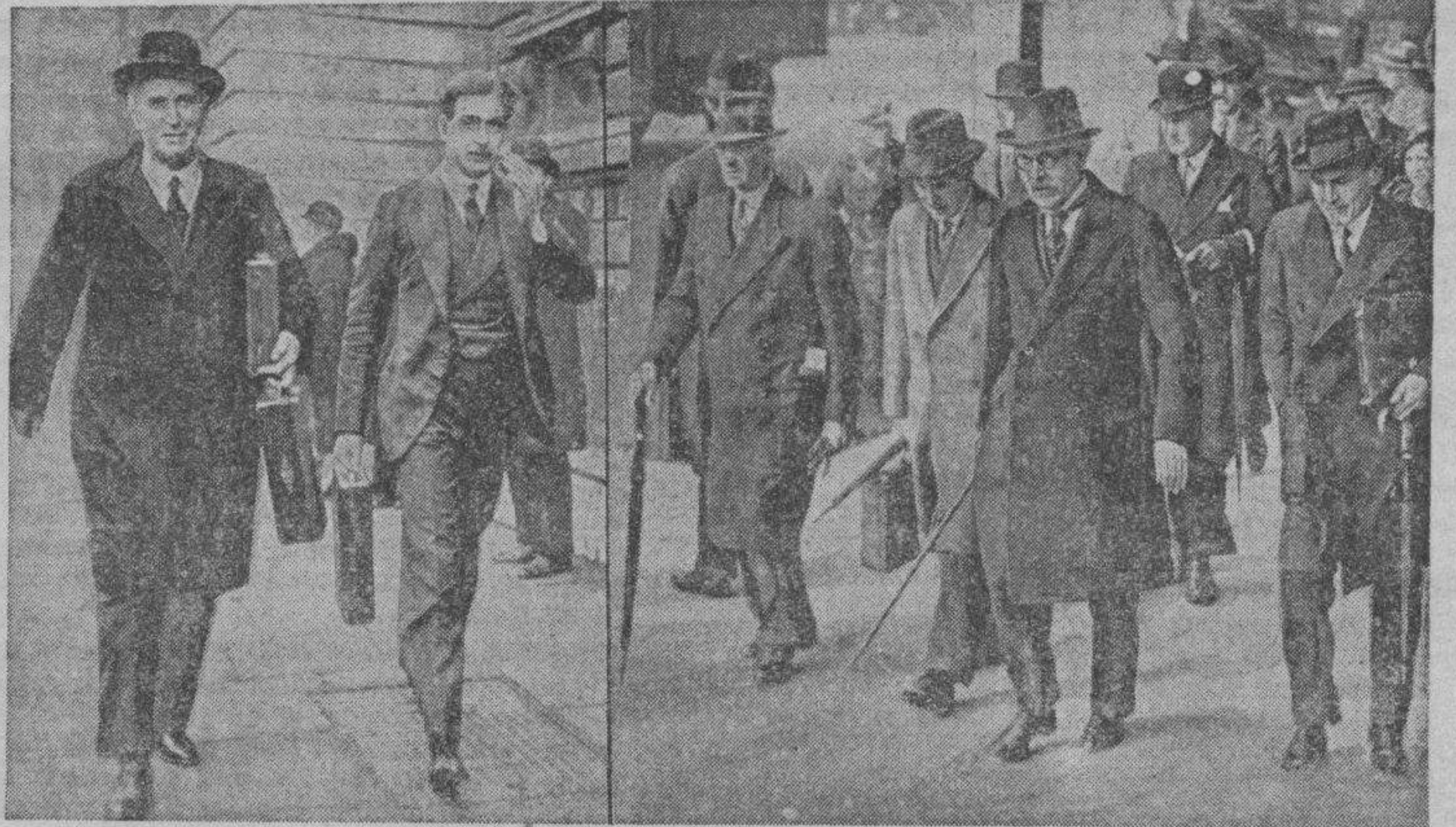
A la izquierda se ve a John Simon y a lord Eden cuando salían de concurrir al Consejo de ministros motivado por la histórica declaración de Hitler. De tal Consejo surgió que los dos grandes políticos marchasen a Alemania. Estos días conferencian con el "Führer". Esperemos que de sus entrevistas salga fortalecida la paz. — A la izquierda MacDonald dirigiéndose al Parlamento para tratar de la intrincada cuestión internacional del desarme (1)