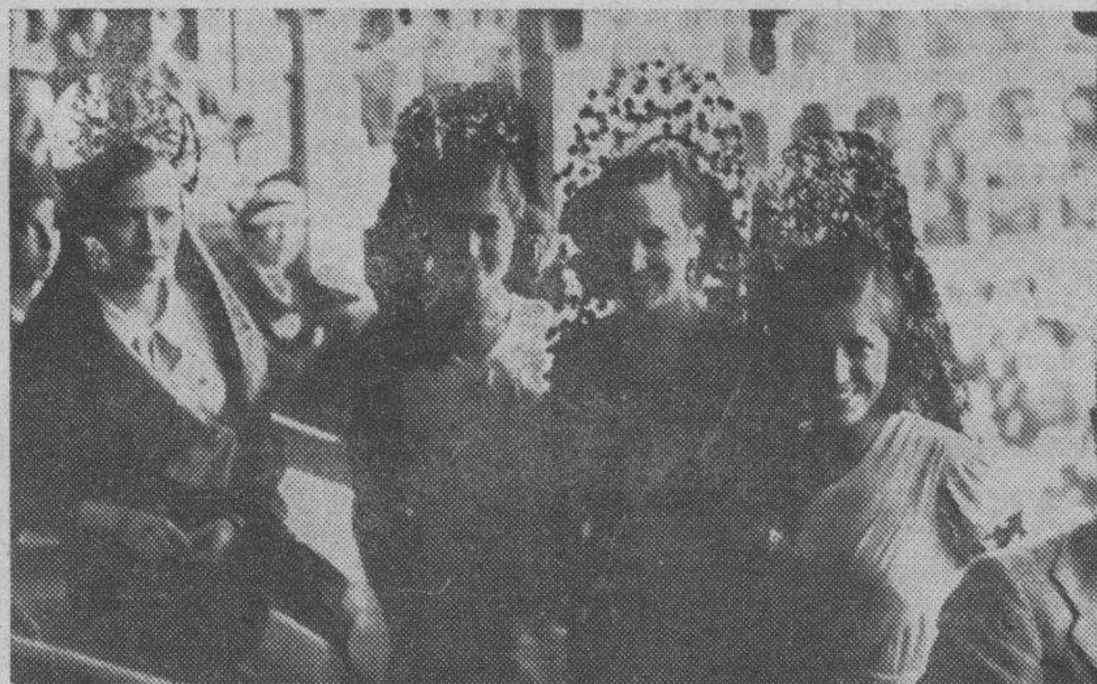
Cuatro bellísimas bilbilitanas luciendo, el "día grande", su gentileza, su elegancia y su insuperable distinción.

La mujer. — Sí. Pero he observado que tiene una caída de ojos... que nos vamos a quedar sin vajilla.