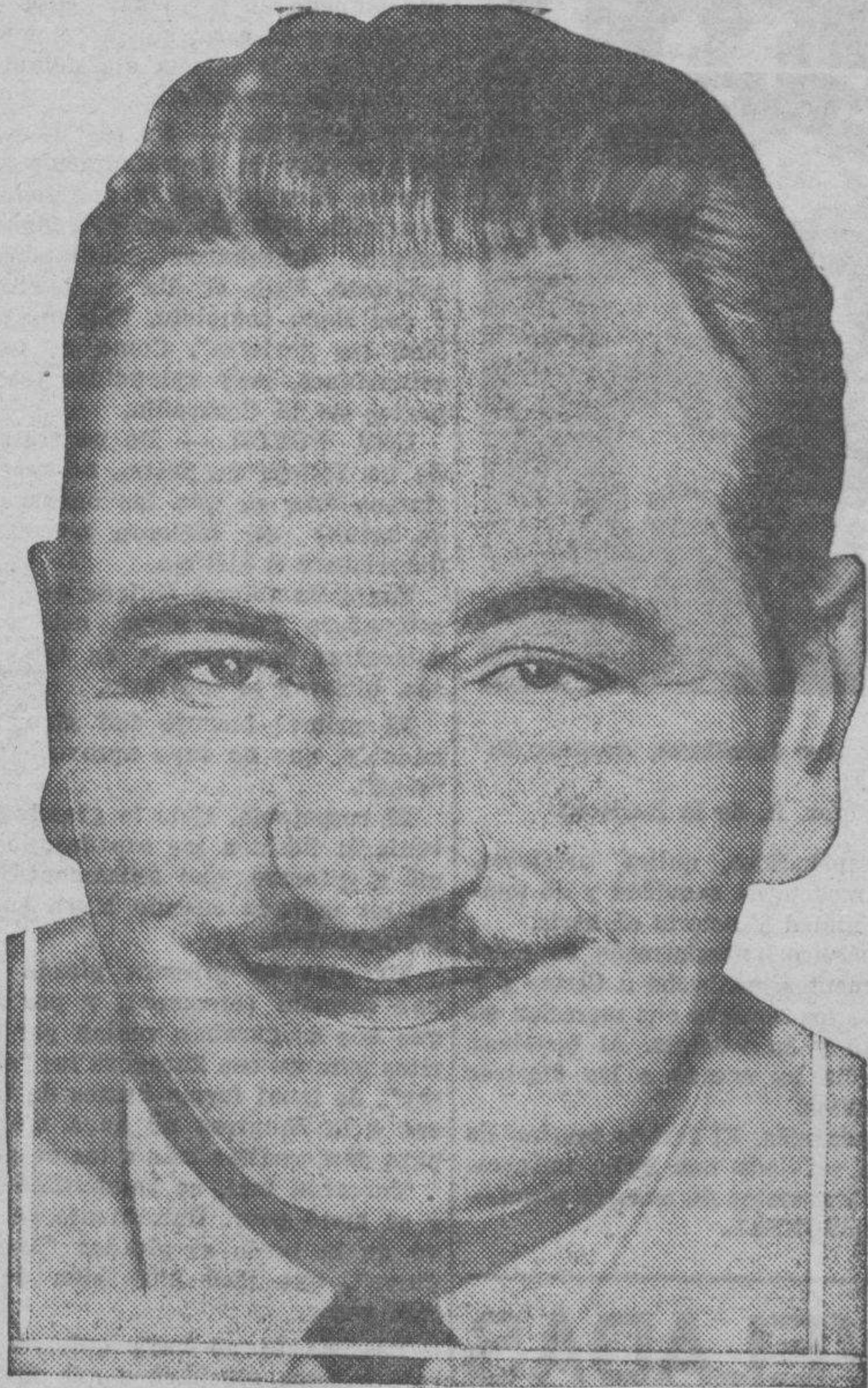
Uno de los que más han sentido la muerte de Marie Dressler ha sido Wallace Beery, el popular y formidable actor que tan excelente pareja formaba con la gran característica.