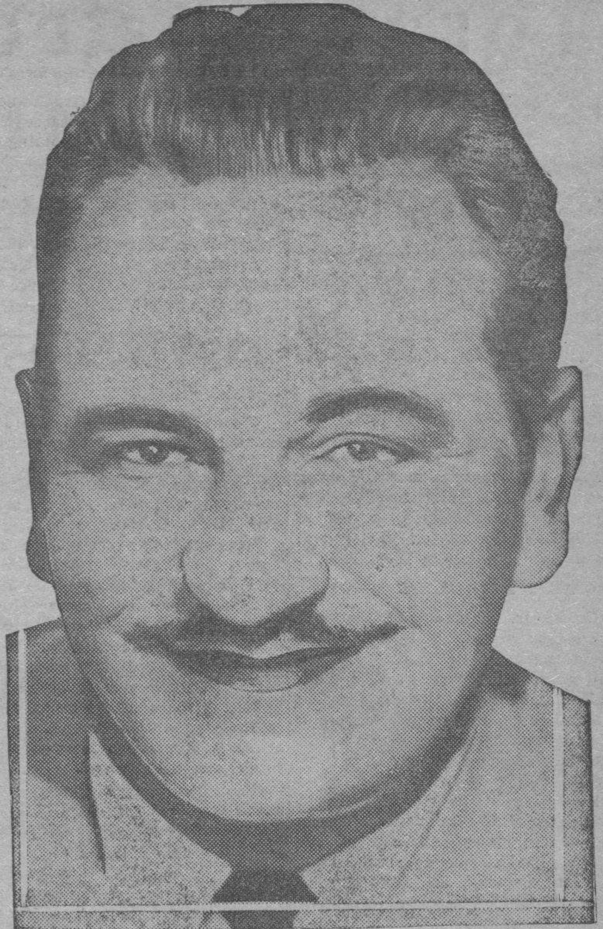
Wallace Beery, el admirable intérprete de grandes películas.