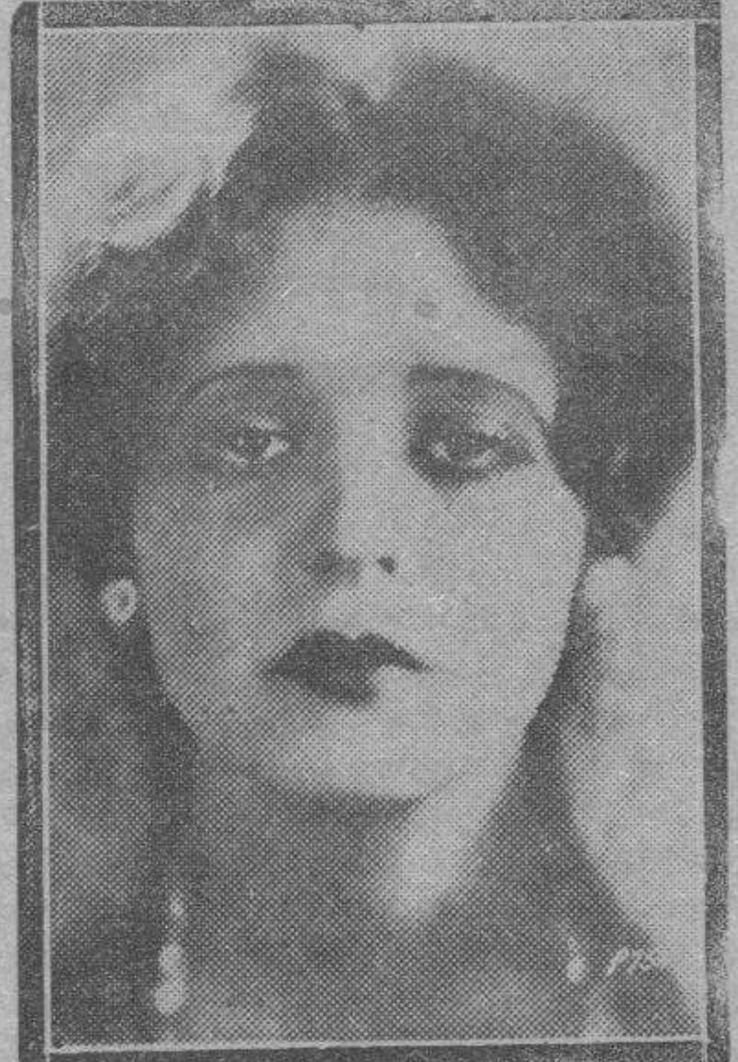
Clarita Bow, la dinámica "estrella" del cinema norteamericano, que en recientes interpretaciones ha demostrado su ductilidad artística, poco común en muchachas de su capacidad.

Estos papeles de héroes tristes, semifracasados, que incorpora Wallace con arreglo a una absurda imposición constante de los magnates del cinema, no han logrado amannerarle. Todo su arte, sobre el guión de su personalidad invencible, perfectamente acusada, se mantiene fresco, en plena tensión, en plena gracia de posibilidades y de recursos honrados. El arte de Wallace está por en-