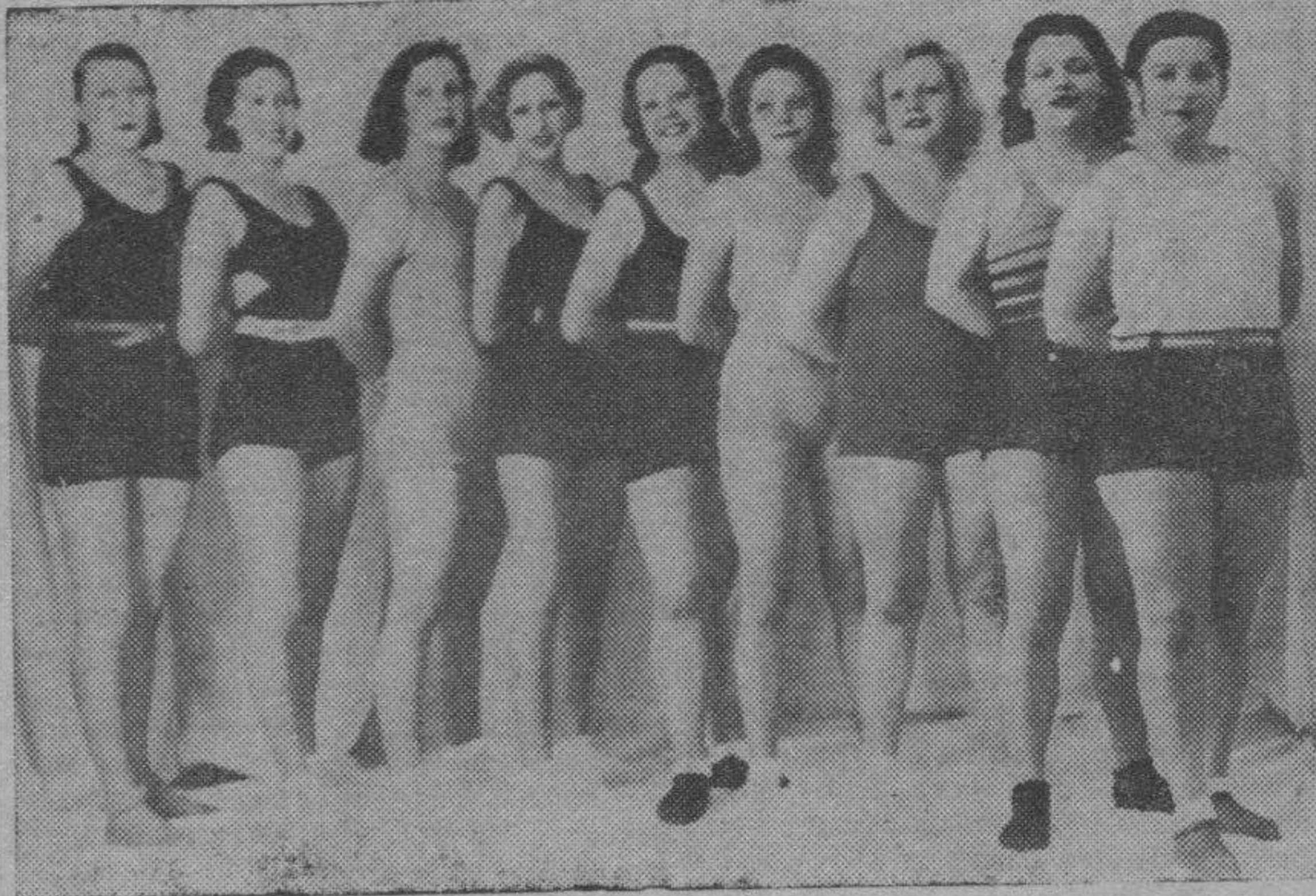
Un grupo de formidables luchadoras que tomarán parte en el torneo femenino de greco-romana que mañana se presentará en Zaragoza.