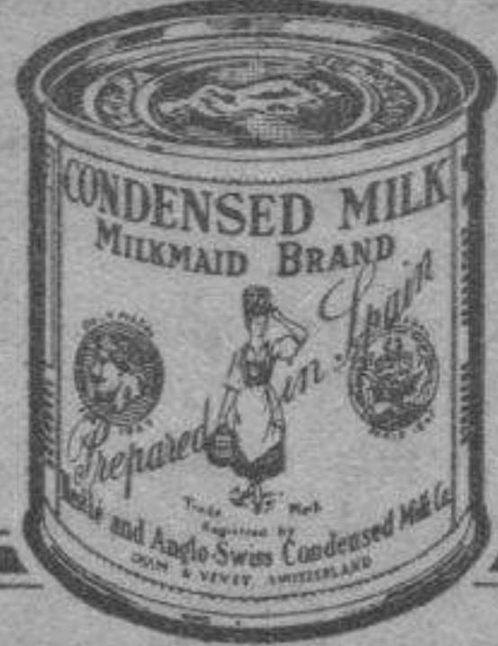
Pida hoy mismo a Sociedad Nestlé, (Sección LE 59) Vía Layetana, 41, Barcelona, un ejemplar gratuito del magnífico folleto ilustrado "Recetas La Lechera".

Se encuentran también ahora en el comercio "botes degustación" "LA LECHERA" muy apropiados para una espléndida dosis, y que pueden fácilmente abrirse con un cortaplumas.