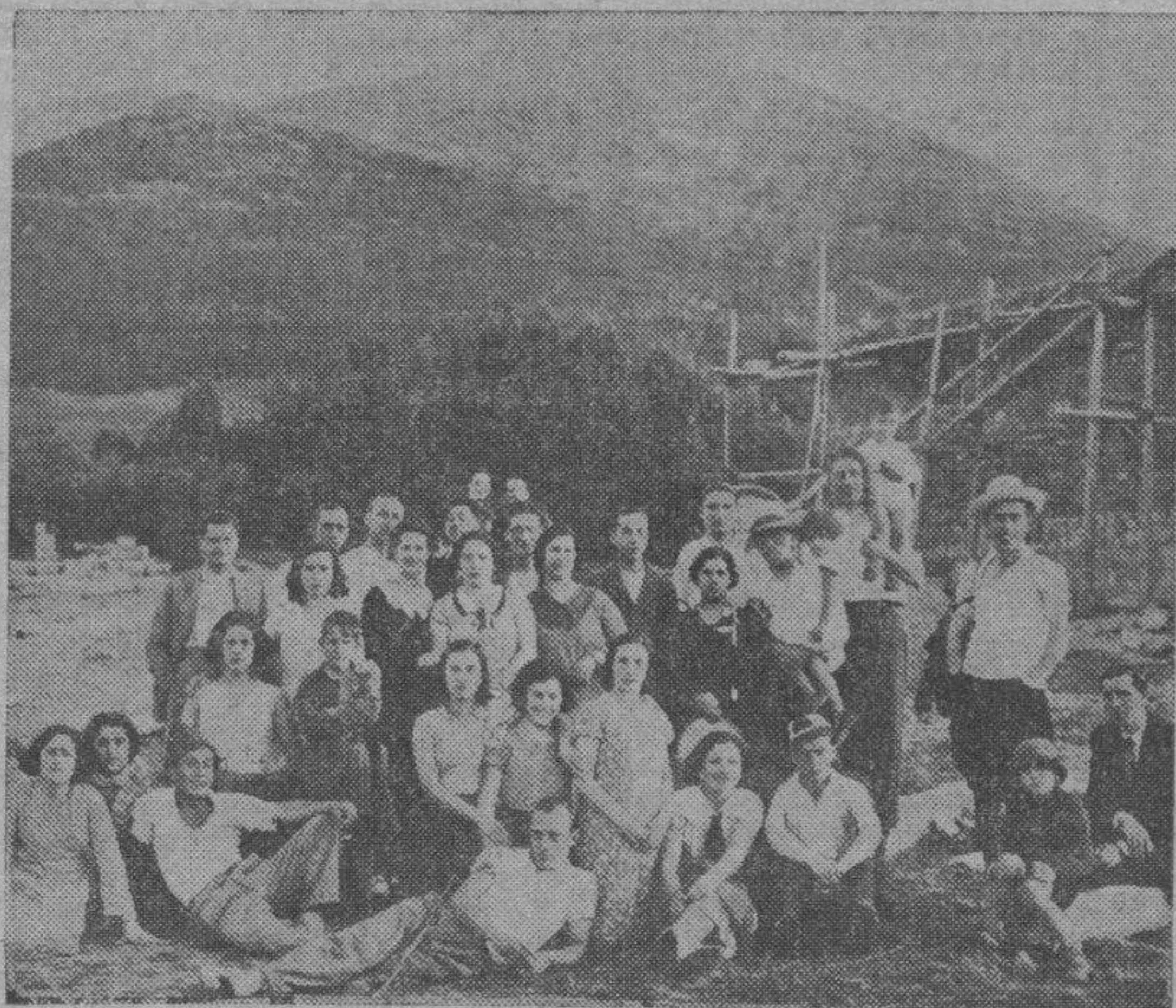
EN EL MONCAYO.—Distinguidos jóvenes y preciosas señoritas que en el encantador sitio de Agramonte posan ante el fotógrafo de LA VOZ DE ARAGON.