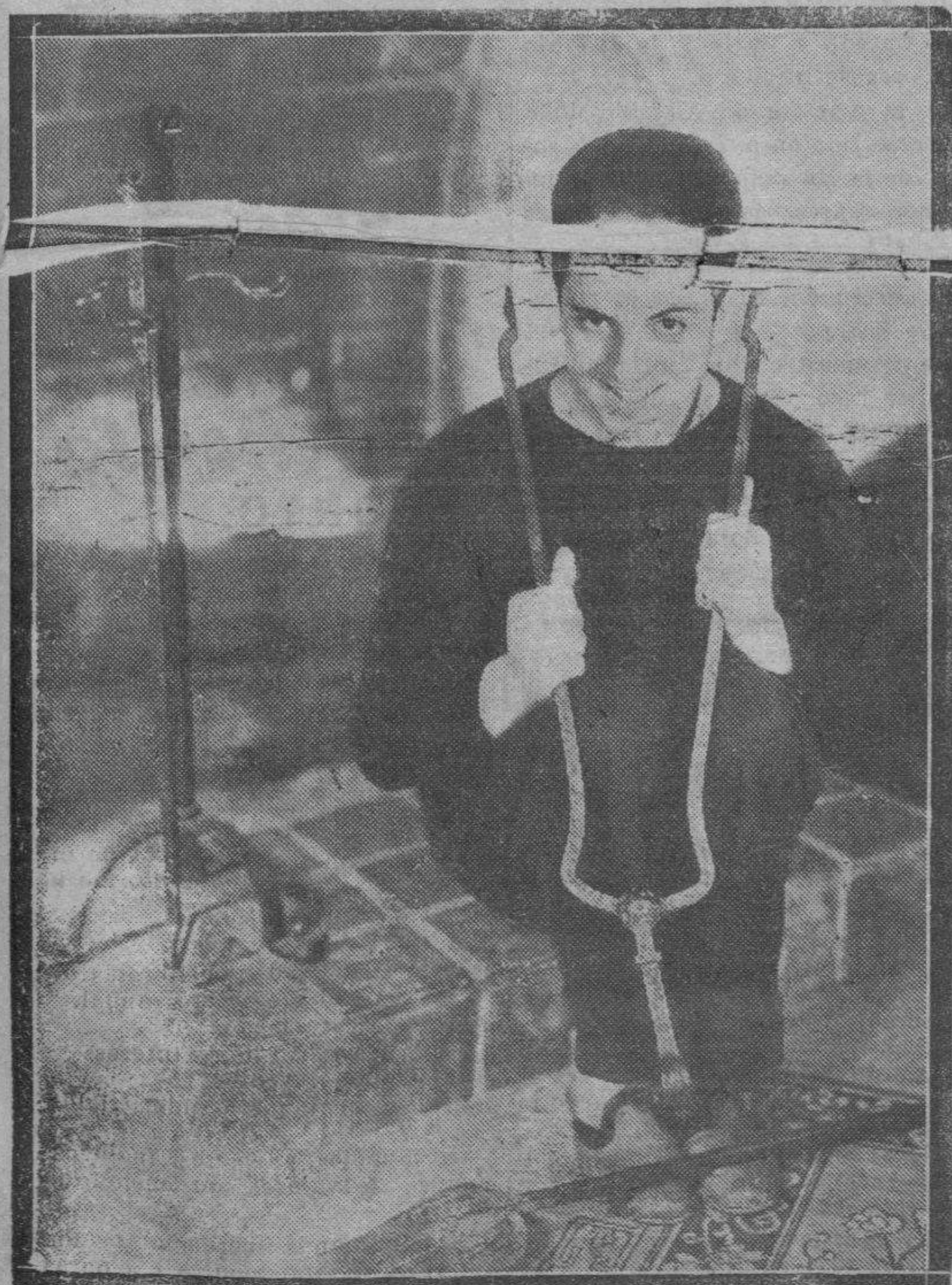
Poco le ha durado a Roberto Rey la gloria de sus éxitos cinematográficos. Vedlo aquí en una de sus mejores interpretaciones