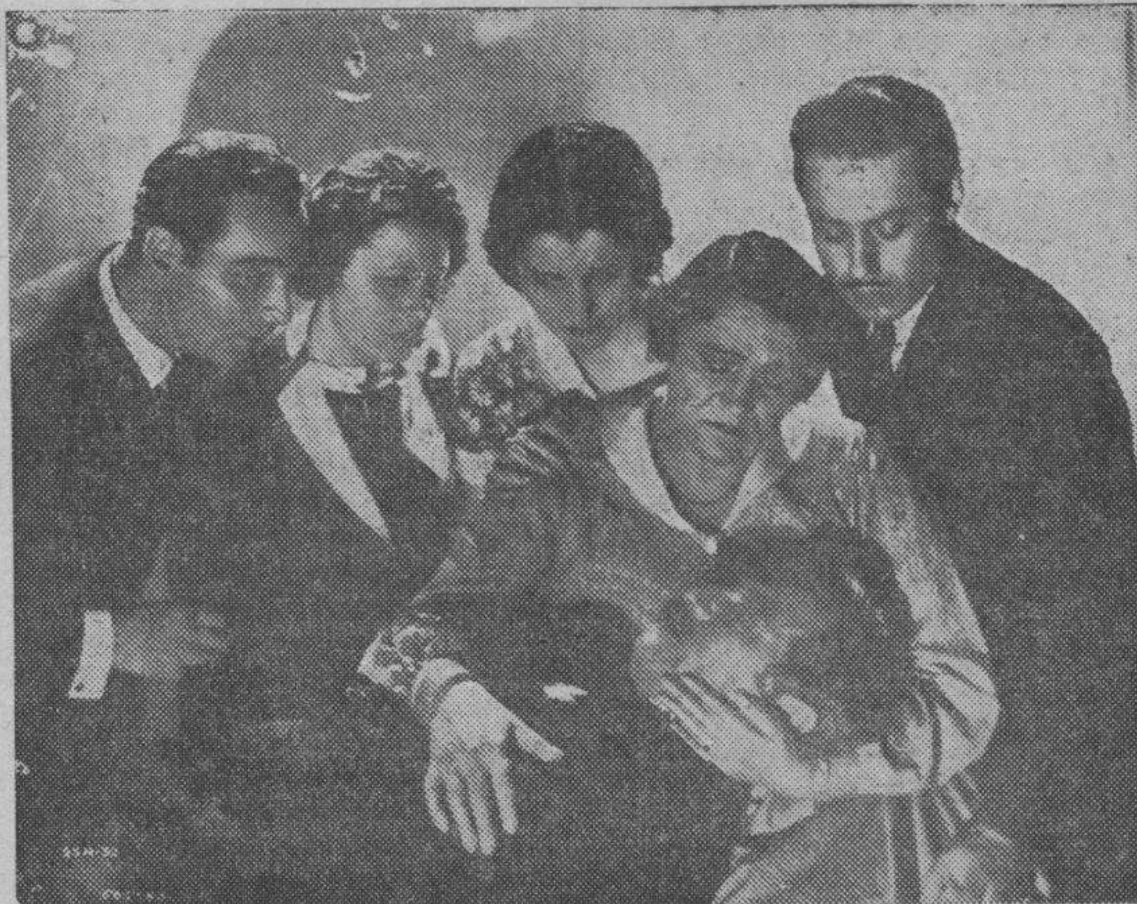
Una interesante escena de "La senda de la vida", película próxima a estrenarse en un cine local.