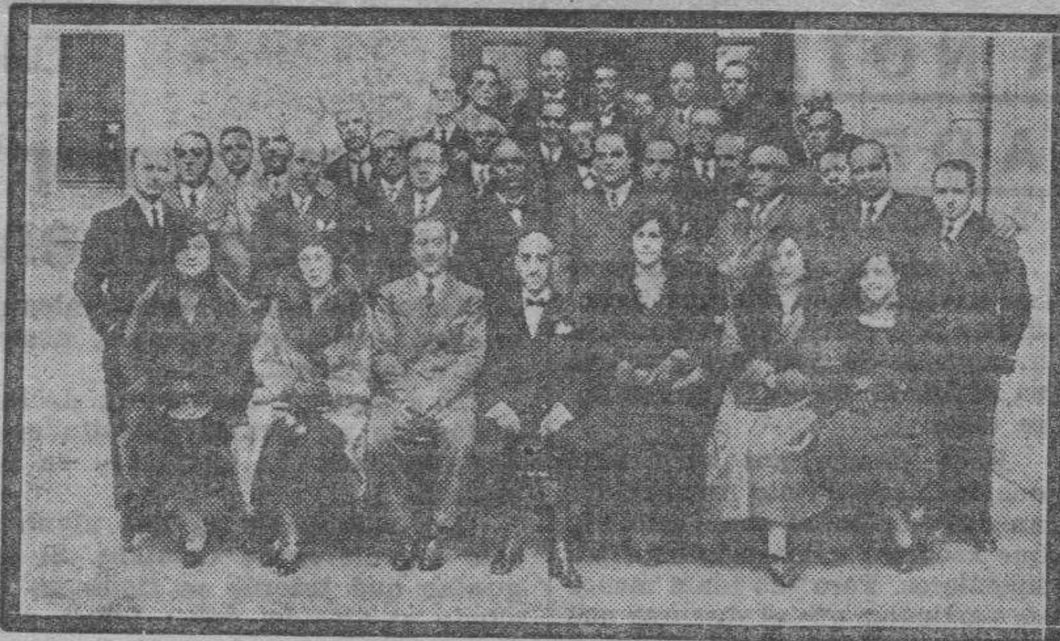
Concurrentes a la asamblea nacional de Sindicatos de Iniciativa y Turismo, que con tanta brillantez se desarrolla en Zaragoza, perfectamente organizada por el S. I. P. A.