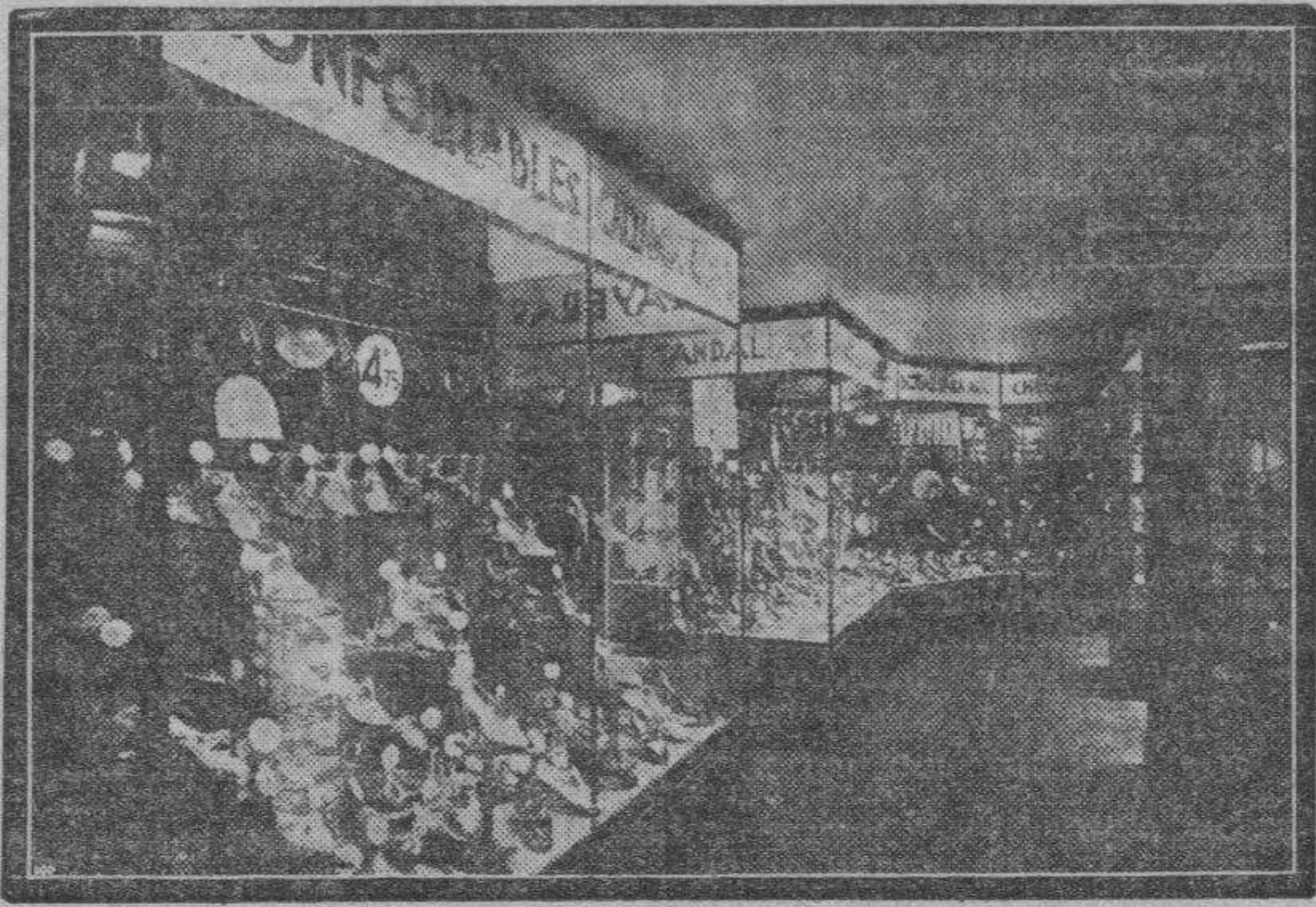
En el amplio "hall" de EL SIGLO XX destacan los escaparates, que ofrecen a los numerosos clientes de la Casa los modelos de máxima calidad y originalidad.