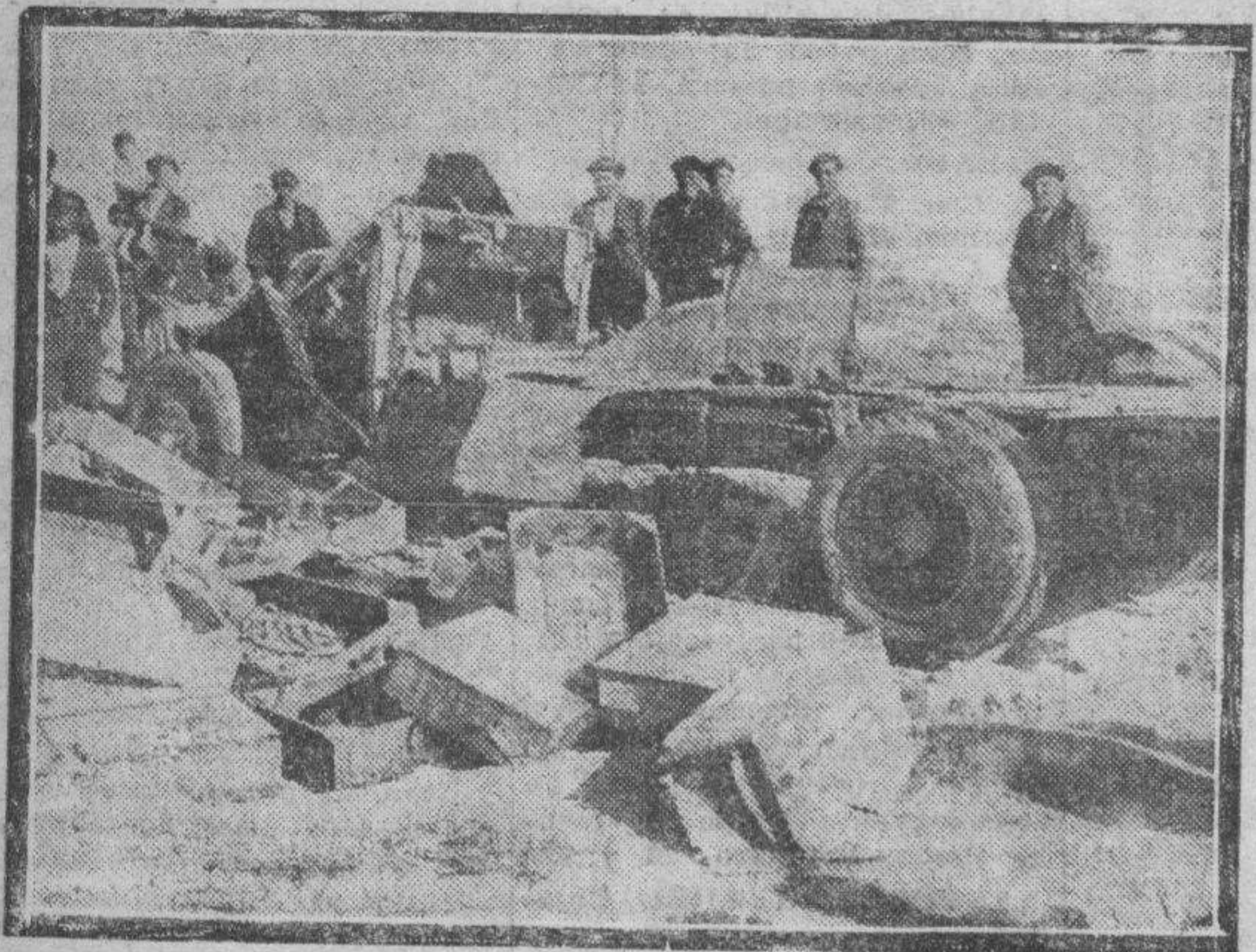
Estado en que quedó la camioneta.

Las opiniones expuestas en los artículos firmados responden siempre al criterio de sus autores y no suponen la identificación del periódico con las ideas expresadas, aun cuando, en ocasiones, sean coincidentes.