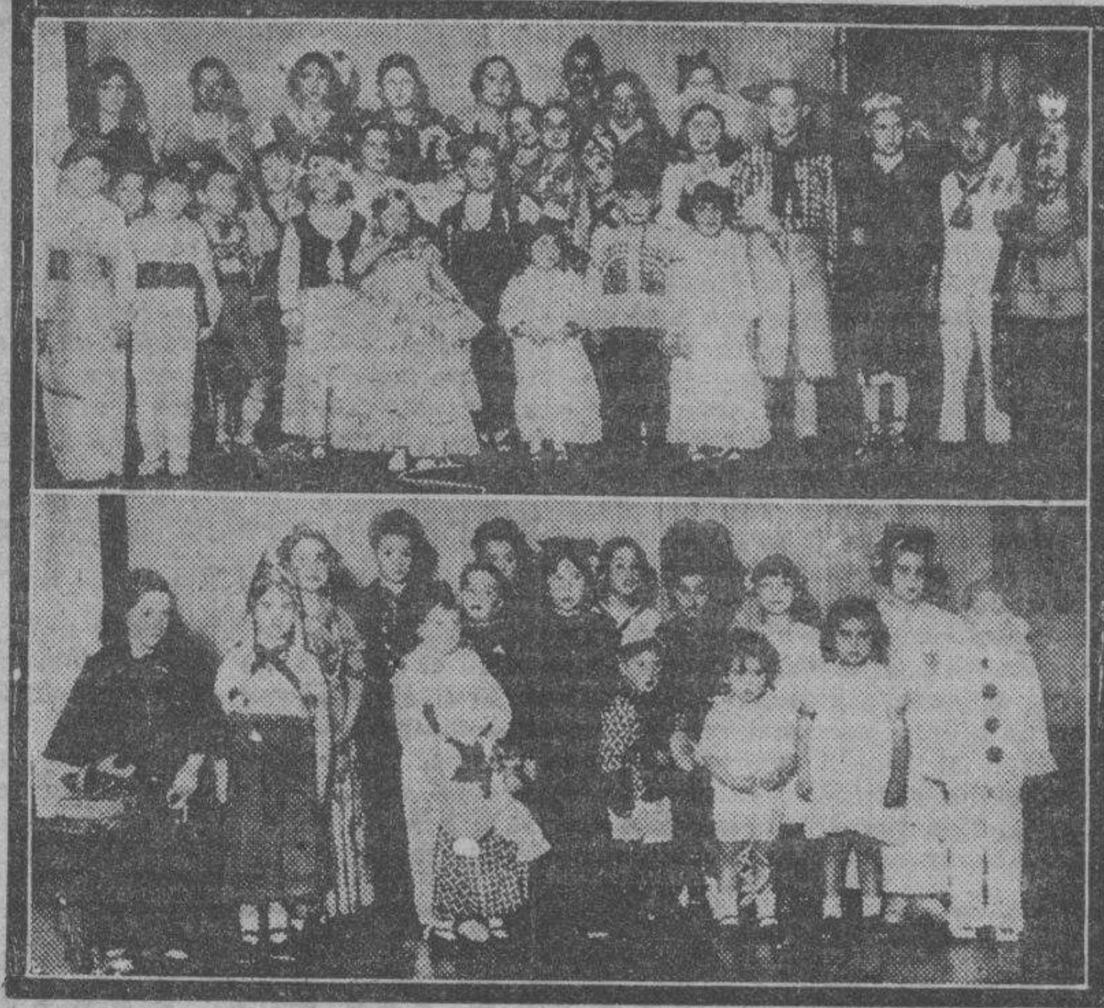
Niños concurrentes a la chocolatada infantil que con brillantez se dió ayer en el Gran Hotel.

Monumental Cinema. — Conde Aranda, 32. "La gran atracción" (estreno), por Richard Tauber. Continua desde las cinco.