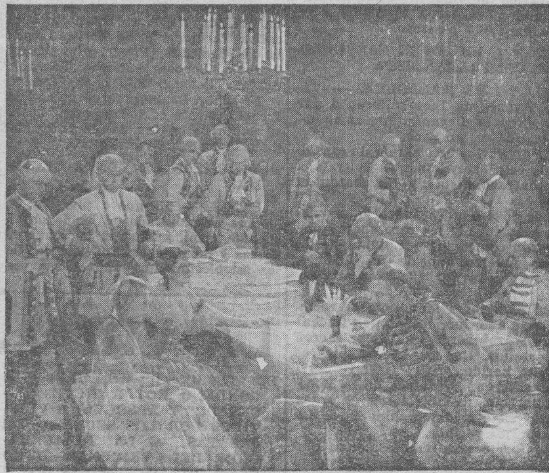
Una bella escena de un film que va a estrenarse en breve.