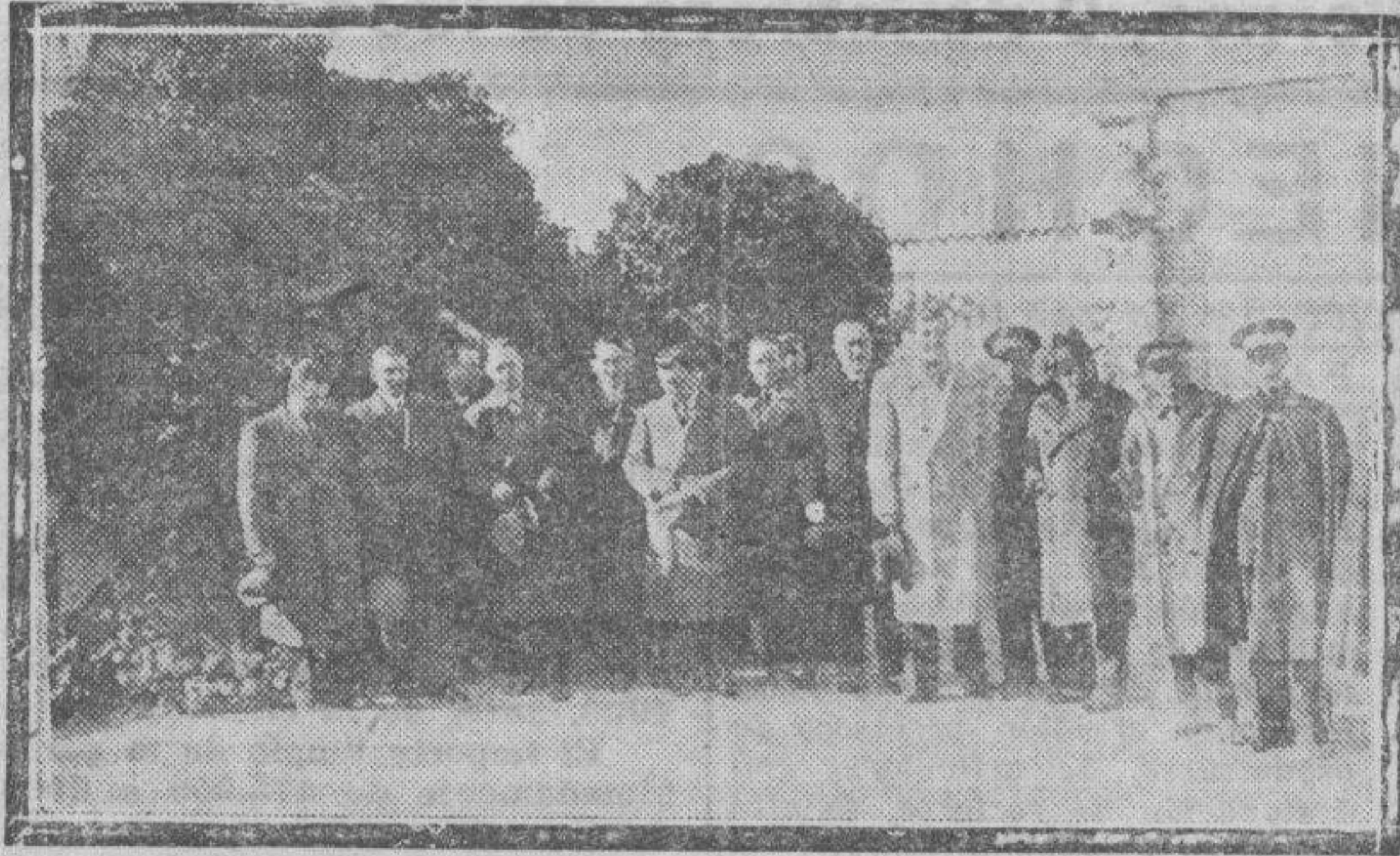
Las autoridades ante el mausoleo de Costa en el cementerio de Torrero.