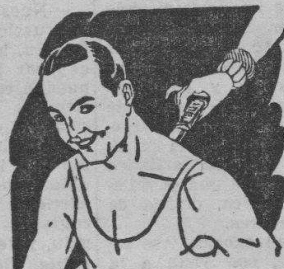
Rigidez del cuello Torticollis