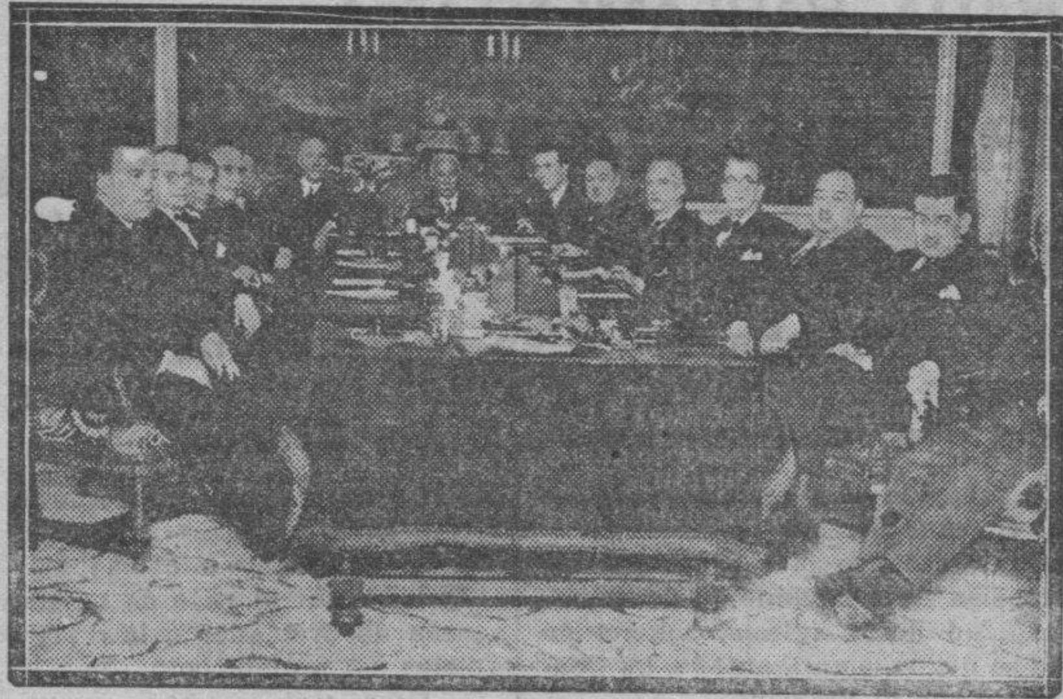
El primer Consejo del Gabinete Lerroux, presidido por el jefe del Estado.

El señor ALBA suspende el debate político, poniendo a votación las actas de Granada, que se aprueban por 243 contra 63 votos.