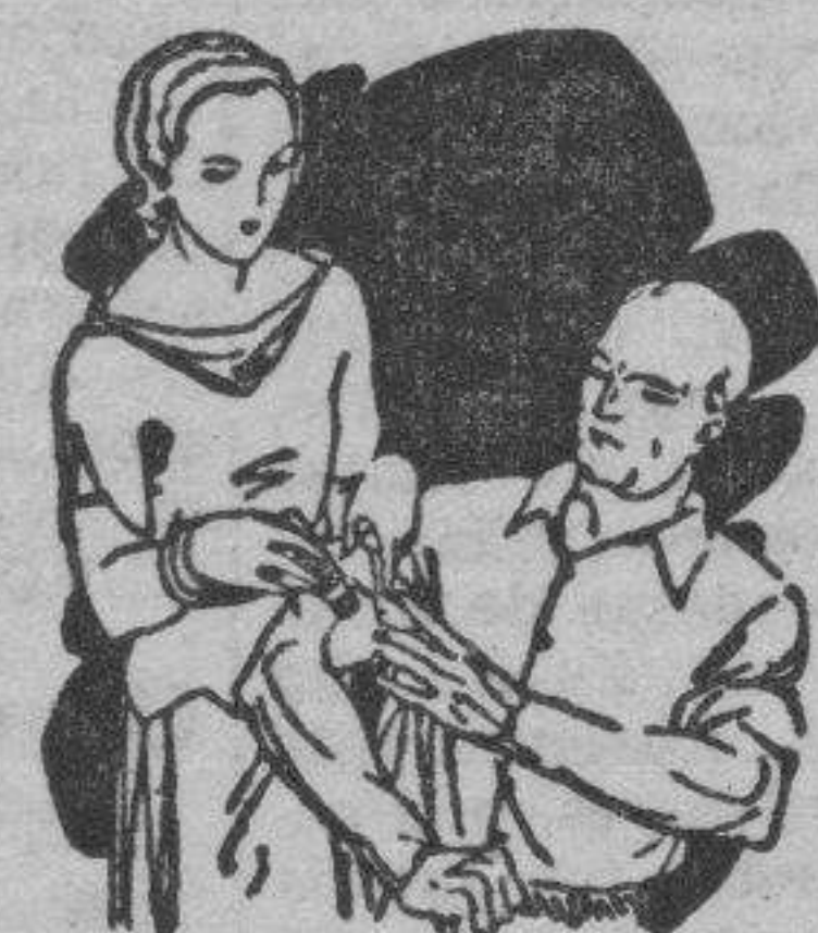
Dolor en las articulaciones Calambres

No ocupa sitio Descongiona sin irritar No ensucia No tiene mal olor