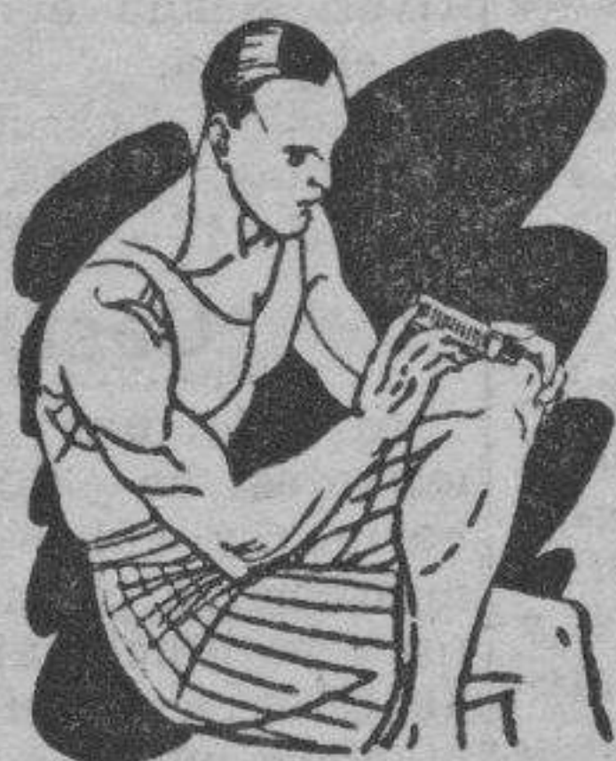
Reuma - Clática Golpes

Preparado en forma de una barrita de facilísimo empleo. Se aplica rápidamente tal como se presenta y sin tener que ensuciarse las manos.