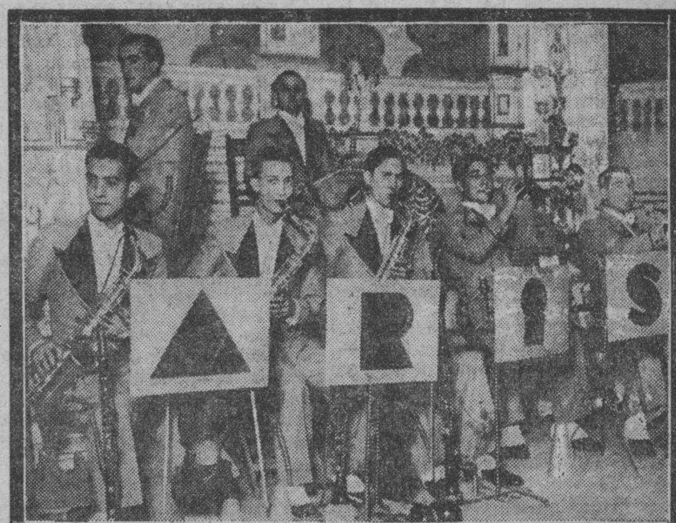
La orquesta moderna "The Arisso Jazz", que tan brillante actuación logró ayer con motivo de la tradicional fiesta de las modistas zaragozanas en el Gran Teatro Iris. En la fotografía aparecen los jóvenes artistas momentos antes de dar comienzo a la interpretación de un moderno bailable.