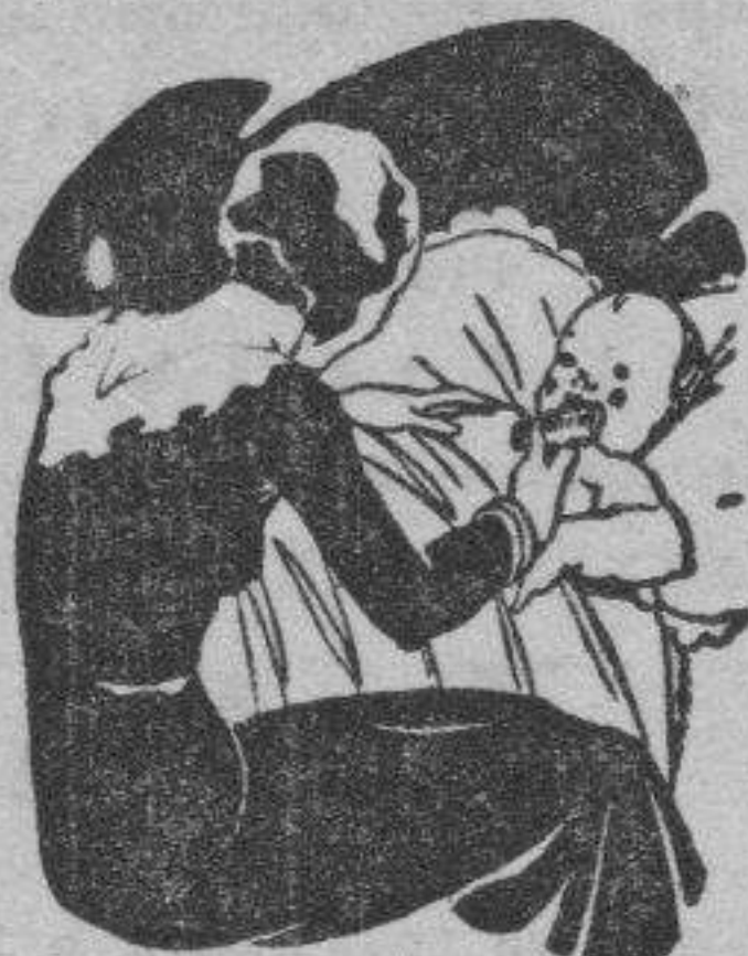
Tos - Catarros - Bronquitis Congestiones