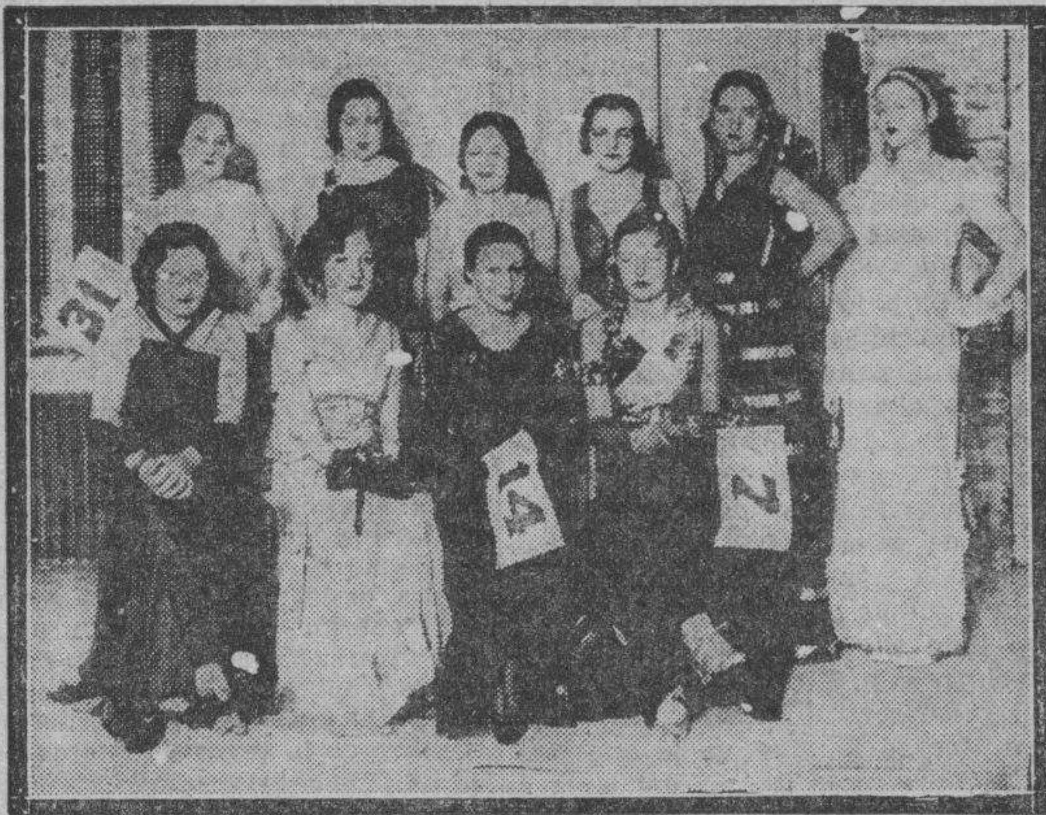
Algunas de las señoritas que acudieron a la competición del vestido de cuatro pesetas, cuyos trajes causaron la admiración del público, que casi llenó la amplísima sala de espectáculos del Iris Park, por su admirable arte confeccionador y la gracia con que los maniqués vivientes supieron vestir los modelos de tela barata.