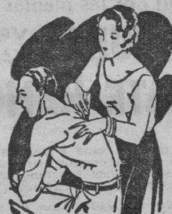
Artritis Dolores de muñeca y brazos Dolores de espalda y riñones

El LAPIZ TERMOSAN se vende en todas las Farmacias y Centros de Específicos a 4'45 pts. el tubo grande, y a 3 pts. el tubo pequeño (Timbres incluidos)