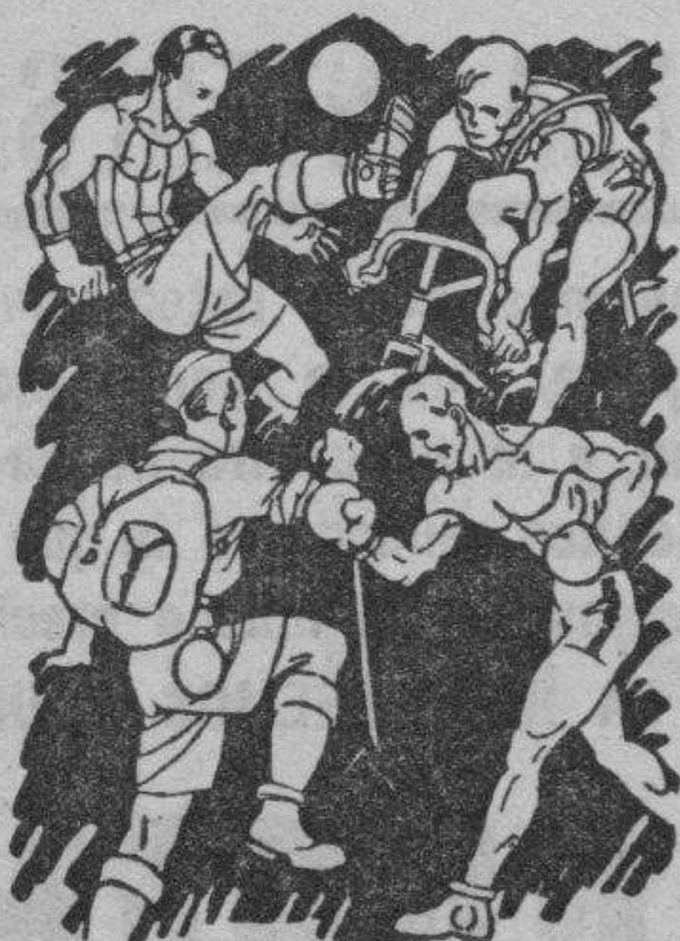
Indispensable para toda clase de sports. No ocupa sitio ni es frágil