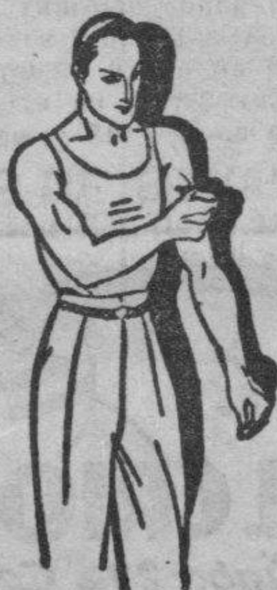
Fatiga muscular Golpes - Torceduras