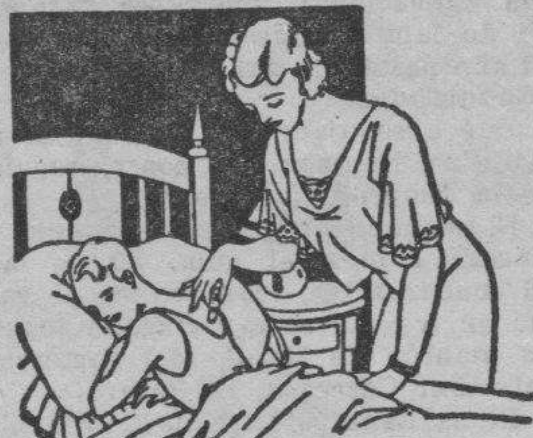
Resfriados - Asma - Pleuresias Congestión pulmonar