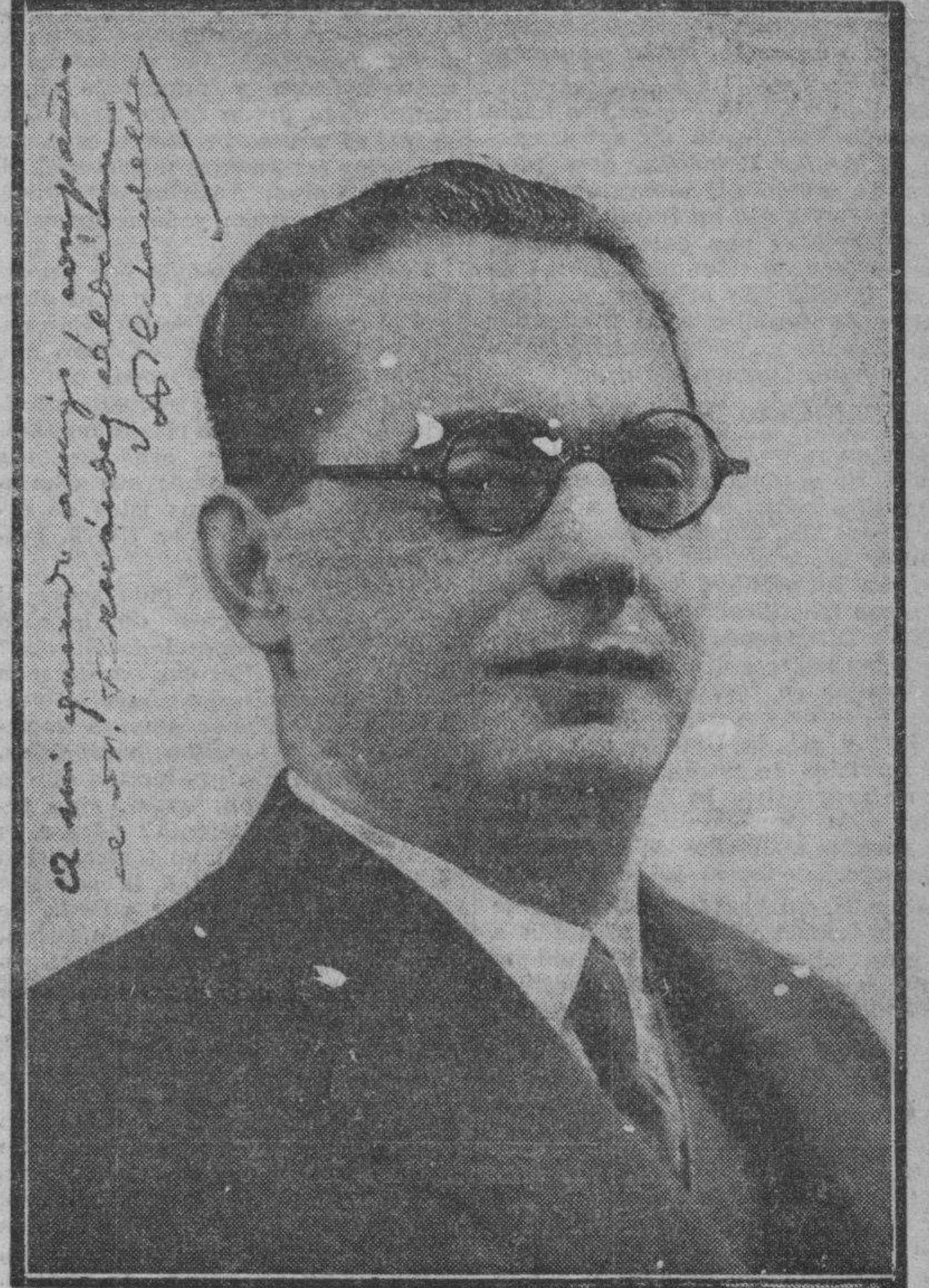
El doctor Estadella, primer ministro de Higiene y Sanidad de la República.