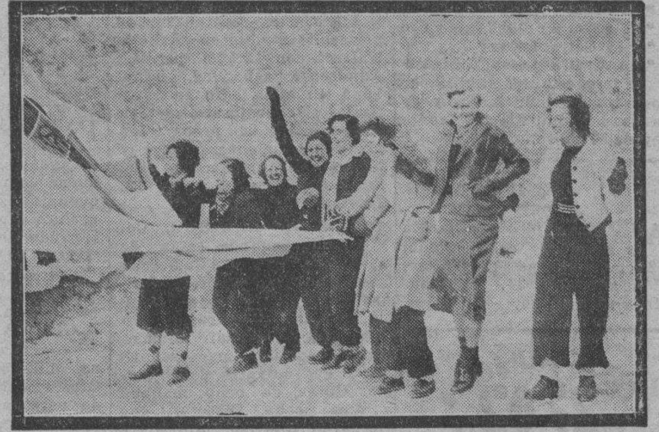
MADRID. — Bellas deportistas de la nieve que asistieron a la inauguración del chalet del Club Alpino, izan la bandera en medio de gran alborozo.