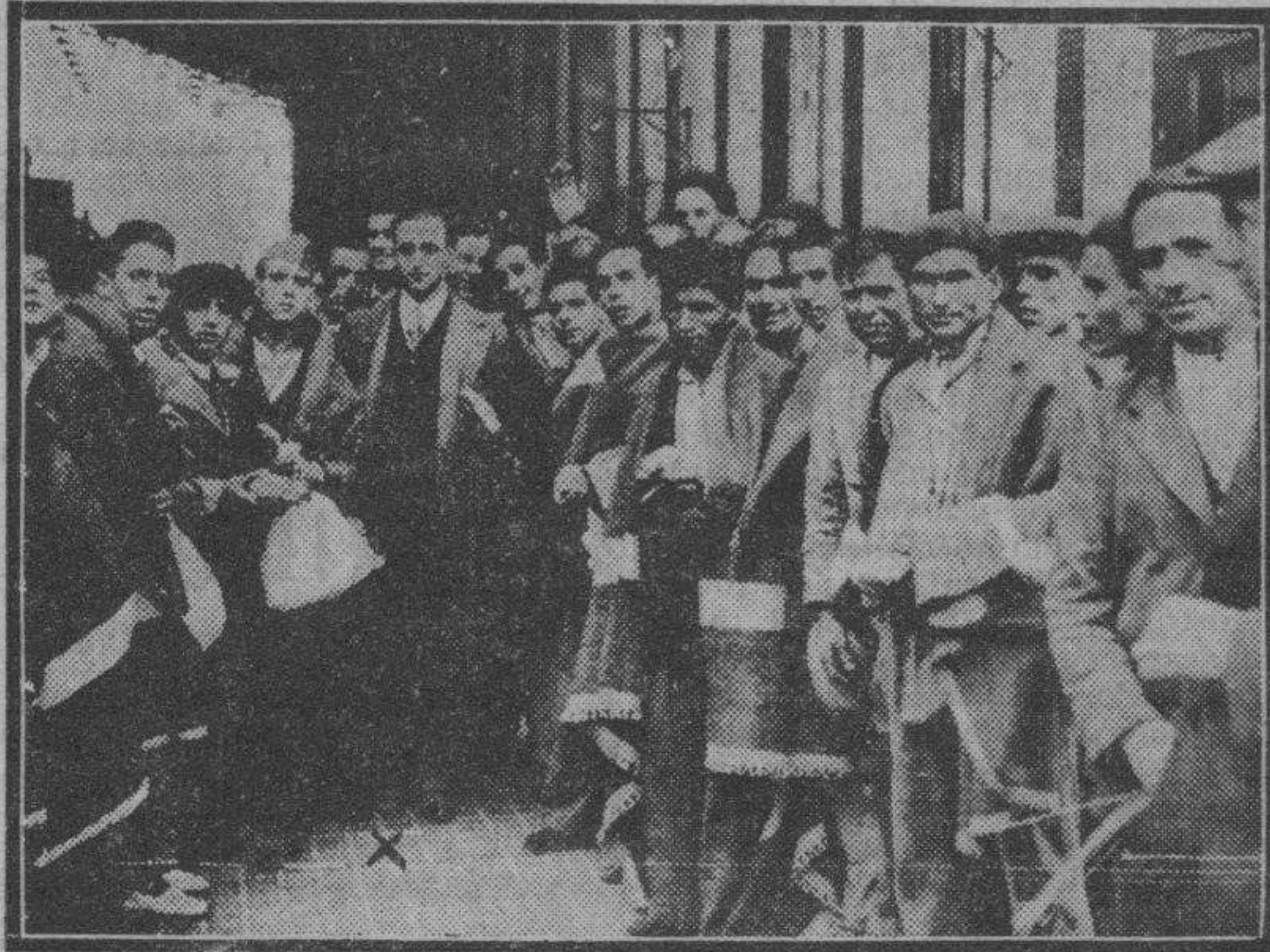
El hijo del presidente de la República (x) que ayer pasó por nuestra ciudad, en compañía de los soldados que van a guarnecer la plaza de Jaca, en calidad de soldado de filas.