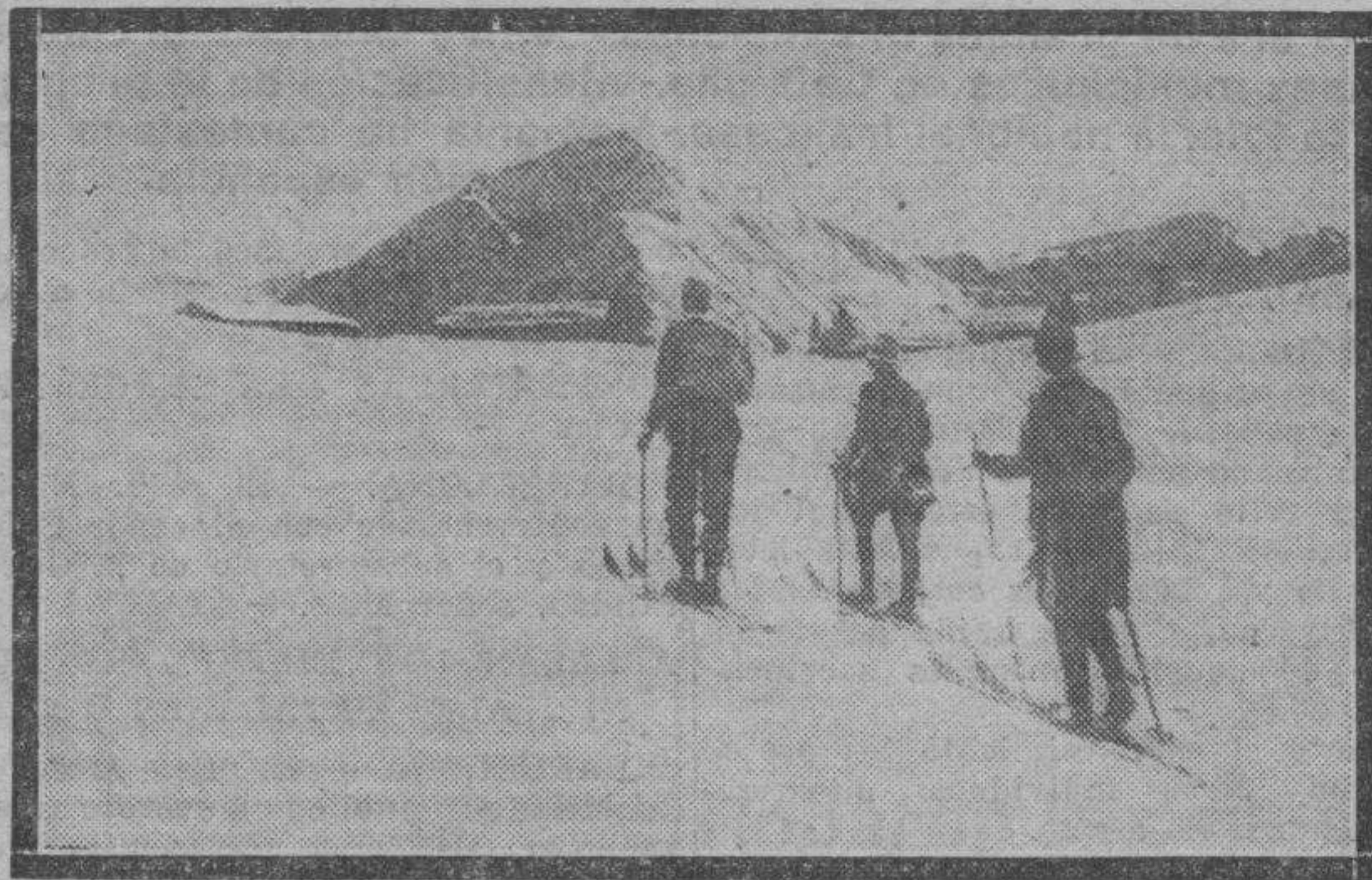
El domingo comenzó la temporada de "ski" en el Pirineo aragonés. — Un grupo de montañeros inauguró la temporada de patinaje en las pistas de Candanchú, encontrando la nieve en excelente estado. Los aficionados de Zaragoza están de enhorabuena, pues es ésta la primera salida de esquiadores españoles a practicar su deporte favorito en esta temporada.

No levanta cabeza el Unión. Al golpe de no clasificar para la Copa de