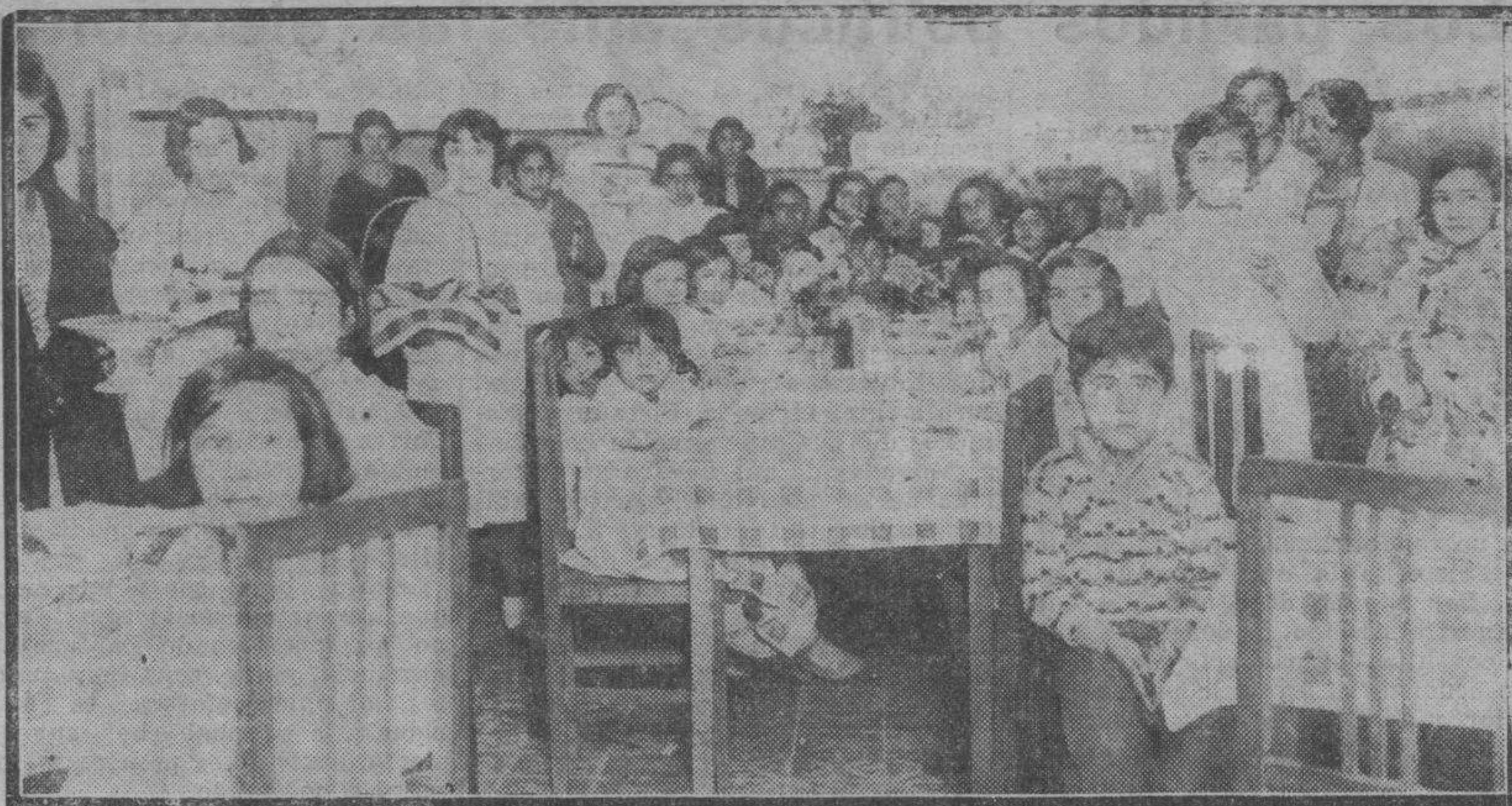
La Junta provincial de Protección de Menores ha montado con esplendidez el comedor del grupo escolar de los Graneros. La foto presenta un aspecto de ese comedor, donde reciben nutritiva comida diariamente ochenta niños.

biese estado, en la urna de Kammamuri durante ocho días, porque ayer, a cuantas preguntas le hacía el fiscal sobre los hechos que dieron motivo al sumario contestaba que no recordaba nada.