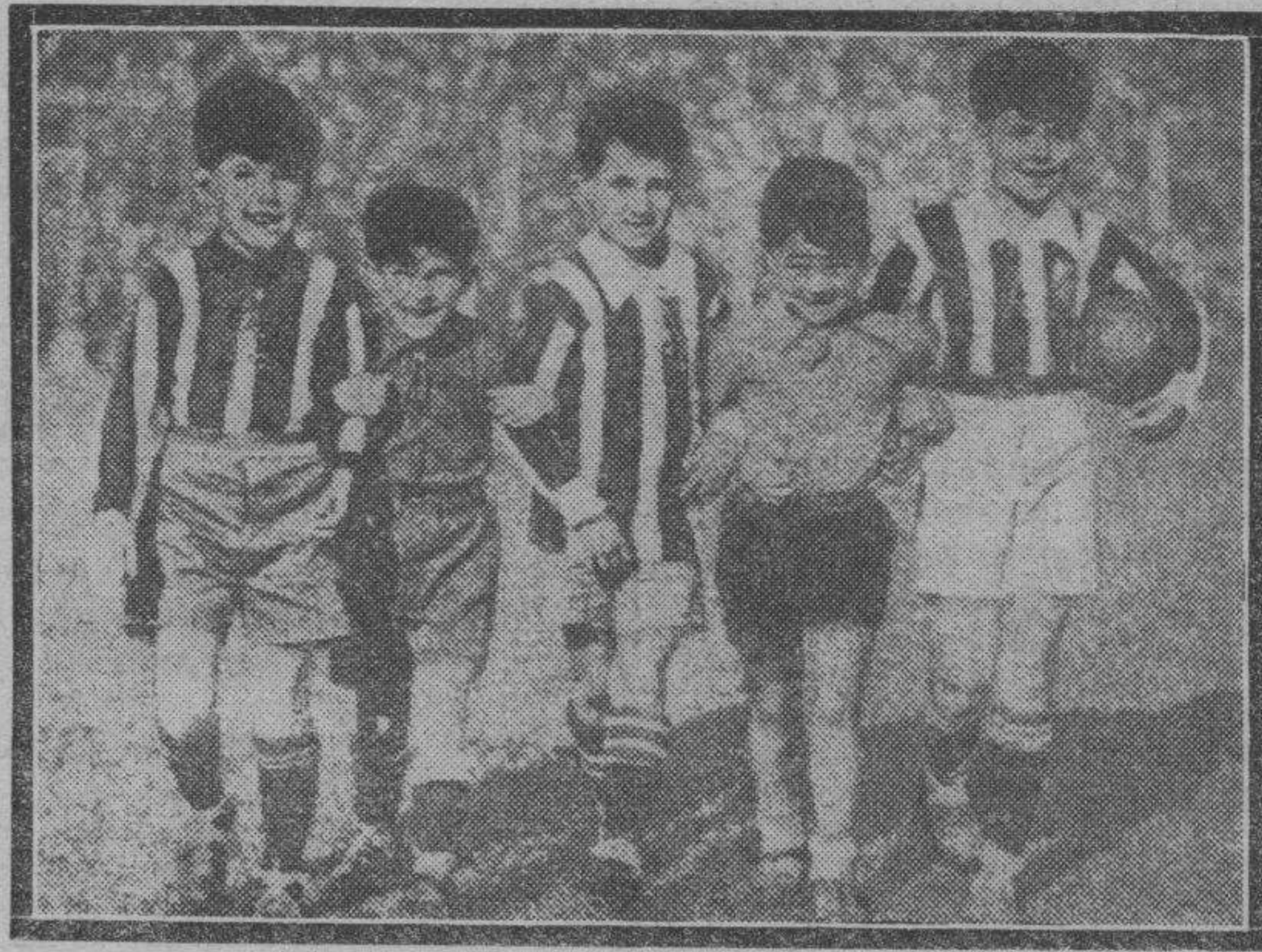
Simpática manera de entender la rivalidad la de estos pequeños futbolistas, ¿verdad?

Las gestiones que realiza la Empresa Parra cerca del "manager" de Oroz van por excelente camino, y sólo hace falta concretar algunos detalles para llegarse a la formalización de tan sensacional pelea, que se celebrará el próximo sábado 26, como fondo de una velada en la que actuarían las primeras figuras regionales frente a destacados valores forasteros.