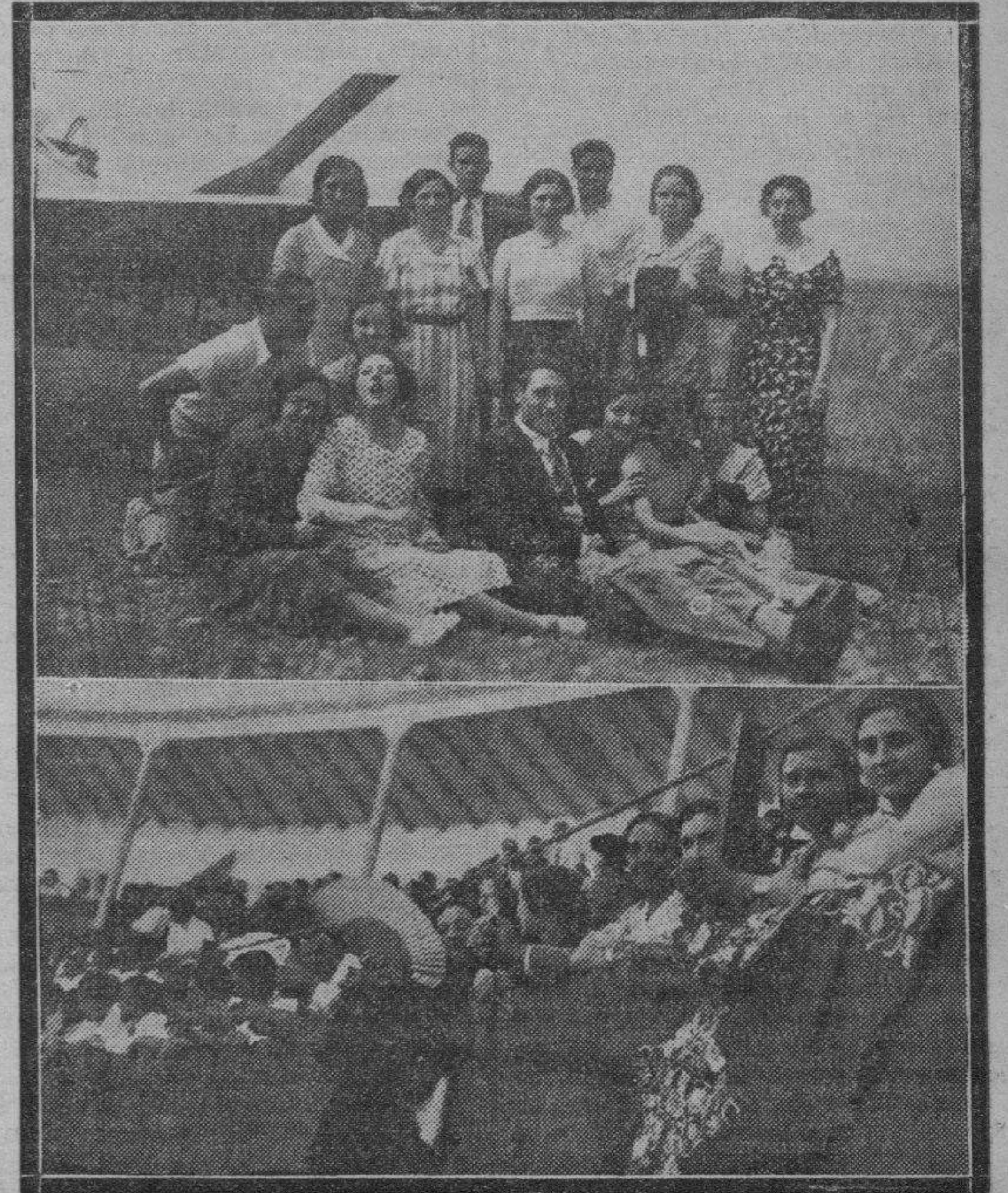
ALFARO. — Las fiestas han alcanzado este año gran brillantez. Arriba: Un selecto grupo de bellas muchachas alfareñas, poco después de haber recibido su bautismo de aire en los aviones militares que tomaron parte en los festejos. Abajo: Un aspecto del tendido de la plaza de toros, durante la corrida celebrada con motivo de las fiestas.