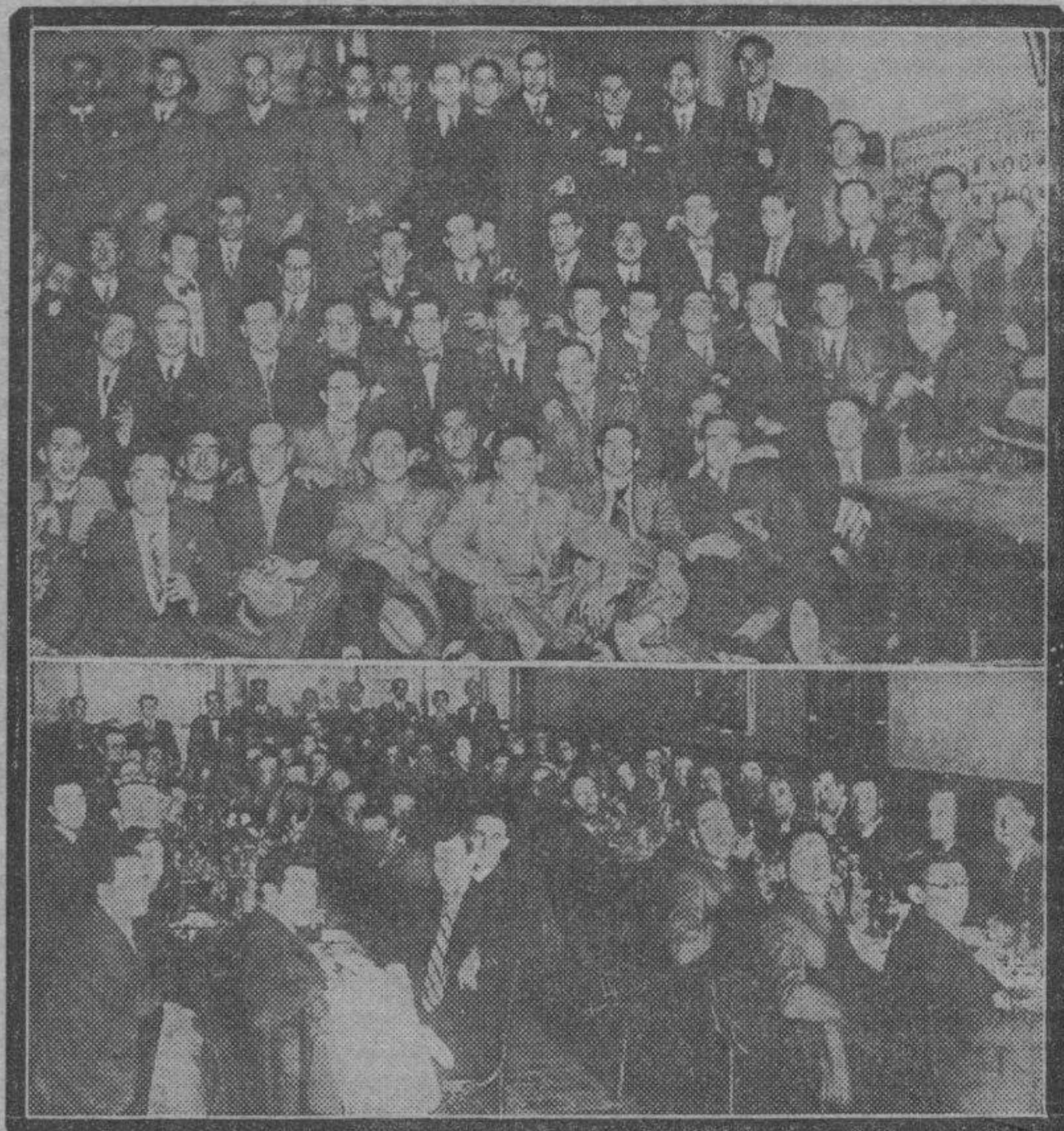
Se ha cumplido el segundo aniversario de la fundación de la Sociedad de Dependientes de Comercio, adscrita a la U. G. T. Con tal motivo celebraron sus afiliados el domingo diversos actos, destacando el banquete que tuvo lugar en la Posada de las Almas, de cuyo acto son las fotografías que publicamos.

(Información de dichos actos en "Vida Obrera".)