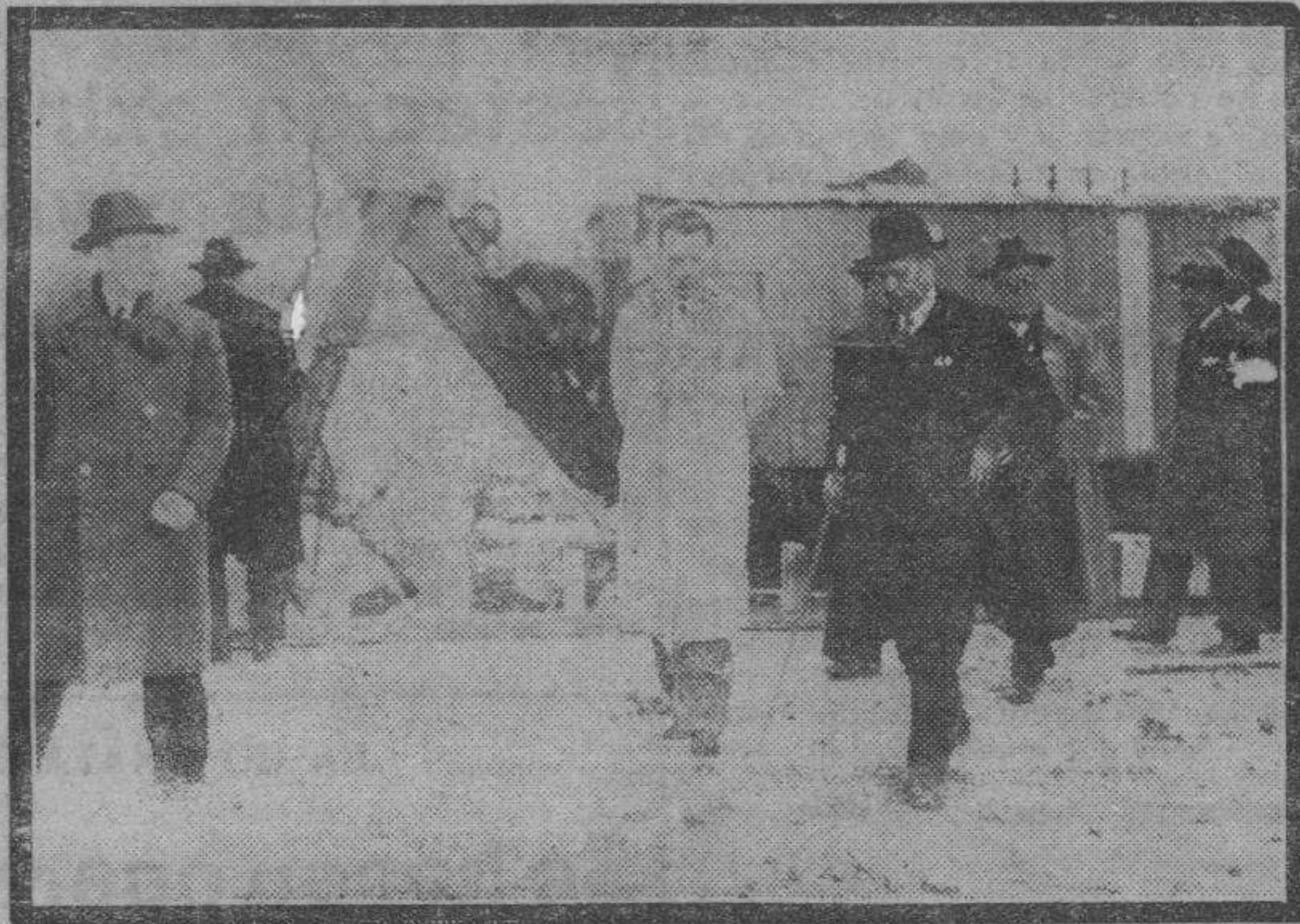
El director general de Obras Hidráulicas y alto personal de la Mancomunidad del Ebro, durante su visita a las obras de la presa de Biscarrués.