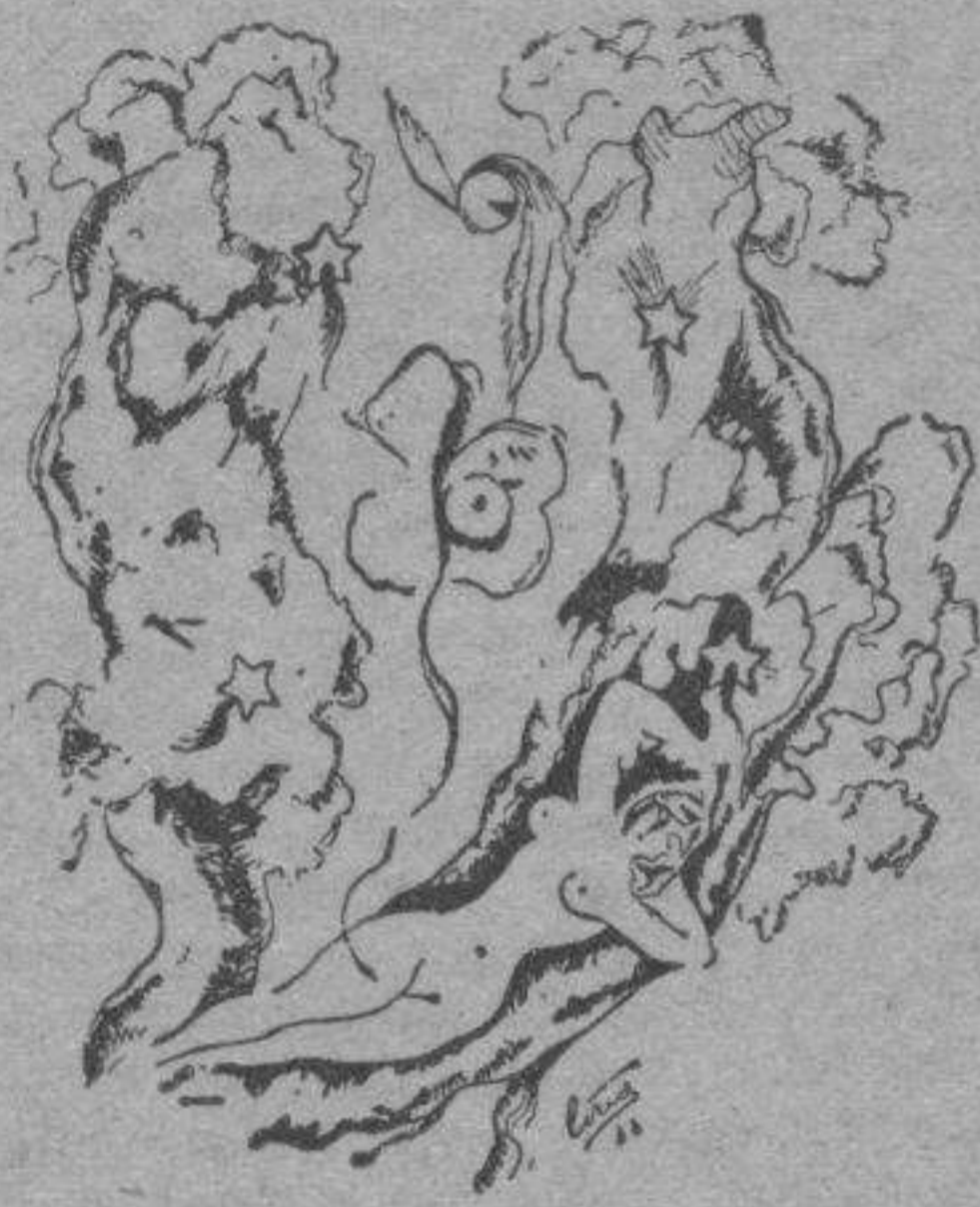
Una de las ilustraciones de Ciria en “Del amor violento”.

Ciria, el gran Ciria, ha ilustrado preciosamente, certemente, estos