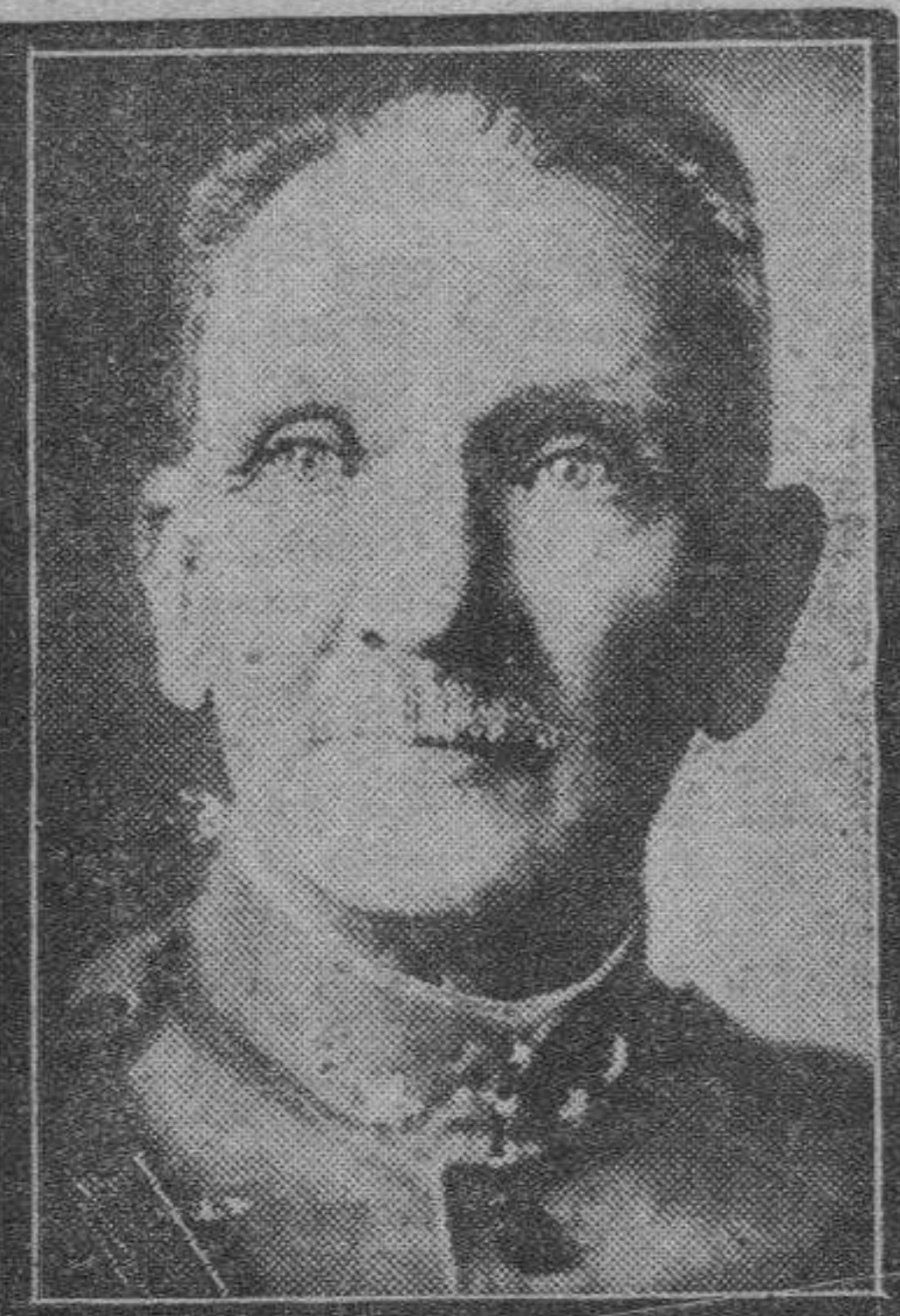
El general Díaz López, generalísimo de los sublevados de San Paulo.