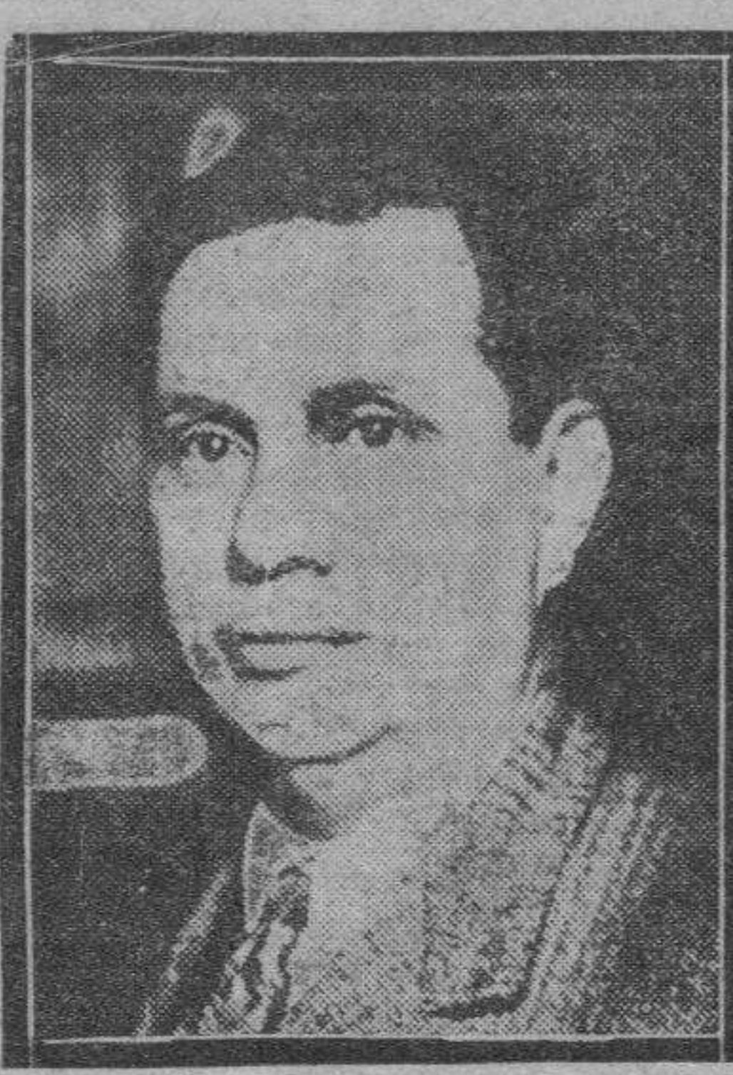
El general Goes Monteiro, generalísimo de las tropas gubernamentales.