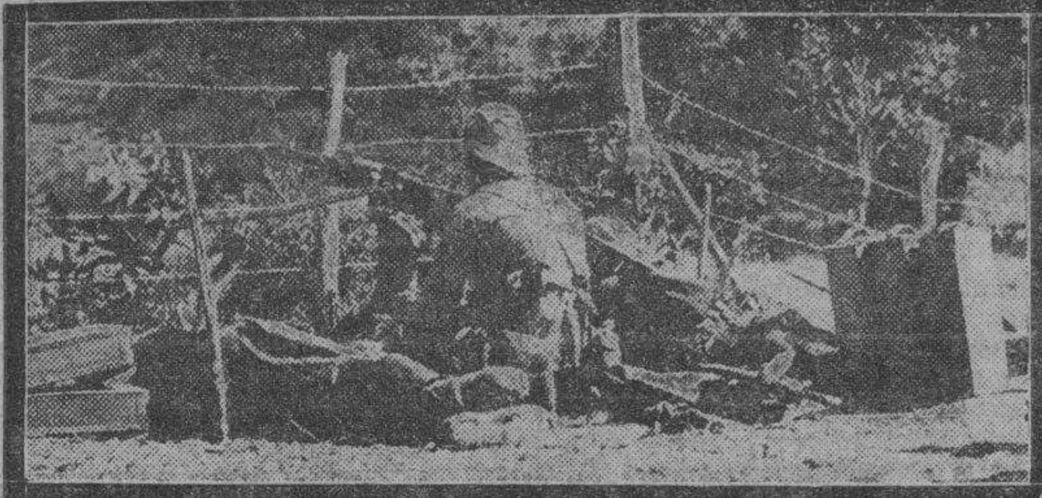
Tropas leales batan con fuego de fusil a los rebeldes, protegidos por alambradas, en las inmediaciones de San Pablo.