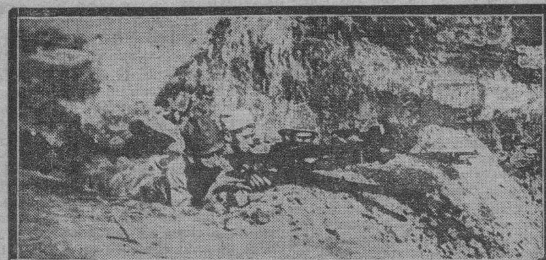
Por los campos, con táctica de emboscadas, los soldados rebeldes, que van provistos de armamento modernísimo, tirotean a las fuerzas gubernamentales.