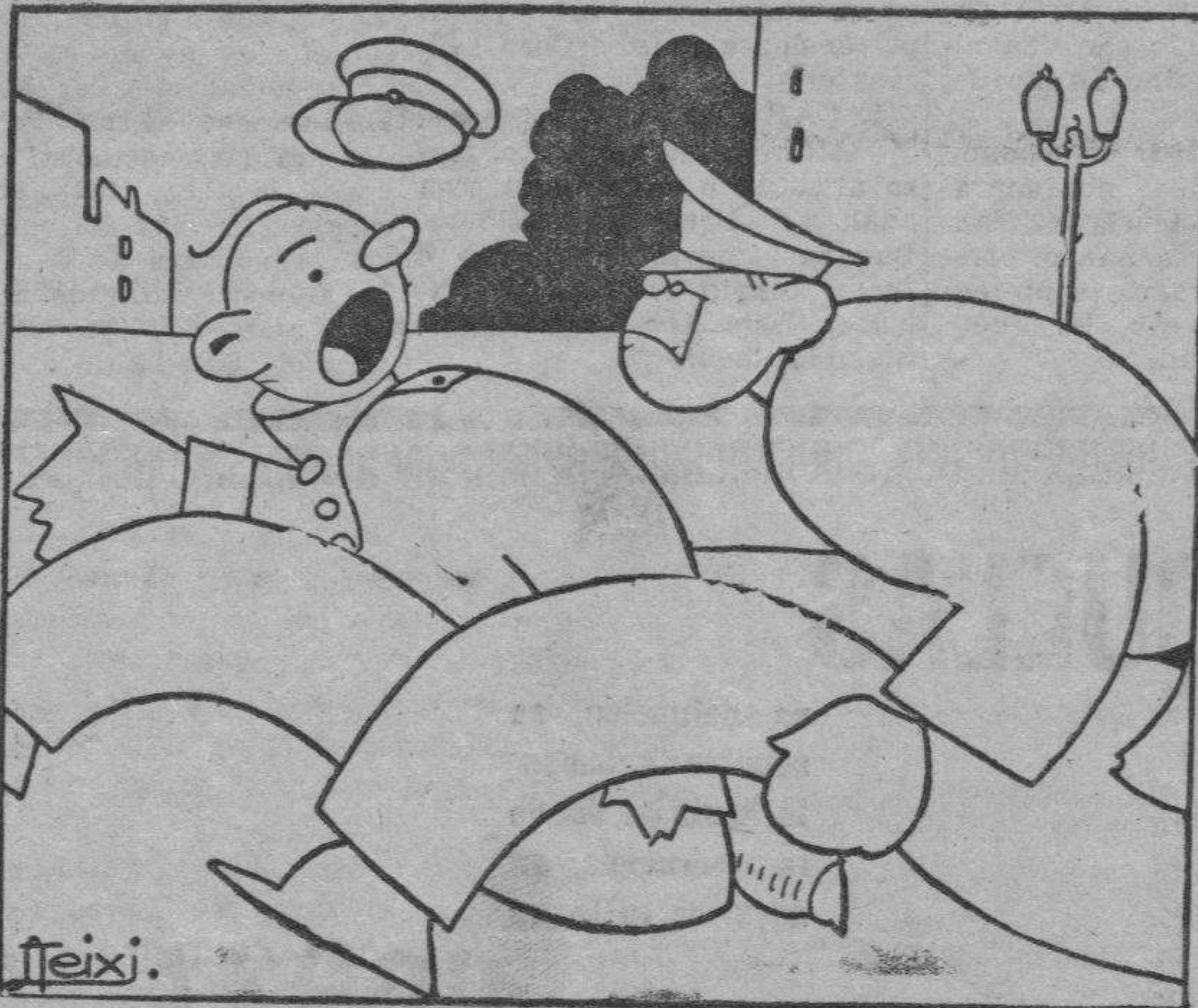
El conductor del tranvía se encuentra por la calle con el conductor del autobús.