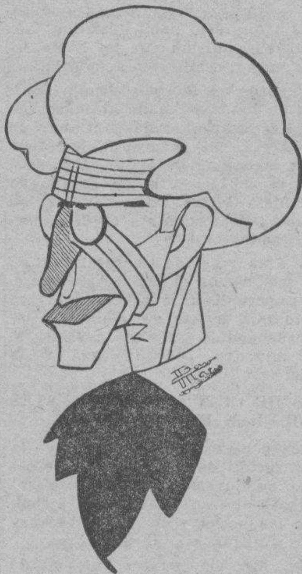
"El cierre de las Academias Militares —ha dicho el señor Algora— el anuncio de la ley de funcionarios y la limitación de la carrera de ingeniero, hacen que un aluvión de jóvenes estudie medicina".

Se aprueba el artículo primero por 229 votos contra 24.