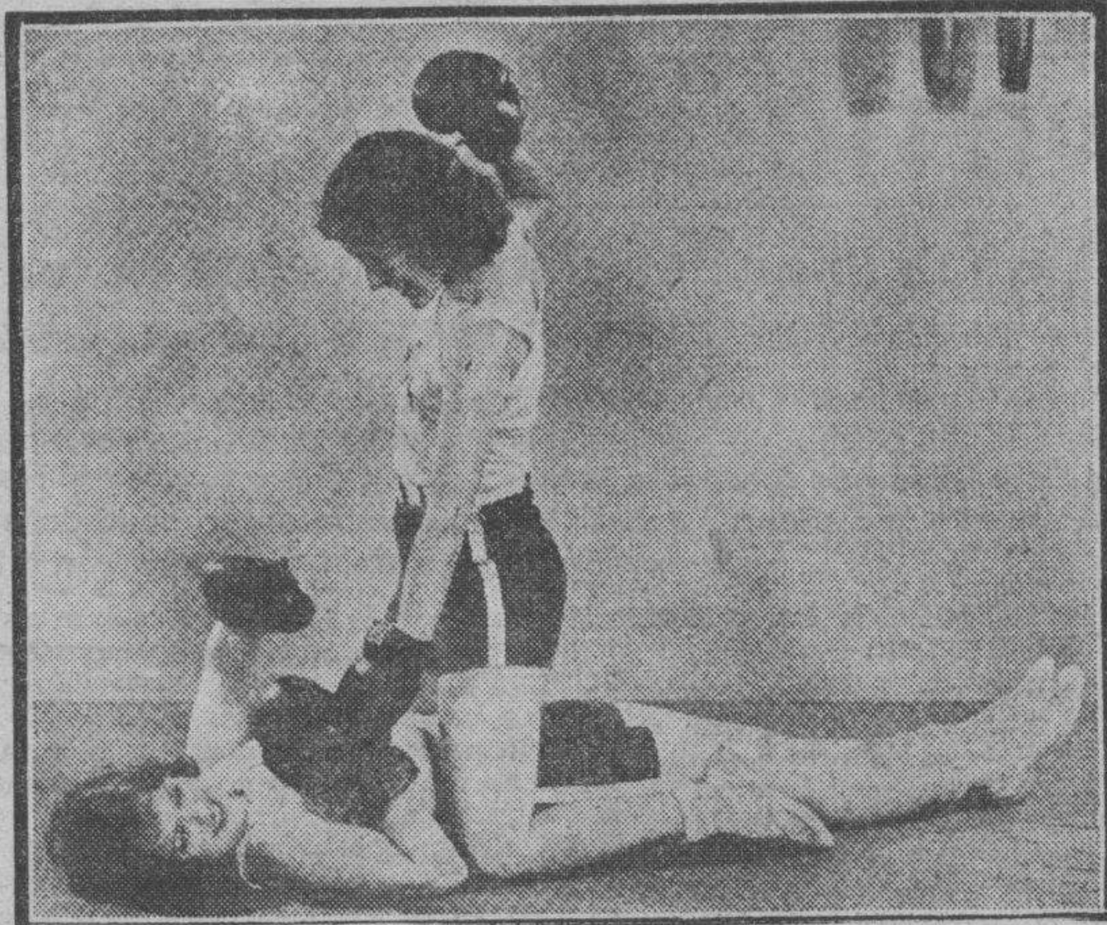
El boxeo lo toman "tan a lo vivo" estas guapas aficionadas que, como podrá observarse, sería difícilísimo predecir cuál de las dos resultará vencedora.