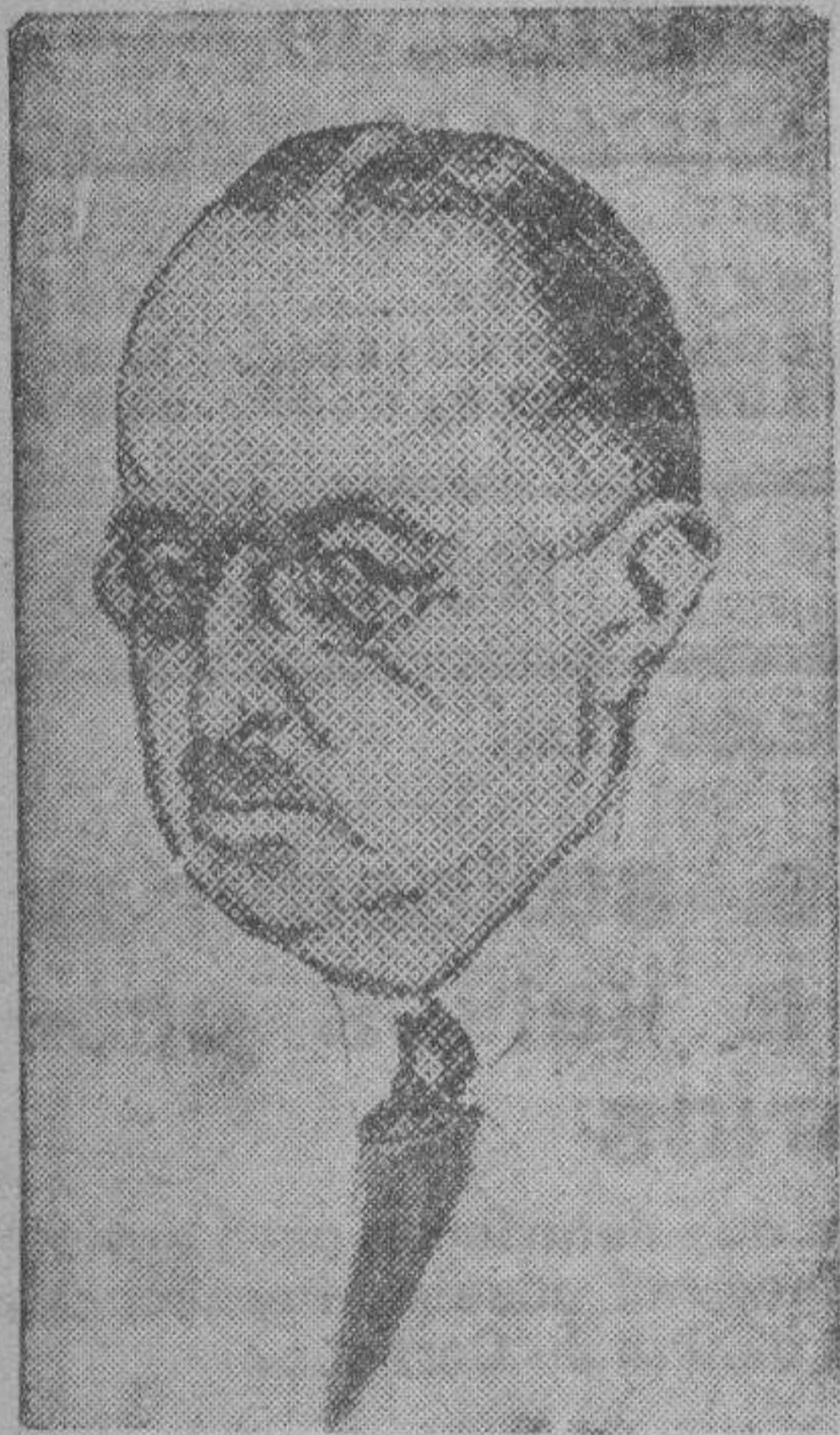
M. Tardieu, que en el nuevo Gabinete francés ocupa la cartera de Guerra, en sustitución del difunto André Maginot.

go, se trata de una figura de prestigio pacifista, y la sola noticia de su dimisión suscitó recelos en el extranjero. Briand no tiene más remedio que encontrarse mejorado. Estos días ha cobrado fuerzas, y si por precipitación médica tiene que abstenerse de ir a Lausana le sustituirá en este viaje el propio Laval, pero el ministro de Negocios Extranjeros continuará su actuación política. Será una solución a gusto de todos.