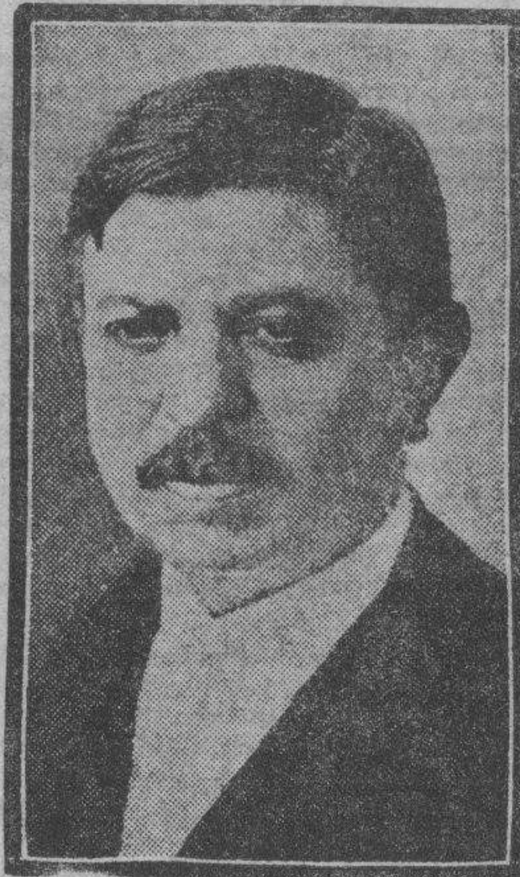
M. Pierre Laval, el prestigioso político francés, que ha sido encargado por Doumer para formar nuevo Gobierno, ocupando la presidencia del Consejo y la cartera de Negocios Extranjeros.

Poincaré ha escrito estos días que sería lamentable una guerra política interior cuando lo que la patria reclama es el mutuo y cortés apoyo de los partidos, "como parecen entenderlo incluso algunos radicales y socialistas". Salvando los principios doctrinales, están experimentando una transformación los partidos políticos en sus características funcionales. ¿Cómo se explica, si no, que un Mac Donald, sin renegar de su credo social, colabore nada menos que con Baldwin? Las repercusiones de la última crisis inglesa, resuelta en sentido de reacción nacional, no sólo repercuten en la actualidad política de los Dominios, como se vió en Australia. Repercuten en la ideología de muchas gentes, y en Francia hemos estado a punto de ver triunfar un gabinete de concentración nacional, como preconizaba Poincaré, con miras financieras exteriores.