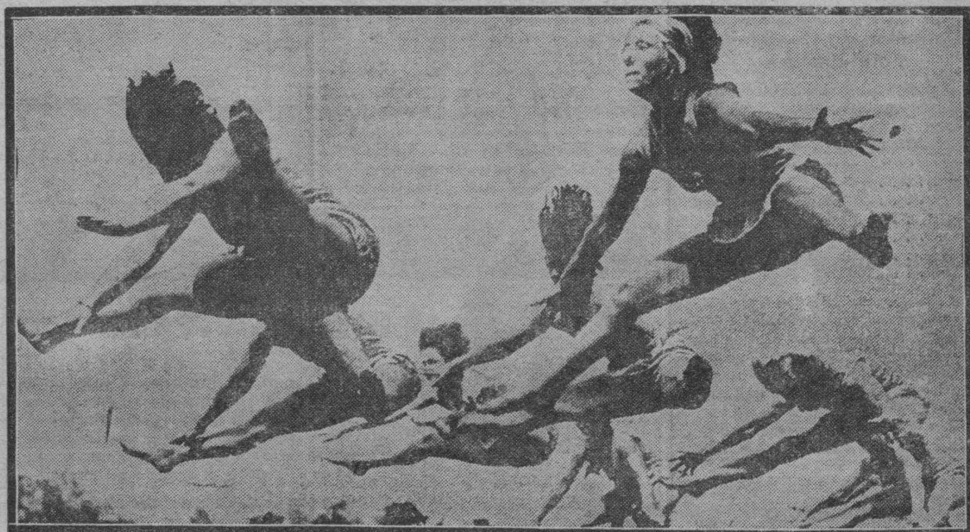
Esto, que así, de pronto, parece una cosa rara, no es tal. Se trata de los ejercicios gimnásticos realizados hace pocos días por bellas muchachas de un Club inglés.

¿Podrán los clubs de fútbol sostener por mucho tiempo su situación actual?