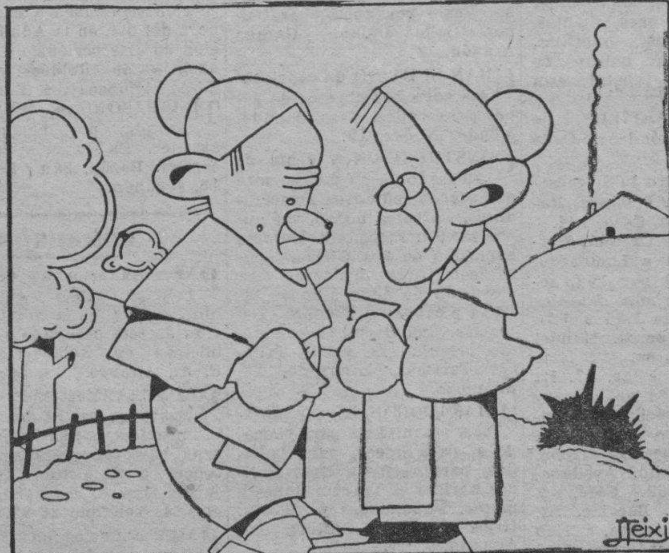
—¡Mire usted que perder el partido en Inglaterra...! —¡Y menos mal que se plantaron en siete!