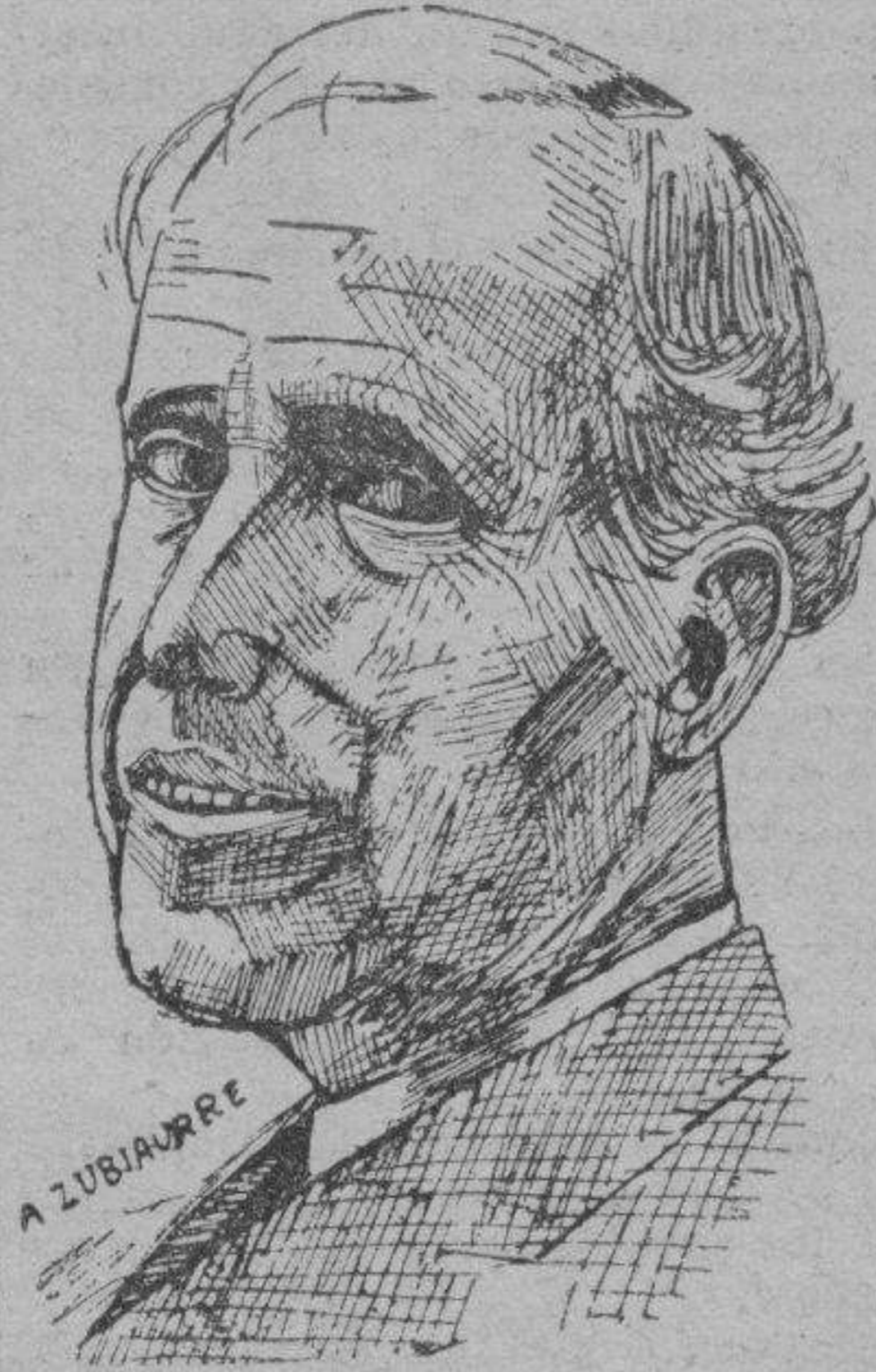
La labor futura—ha dicho el señor Besteiro—es más ardua que la realizada, por los grandes problemas que hay planteados en el mundo.

Declara solemnemente que queda promulgada la Constitución.