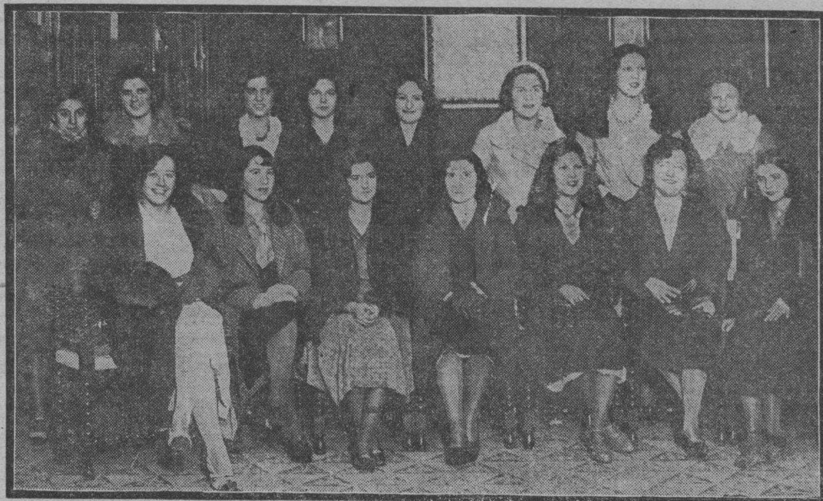
Un grupo de bellas modistas zaragozanas en su visita a LA VOZ DE ARAGON.

Hoy, de cuatro a ocho, deben ser recogidas en "La Voz de Aragón" las entradas que fueron encargadas por los diversos talleres de modistas, para la fiesta del sábado en el Iris Park