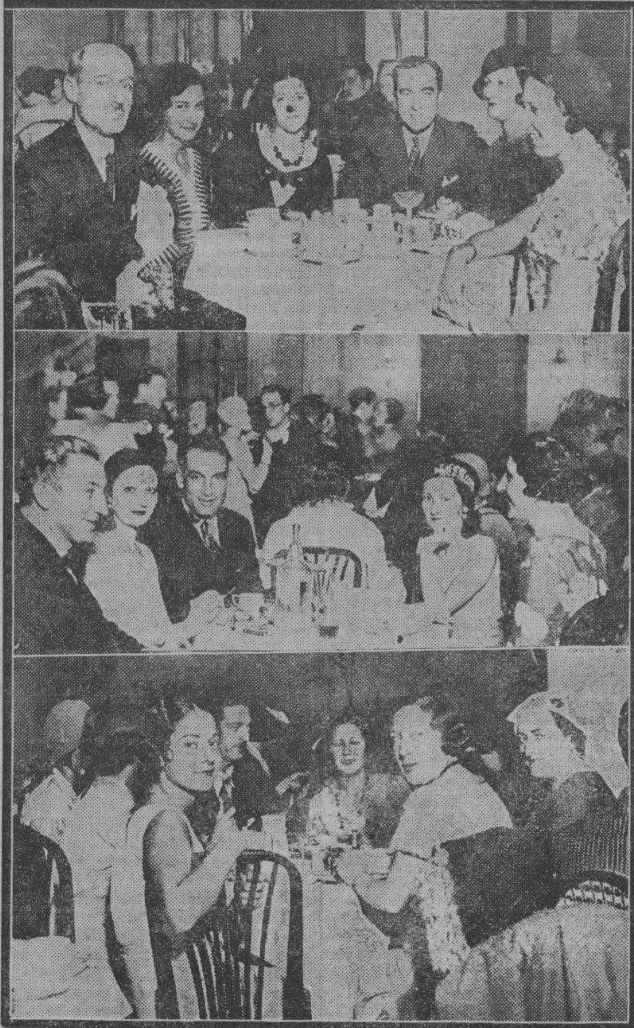
Se celebró en el Gran Hotel la anunciada fiesta de sociedad organizada por el Zaragoza Tennis Club, en la cual se efectuó el reparto de copas a los vencedores en el campeonato regional de tennis. He aquí algunos aspectos de la fiesta.