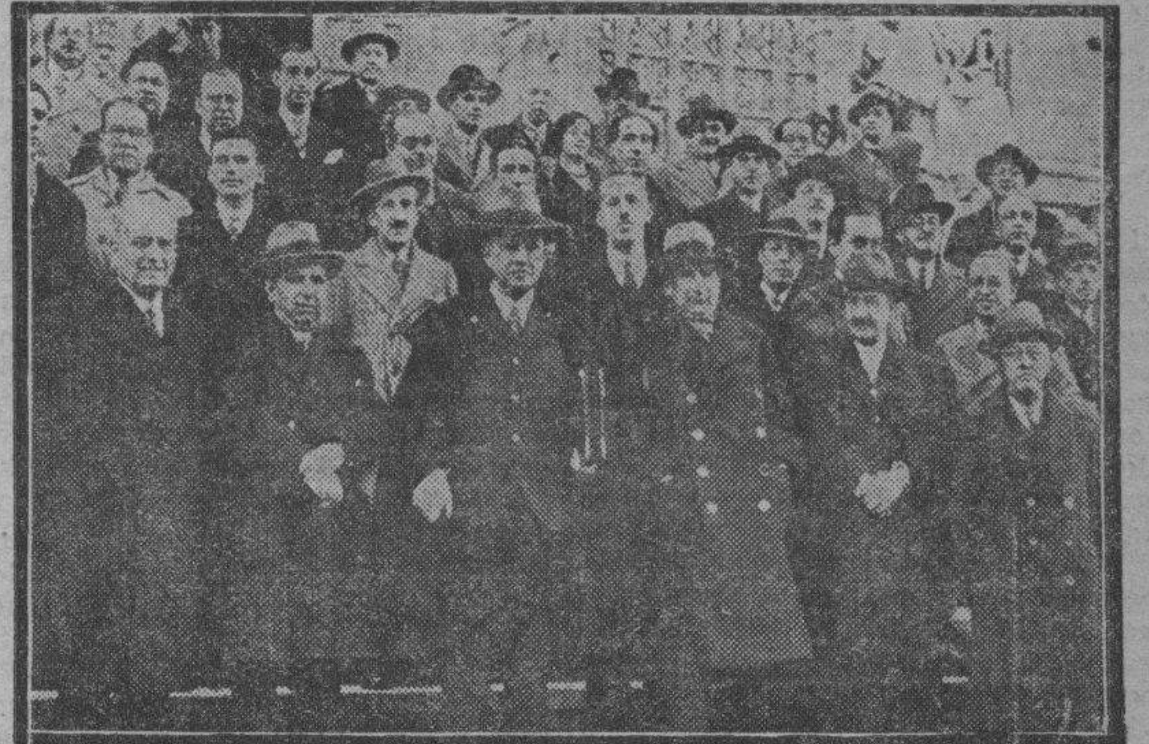
MADRID. — El ministro de Instrucción Pública con los concurrentes a la asamblea de archiveros, bibliotecarios y arqueólogos, reunida en la capital de España.