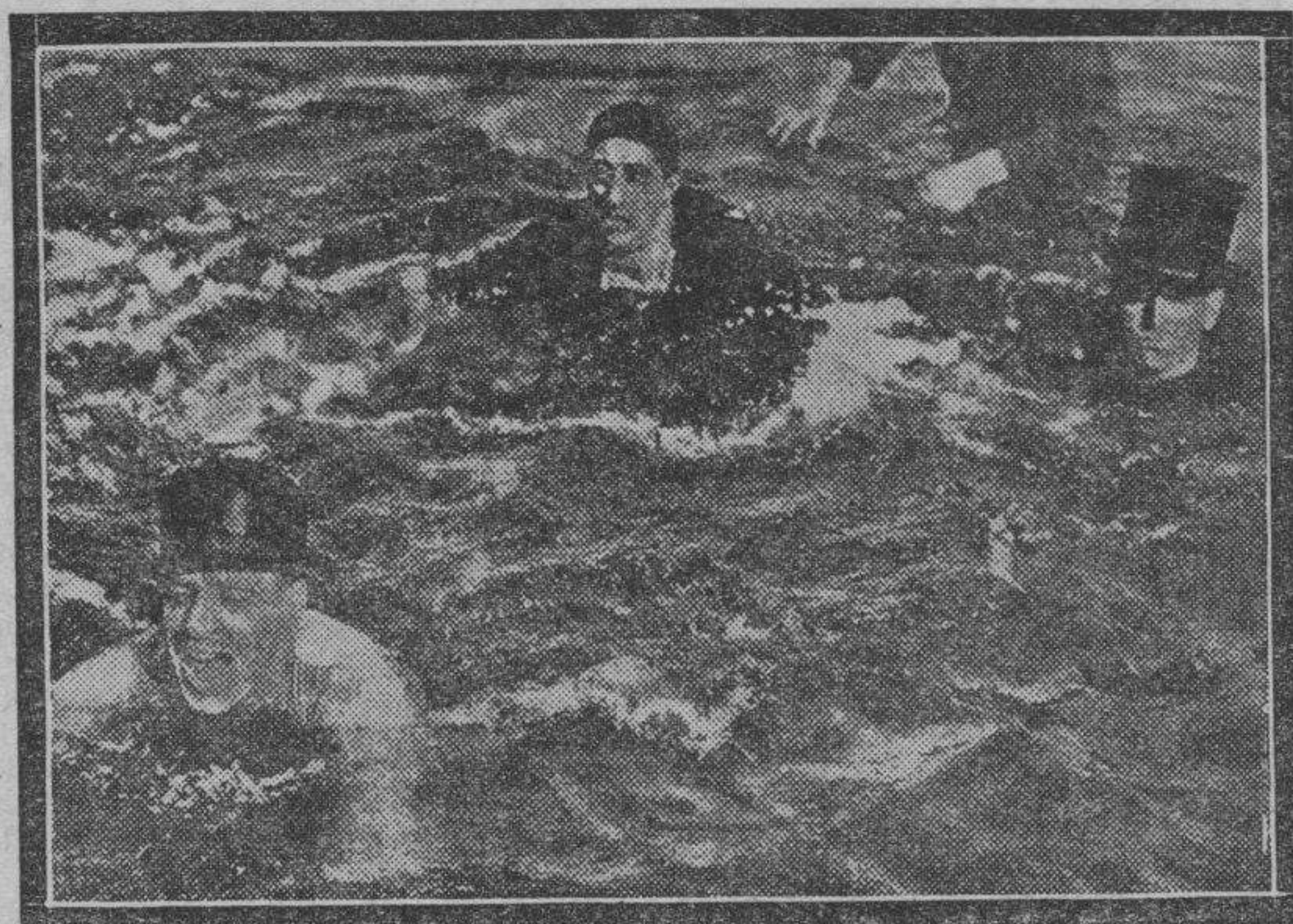
Vamos a ver, lector: ¿verdad que si lo que hacen estas muchachas no es saber nadar y guardar la ropa no hay ya en el mundo cosa más cierta?

Claro que existe la posibilidad de que un gancho izquierdo de Uzcudun encuentre en su trayectoria la mandíbula del californiano y que toda la