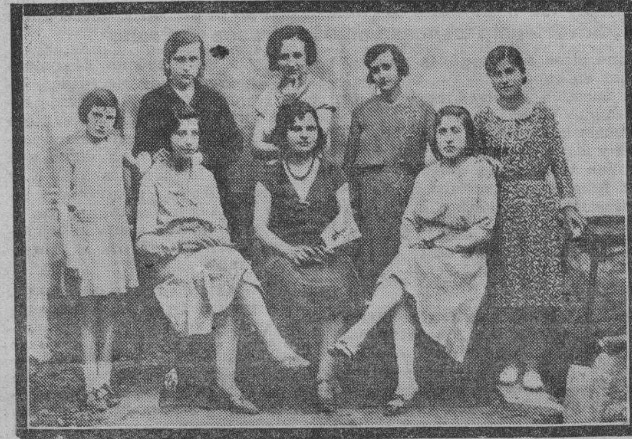
SASTAGO. — Un grupo de montisimas señoritas de la localidad que han dado extraordinario realce a las pasadas fiestas.