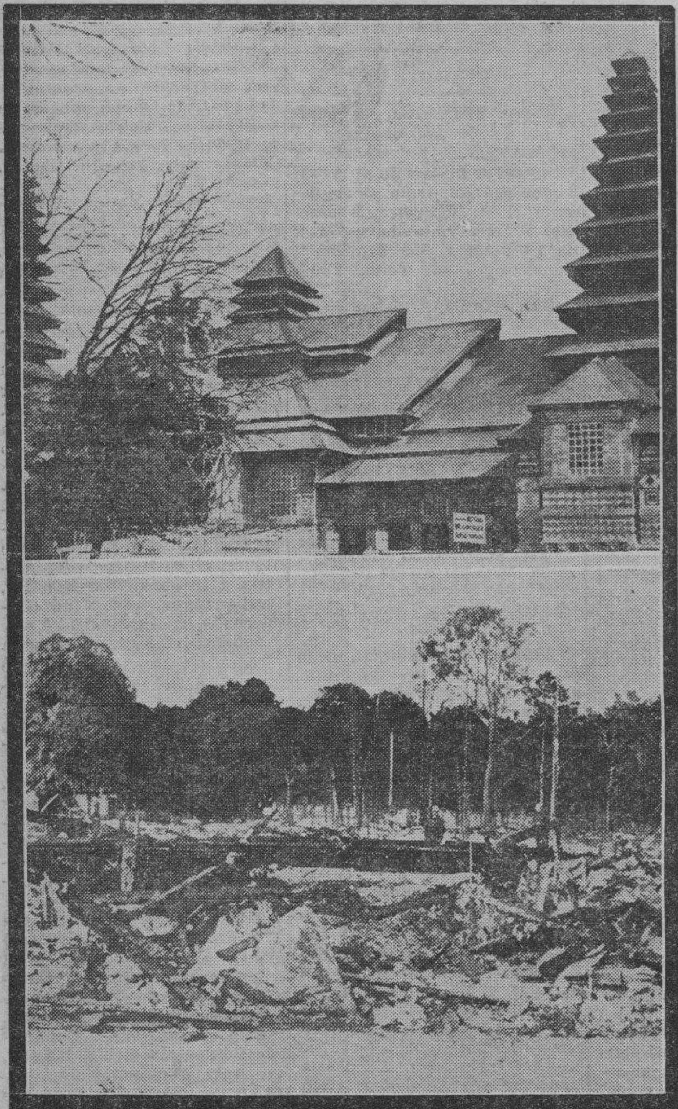
Arriba: Cómo era el pabellón de los Países Bajos en la Exposición Colonial de París. Abajo: Cómo ha quedado reducido a cenizas el mencionado pabellón, después del incendio.