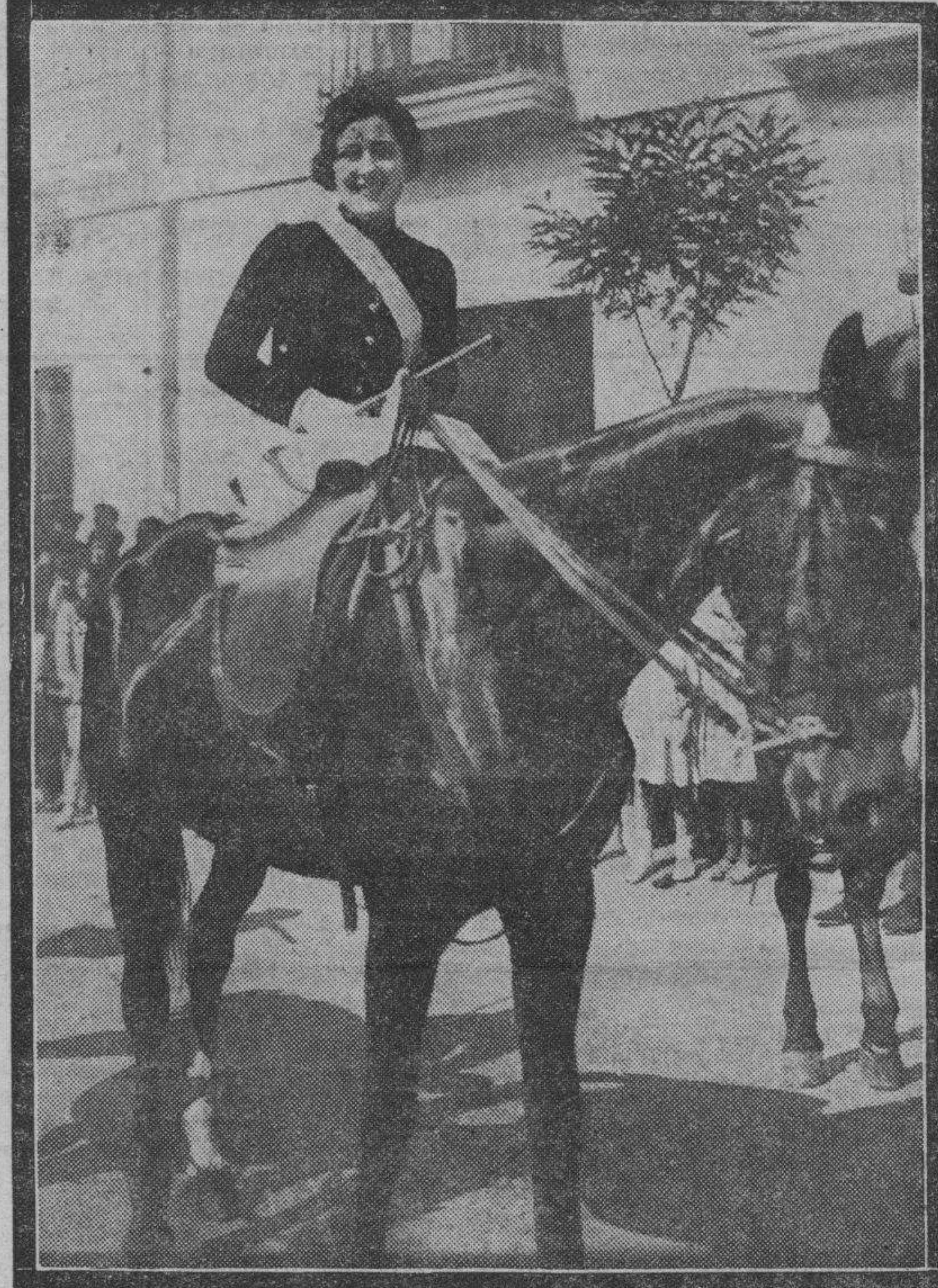
Esta arrogante muchacha irunesa ha sido una de las notas más sugestivas en las tradicionales fiestas con que Irún conmemora la victoria sobre el Ejército francés en el monte de San Marcial. El alarde de este año ha tenido su habitual brillantez, y en el marcial desfile ha figurado esta linda mujercita que sonríe, agradecida, a la justa admiración de los fotógrafos.