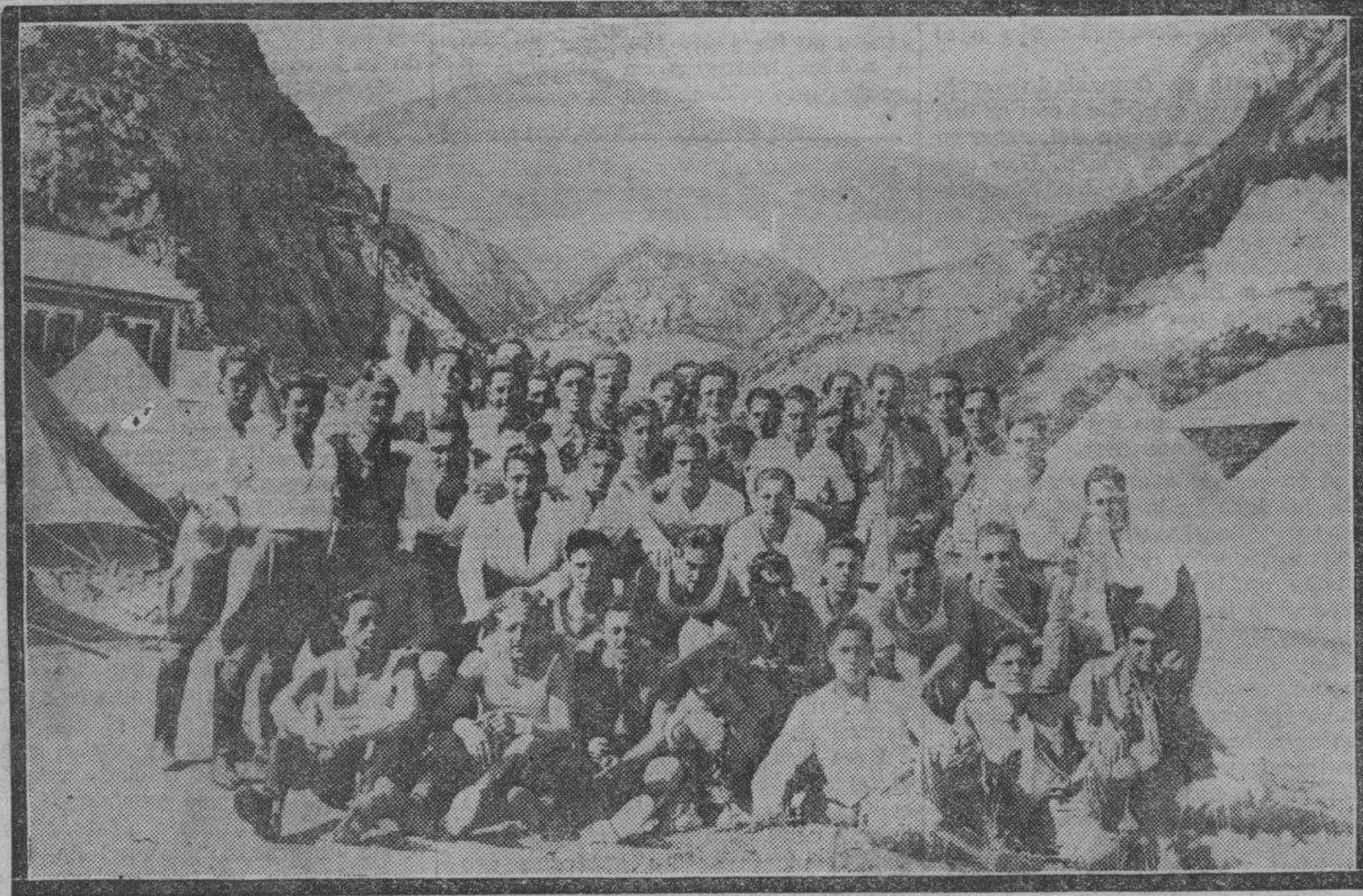
Un grupo de cadetes recién llegados a Canfranc, el pintoresco pueblo altoaragonés, posa ante el objetivo de Gotor enmarcados por las nevadas cumbres de la vertiente pirenaica.