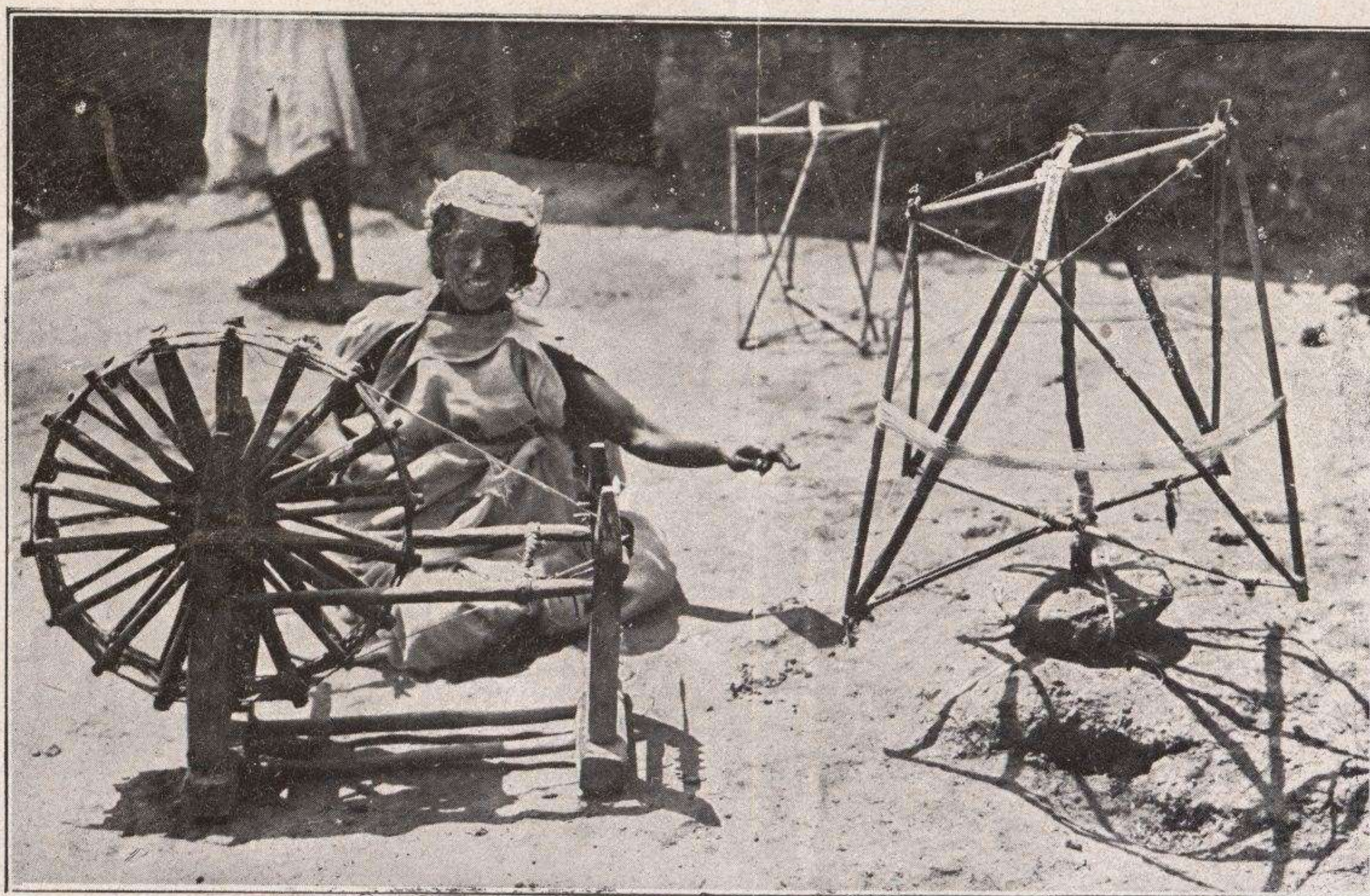
Tipos marroquies.- Mora hilando lana para tejer los jarques