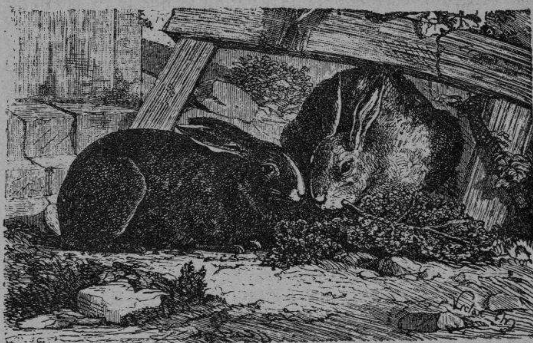
Cría de conejos.—Vivar cerrado.

Su piel, mayor que la de su congénere silvestre, es más estimada, sobre todo cuando es de color uniforme y que lleva su pelo de invierno. Sirve para varios usos en manguitería.