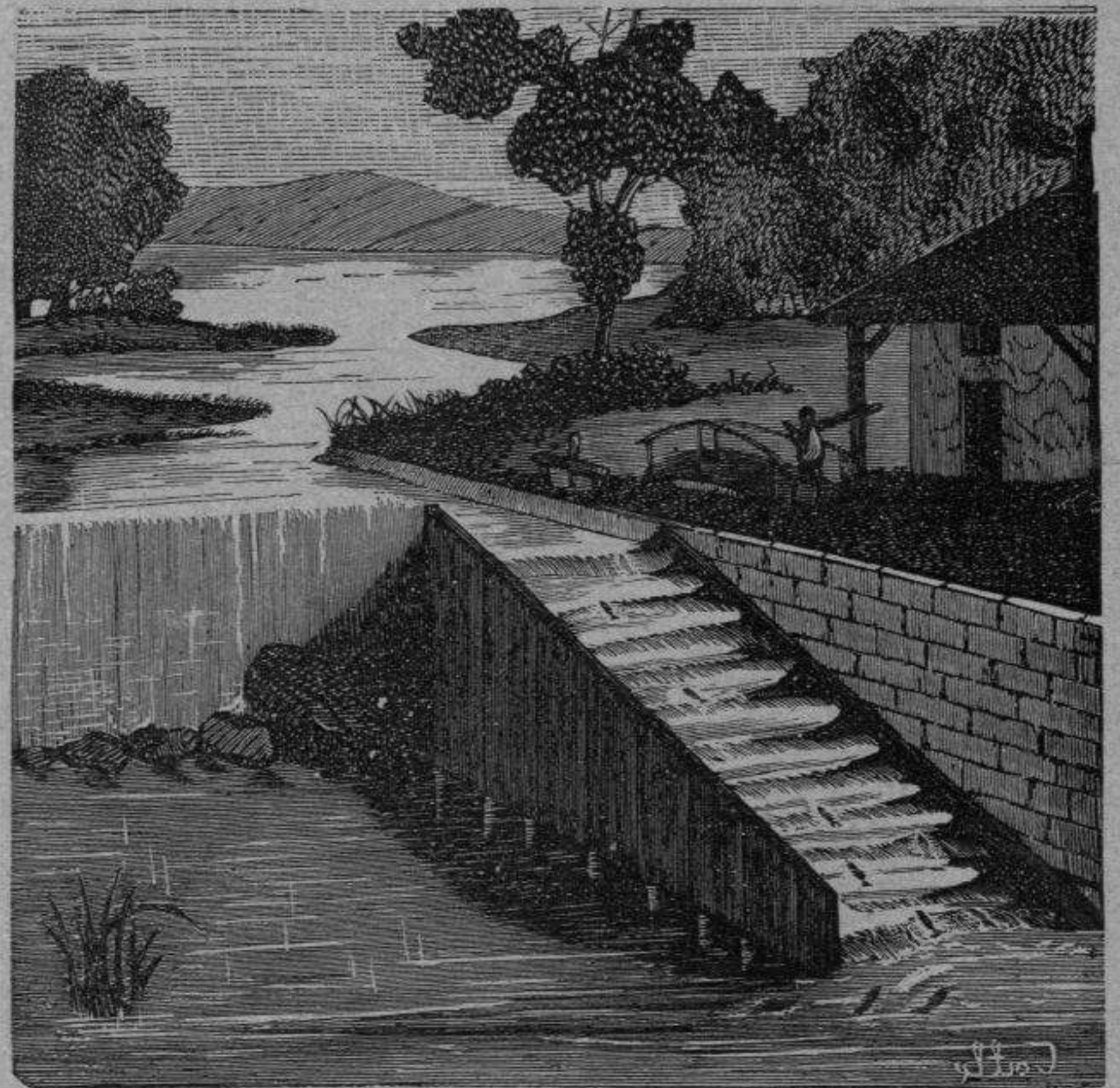
Cria del salmón, cascada artificial.

Enfermedades cutáneas del conejo. —Se observa en el conejo una sarna sarcóptica que empie-