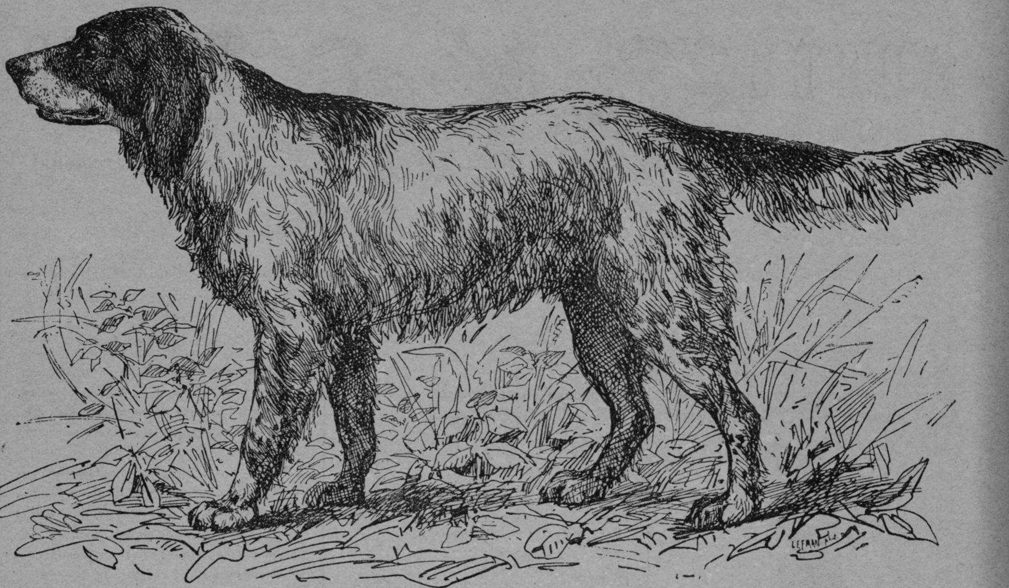
Perro Setter inglés