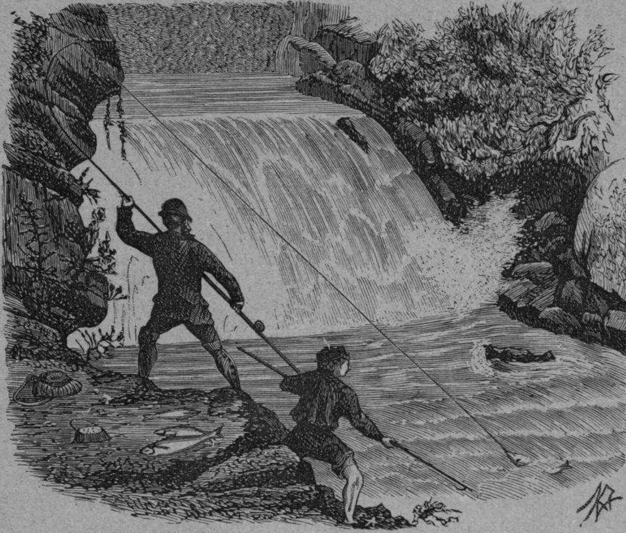
Pesca del salmón con caña.

El esquila es muy conveniente é indispensable en todos los casos.