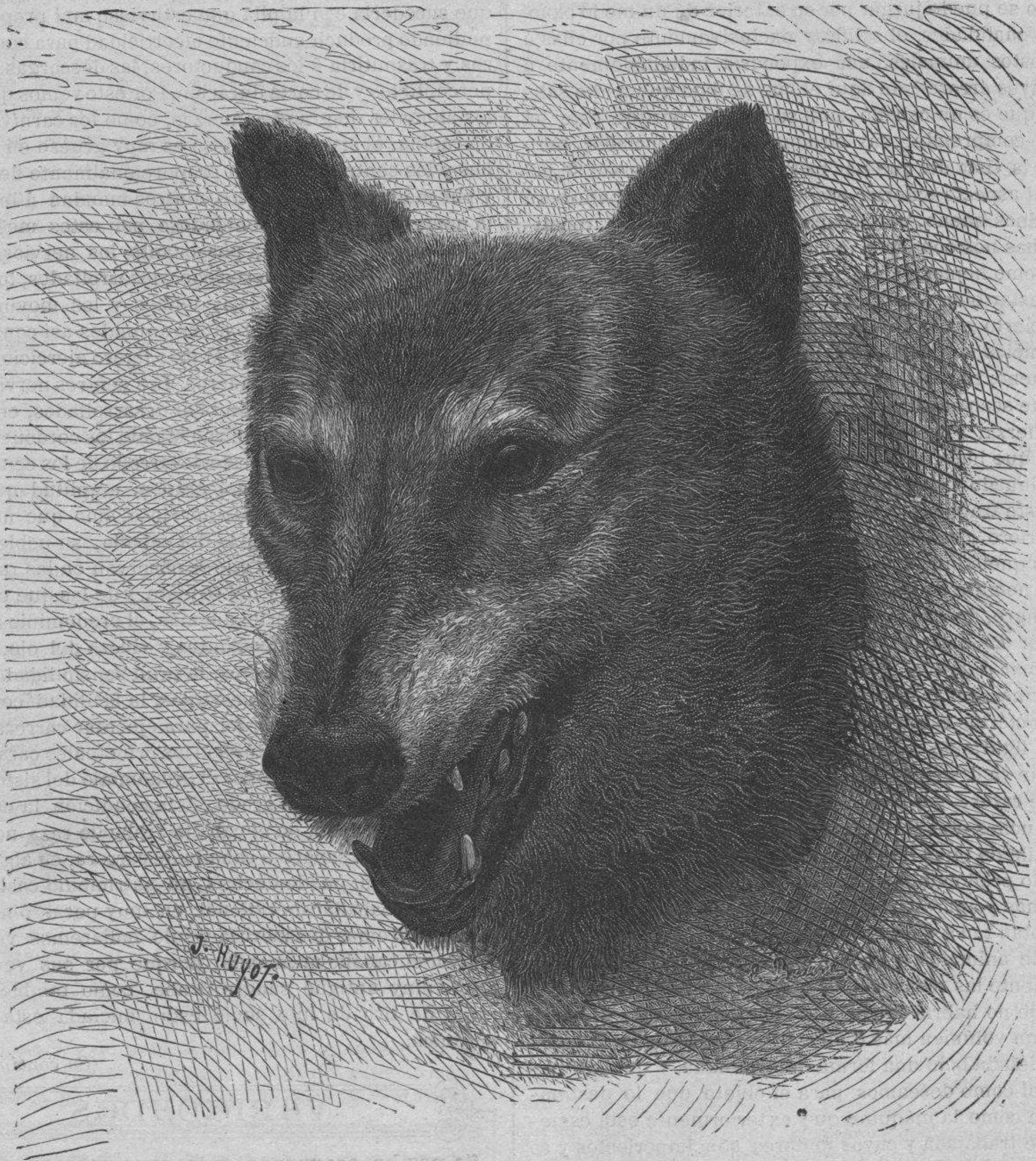
HIBRIDO DE LOBO Y PERRO.