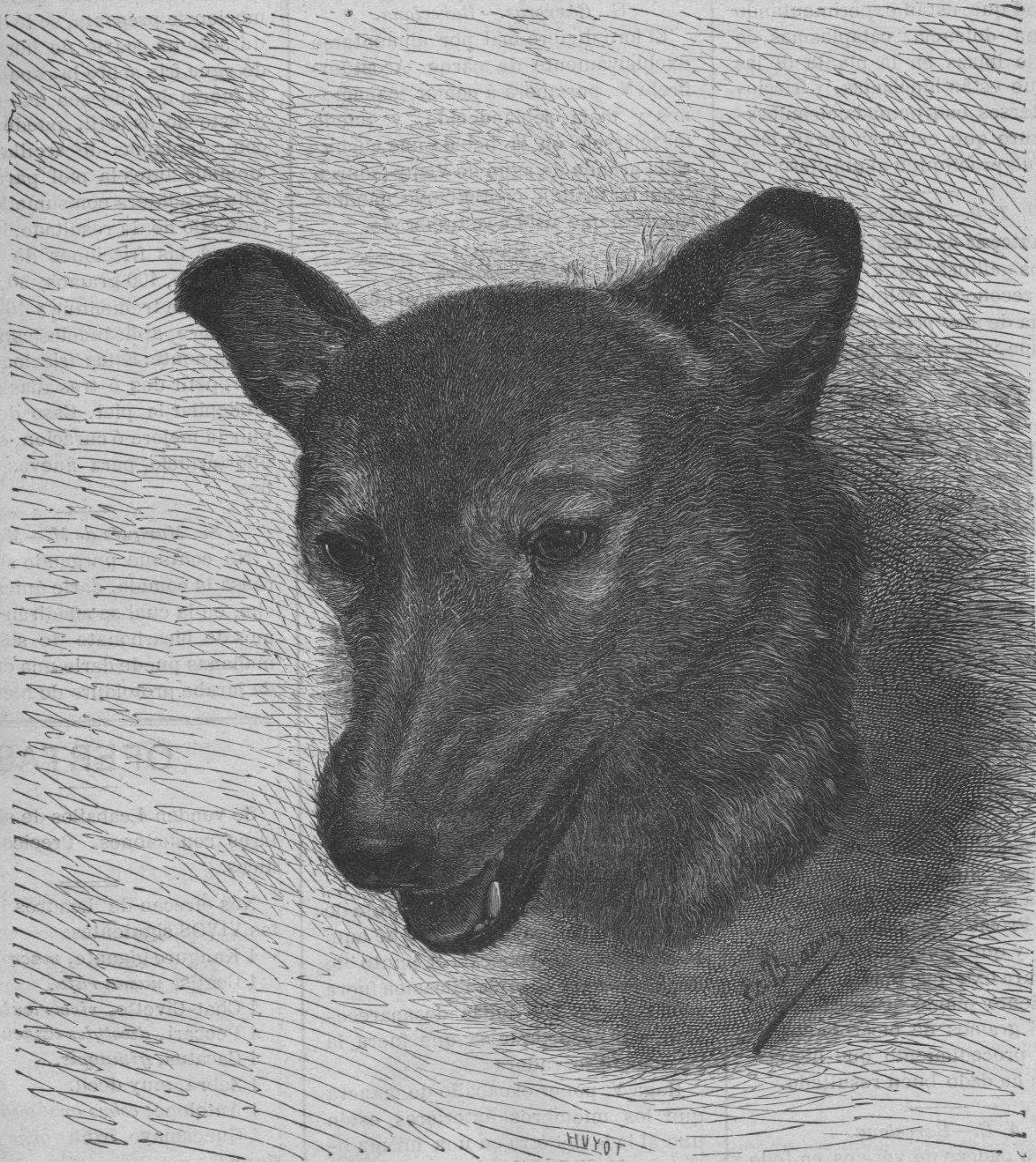
HÍBRIDO DE LOBO Y PERRO.

En Mónaco los tiros de pichon están concurridísimos