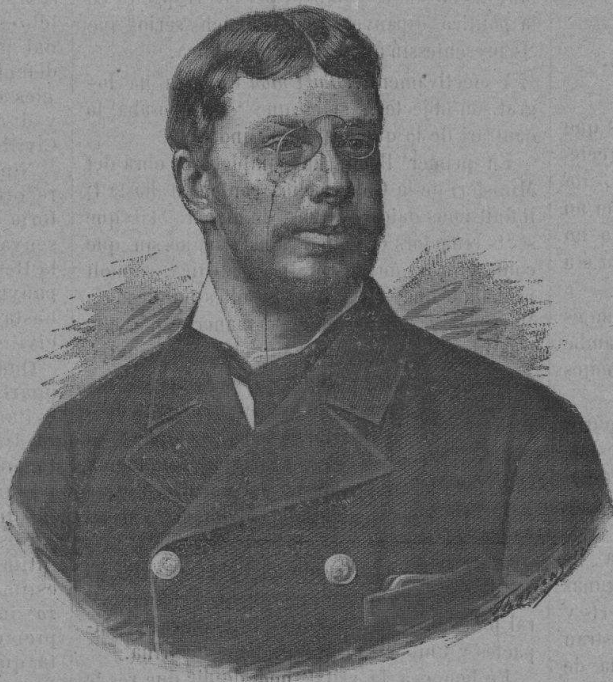
DON ENRICH DE BORBÓN Y DE BORBÓN COMTE DE BARDI

Serví brillantment en la caballería carlista del exércit del Nort, arribant hasta Comandant. Se distingí en molts accions pél seu valor, especialment en Lácar, ahont entrá en los carrers del poble perseguint las tropas lliberals, al costat del Marqués de Valde-Espina. Per aquell fet d' armas Don Carlos li doná la