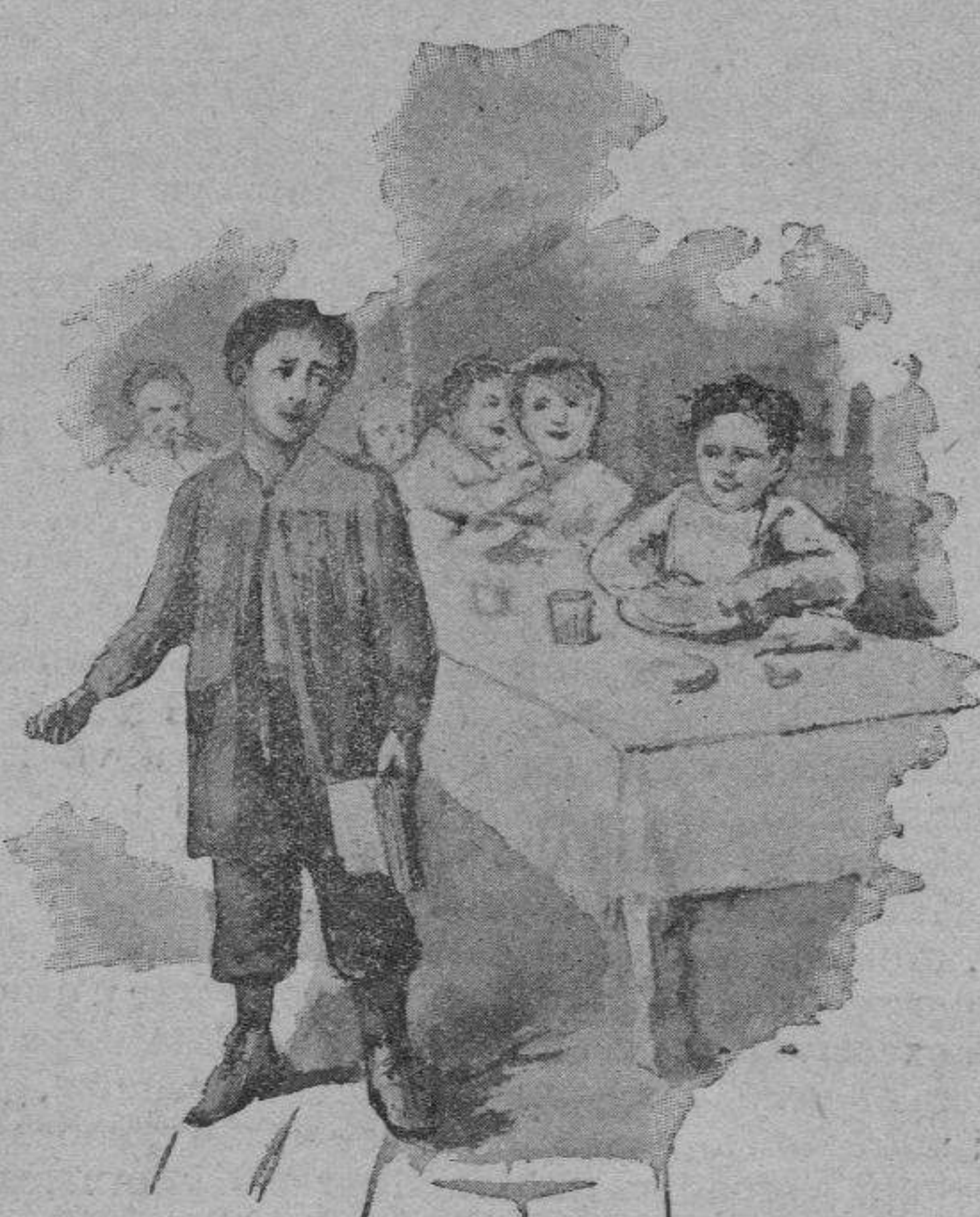
Un aspirant á Ministre

SUSCRIPCIÓ: Un any 3 pessetas.—Mitj any 1'50 Los suscriptors del interior, rebrán lo folleti encuadernat