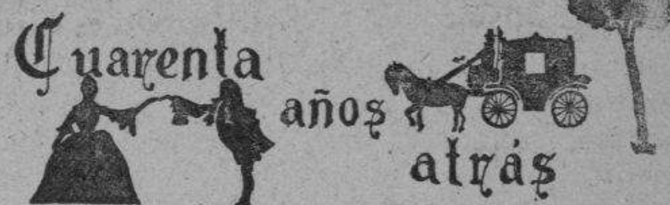
Notas tomadas de El Eco de Sitges del 3 noviembre de 1906.

Salidas del Paseo de Gracia para Sitges: a las 6, 7'15 (sólo los domingos y días festivos), 8'45, 10'15 (expreso a Valencia, martes, jueves y sábados), 13'15, 17'45 (expreso a Zaragoza, martes, jueves y sábados), 18'00 (sólo los días laborales), 19'10, 19'30, 20'30 (sólo los domingos y días festivos) y 21'25.