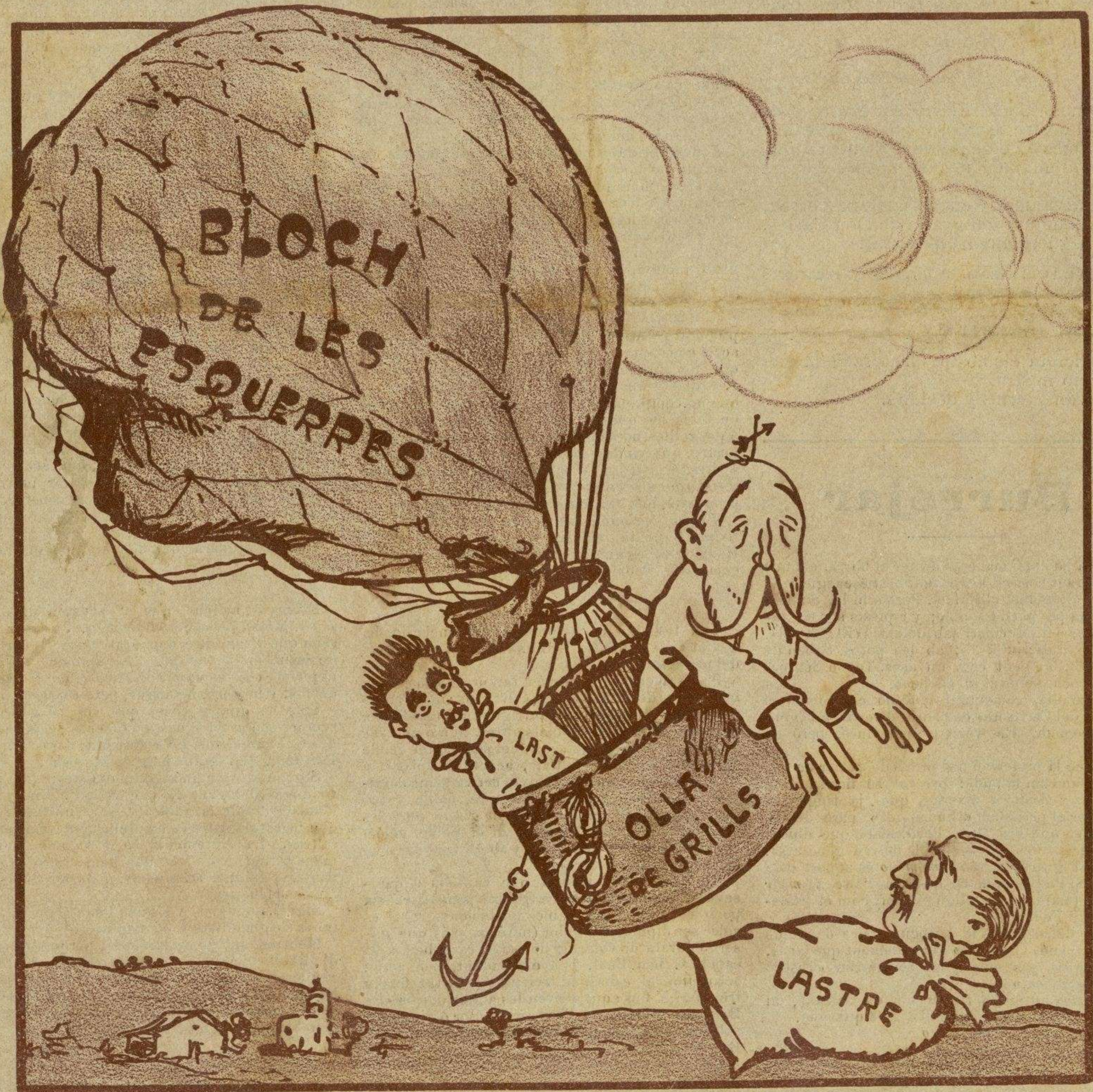
Quan vegi en Moret que'l lastre no'l deixa arribá al Poder, el llençarà, com qui llença un trasto que no serveix.