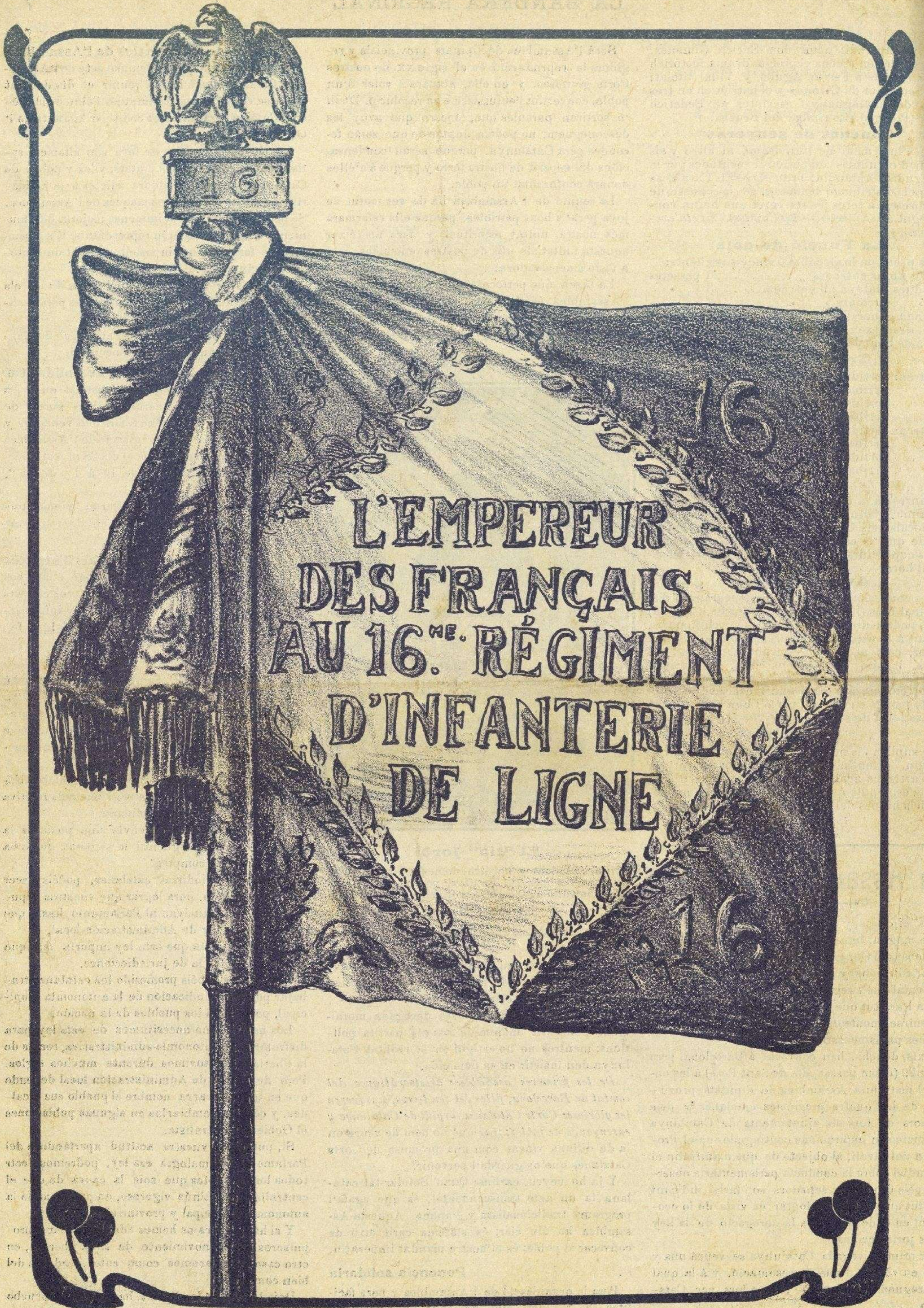
Estandart francès, apresát al Bruch