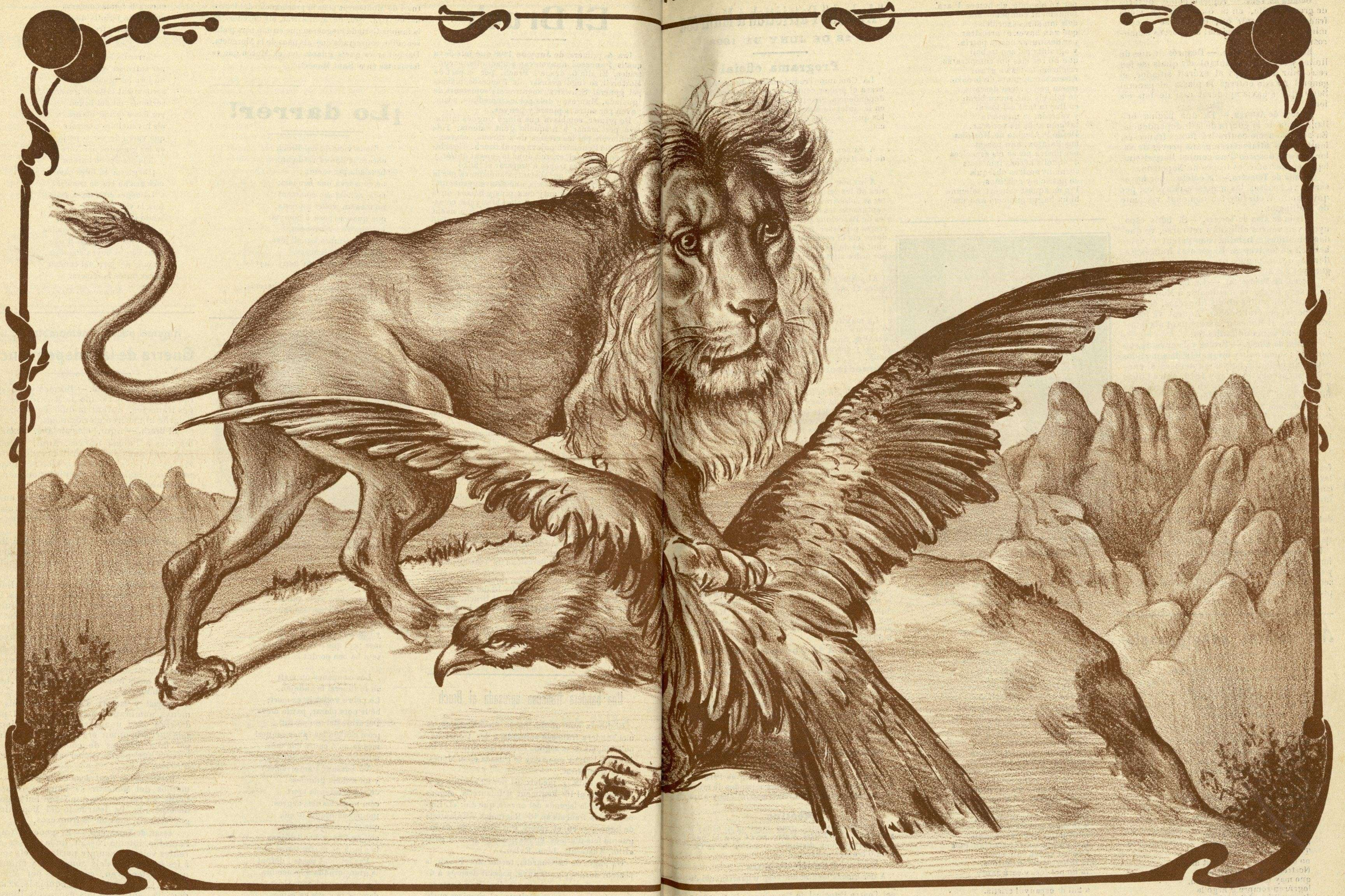
"EL B" - 1808