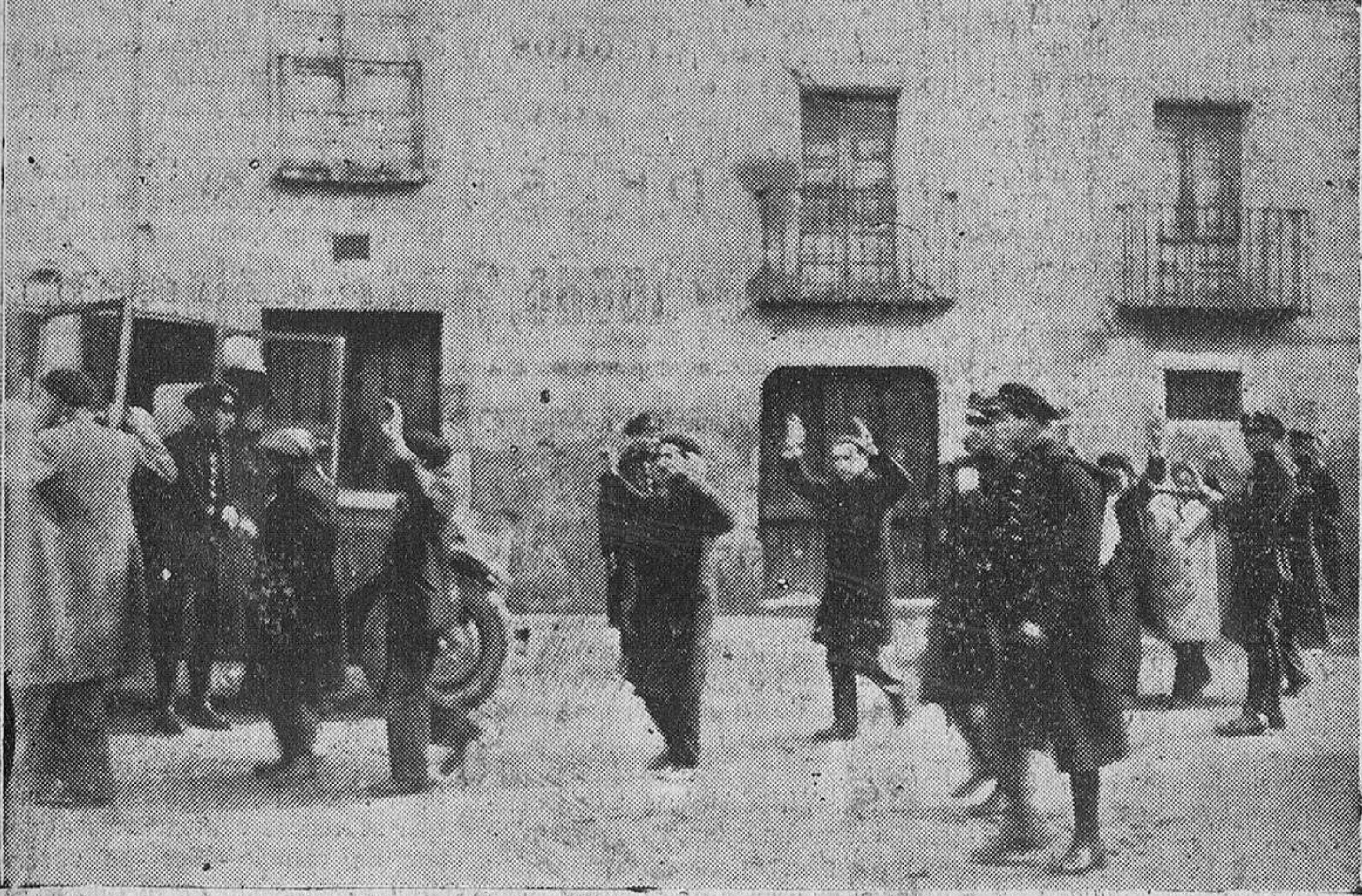
Arriba: Una carga de los guardias de Asalto, a las puertas de la Casa del Pueblo, el lunes. Abajo: Un grupo de detenidos después del tiroteo en la Casa del Pueblo.

viéndose obligada la Guardia civil a realizar algunas cargas.