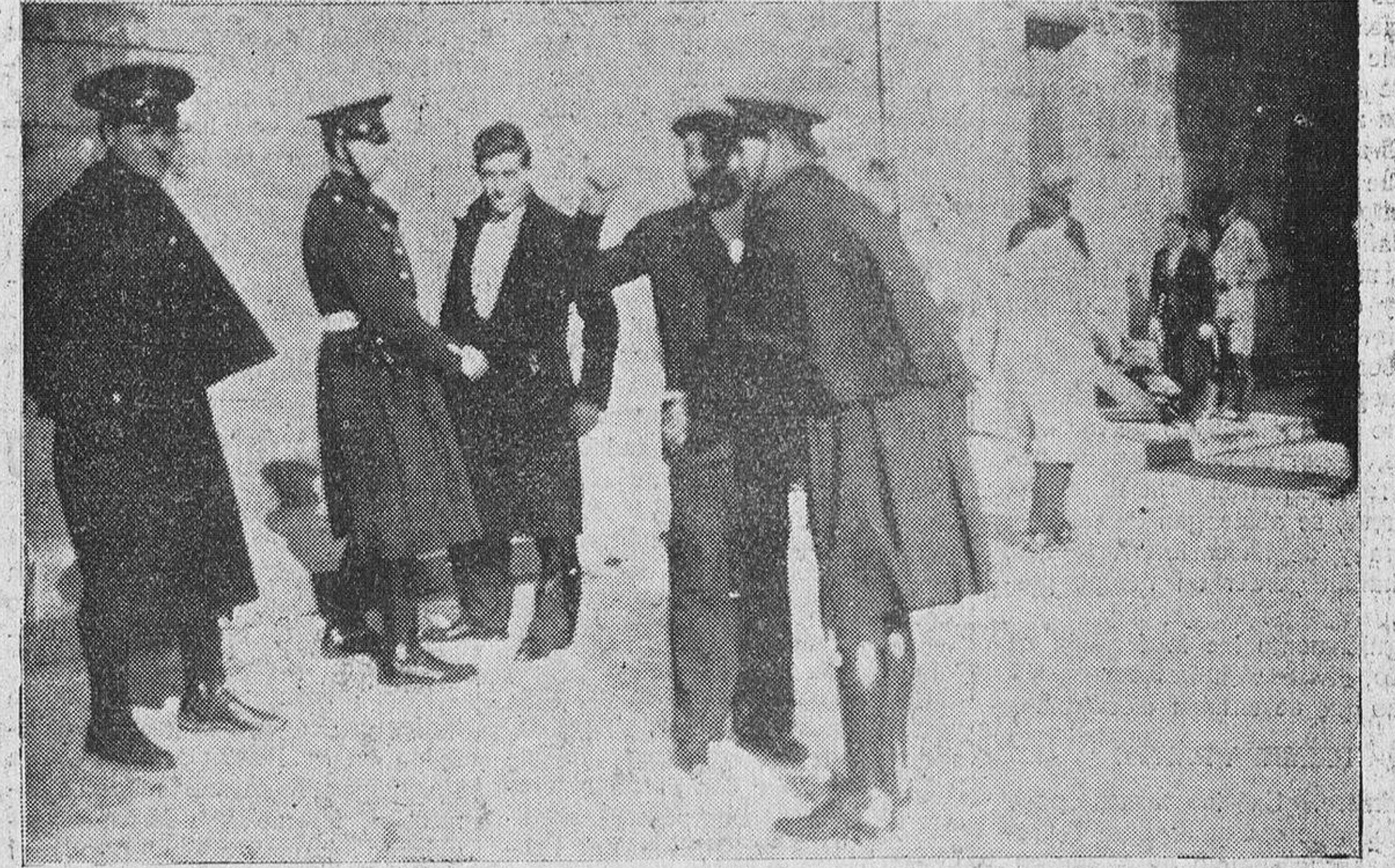
Arriba: Los guardias de Asalto conduciendo, detenidos, a tres mozaibetes, a la Comisaria. Abajo: Cacheos por las fuerzas de Seguridad.

los doce estaba completamente llena, en espera de la fórmula que habría de dar término al paro.