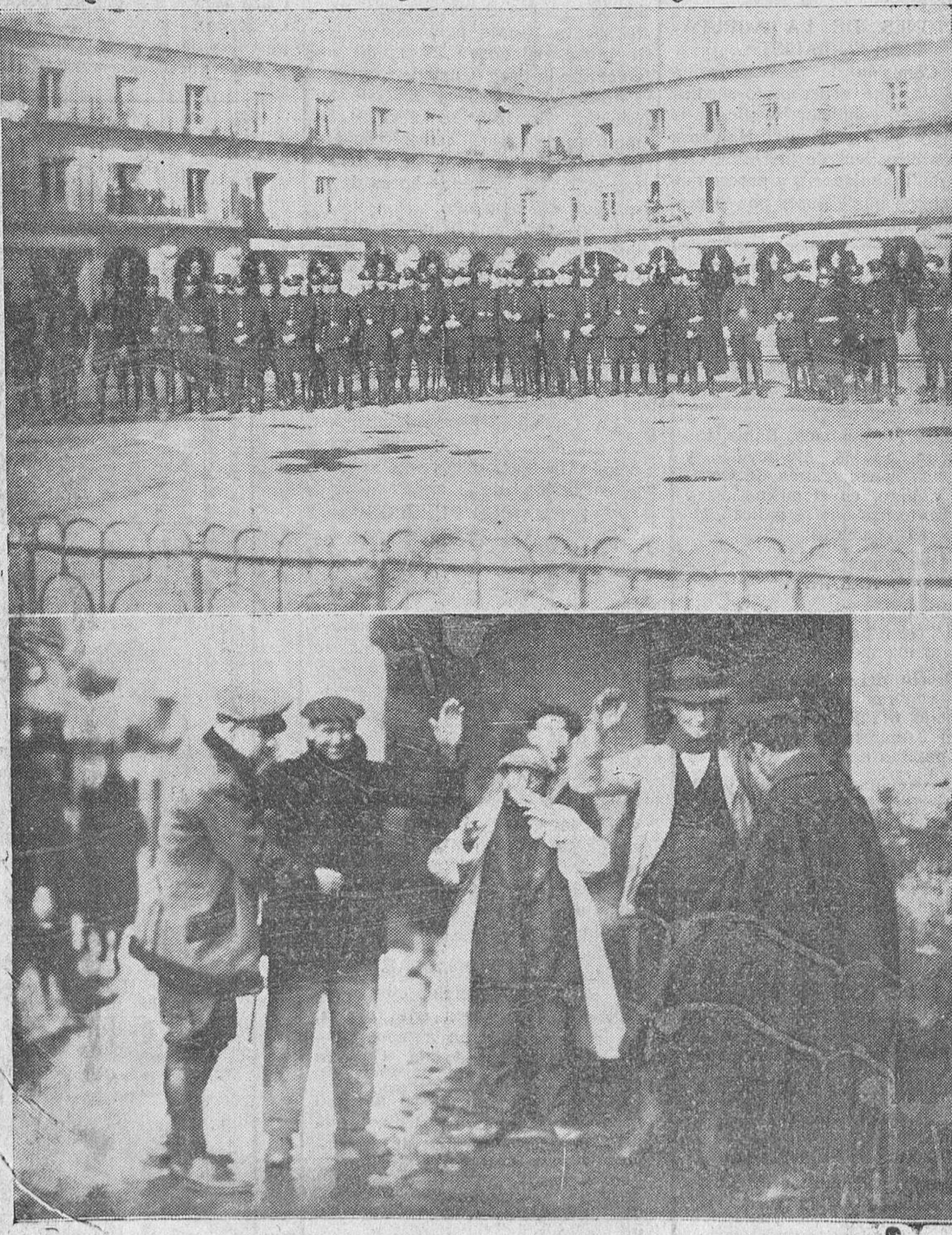
Arriba: La sección de guardias de Asalto que ha prestado servicio durante la huelga. Abajo: Los guardias de Seguridad practicando cacheos a la entrada de la Plaza Mayor

Continúa esta información en la página siguiente.